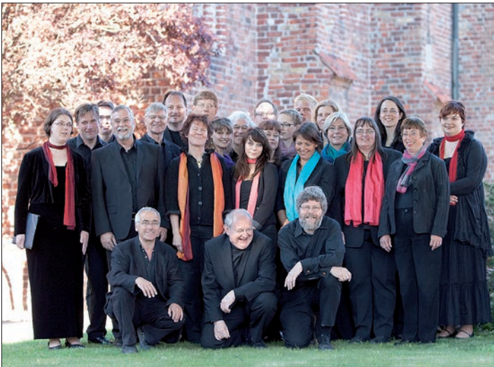
Der Neustädter Kammerchor.

Zahlreiche Zuhörer waren in der Neustädter Stadtkirche erschienen, um einem im wahrsten Sinne des Wortes be- „geist“-ernden Konzernachmittag mitzuerleben.