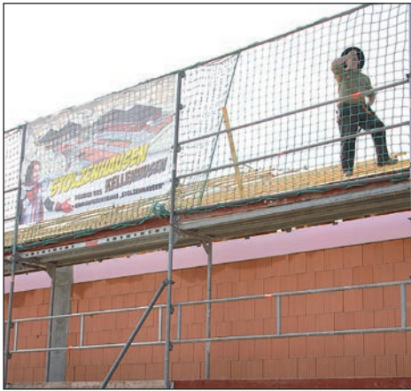
Zu einem ordentlichen Richtspruch gehört bekanntlich ein „Köm“.

Gut fünf Wochen nach dem ersten Spatenstich war in der Kirschenallee, direkt am Ortseingang, kaum mehr zu sehen war als Erde und Gras. Nun zeigt sich bereits der Rohbau des neuen Kaufhaus Stolz. Am 5. Juli wird im Ostseebad zwischen Wald und Wellen eine neue Filiale eröffnet.