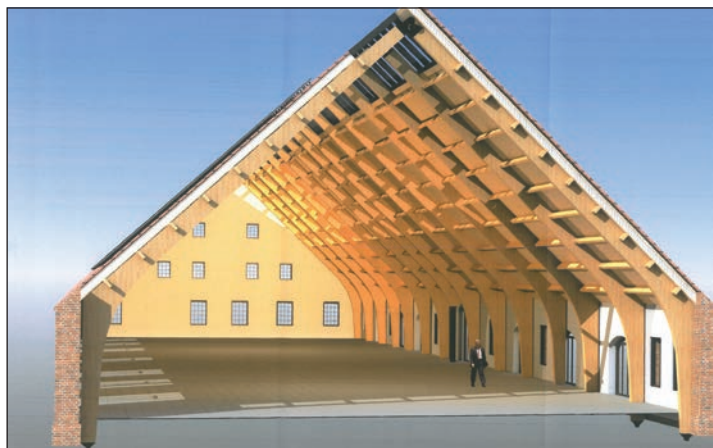
Das ehemalige Kuhhaus wird als eingeschossige Leimbinderhalle gestaltet.

Weitere bevorstehende Attraktionen auf Gut Hasselburg birgt das Kuhhaus: In ihm sollen historische Musikinstrumente in ihren vielfältigen Erscheinungsformen präsentiert werden; des Weiteren sollen ein Hörspielmuseum, ein Restaurant sowie die Energieversorgung Platz finden. Der Innenraum wird als eingeschossige Leimbinderhalle gestaltet, die mit kleinen Containerelementen ein Haus in Haus-Konzept für verschiedene Nutzungsmöglichkeiten vorsieht. Neuerungen gibt es auch außerhalb des Gutsgeländes auf der Wiese an der Allee. Hier beginnt im Juli der Bau eines Parkplatzes.