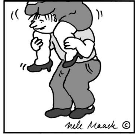
Eine Geschichte in Bildern in Anlehnung an die Fußball-Europameisterschaft.