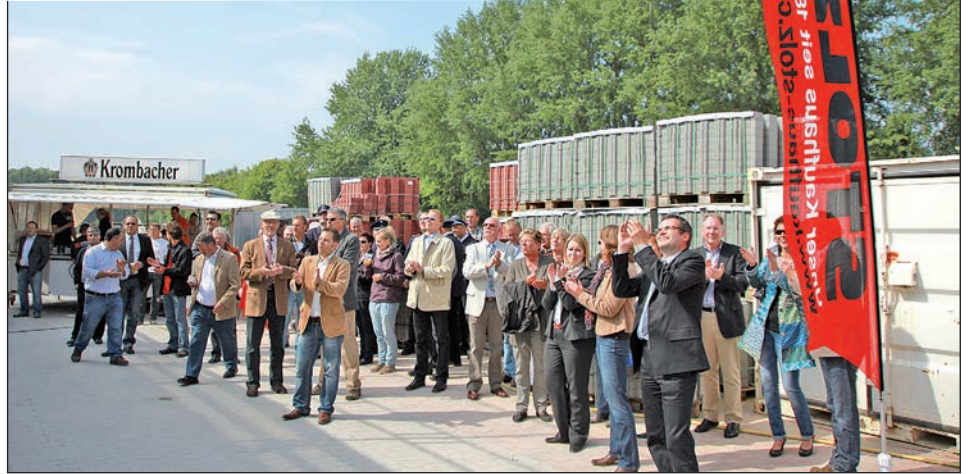
Gäste des Richtfestes.