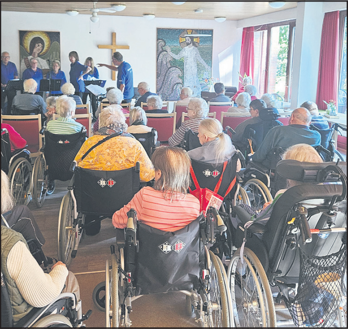
Burg. Anlässlich des 12. Shanty- und Seemannsliederfestivals in Burgstaaken organisierte der Festivalverband einen sozialen Auftritt des Küstenchor Heiligenhafen im Seniorenpflegeheim Tabea, um auch den Senioren, die nicht nach Burgstaaken gelangen konnten, eine musikalische Freude zu bereiten. Der Auftritt wurde von den Seniorinnen und Senioren begeistert angenommen.