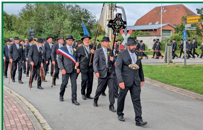
Von der Feuerwehr marschierten die Gildebrüder zurück zum Festplatz.