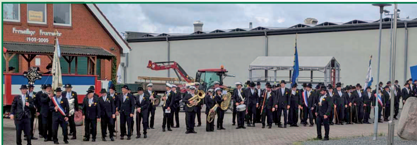
Die Gildebrüder vor dem Feuerwehrhaus.