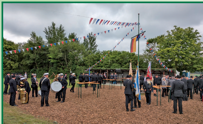
Der Festplatz vor dem Gillhuus.