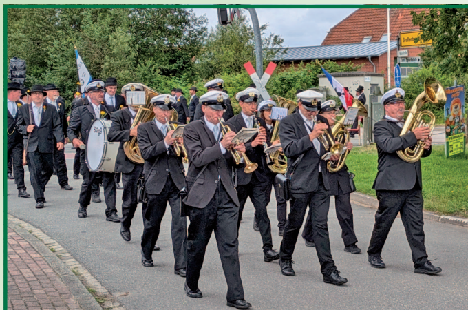
Die Gildekapelle gibt den Ton an.