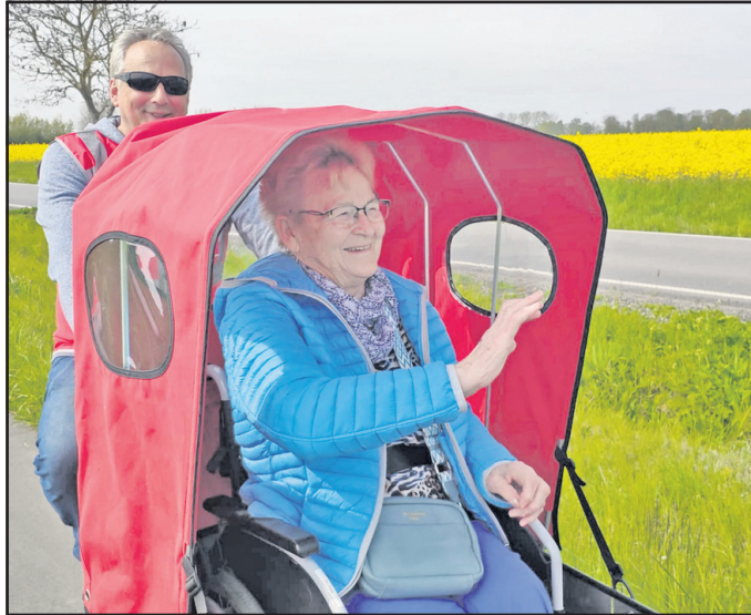
Schöne Momente bei einer Rikscha-Fahrt, das verspricht das neue Projekt der AWO Fehmarn.