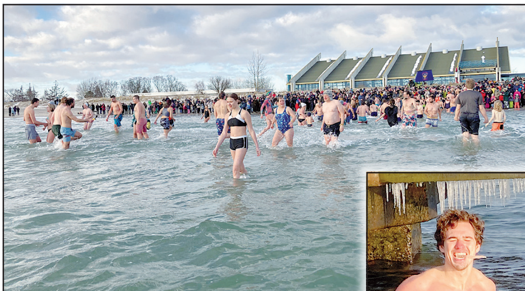
Zum 30. Mal lud die Landjugend Fehmarn am vergangenen Sonntag am vergangen Sonntag baden an den Südstrand in Burg- tiefe. 119 wagemutige Kinder, Frauen und Männer eröffneten bei