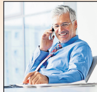
Geschäftsführer würden ihre Arbeitszeit gerne reduzieren – und im Gegenzug mehr Zeit für die wichtigen Entscheidungen im Unternehmen haben.

Einen gemütlichen Lenz wollen sich die befragten Geschäftsführer aber keinesfalls machen. Denn in der Studie zeigt sich auch, dass sie gerne produktiver und strategischer arbeiten würden, um ihr Unternehmen fit für die Zukunft zu machen. So wünschen sich 54 Prozent der Befragten mehr Zeit für Unternehmensstrategien, 46 Prozent für die Entwicklung von Visionen, und 26 Prozent erwarten, dass sie künftig ihre Arbeits-