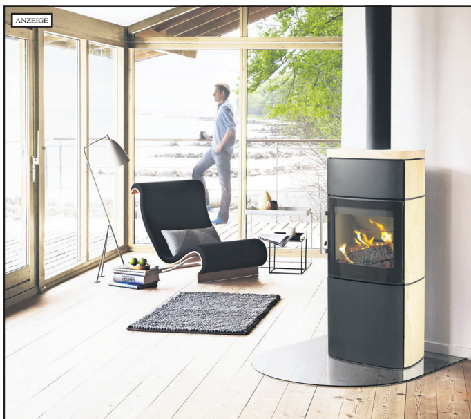
Ein moderner Kaminofen, der eine veraltete Feuerstätte ersetzt, hilft Schadstoffe um bis zu 85 Prozent zu reduzieren.

Frankfurt am Main. (hki) Aufgrund des Bundes-Immissionsschutzgesetzes (1.BImSchV) müssen Ende 2017 alle alten Kaminöfen, Kachelofeneinsätze sowie Heizkamine mit einer Typprüfung vor 1985 stillgelegt, nachgerüstet oder ausgetauscht werden, wenn sie die vorgegebenen Grenzwerte nicht erfüllen. Darauf macht der HKI Industrieverband Haus-, Heiz- und Küchentechnik e.V. aufmerksam. Nach Hochrechnung des Verbandes sind von dieser Maßnahme