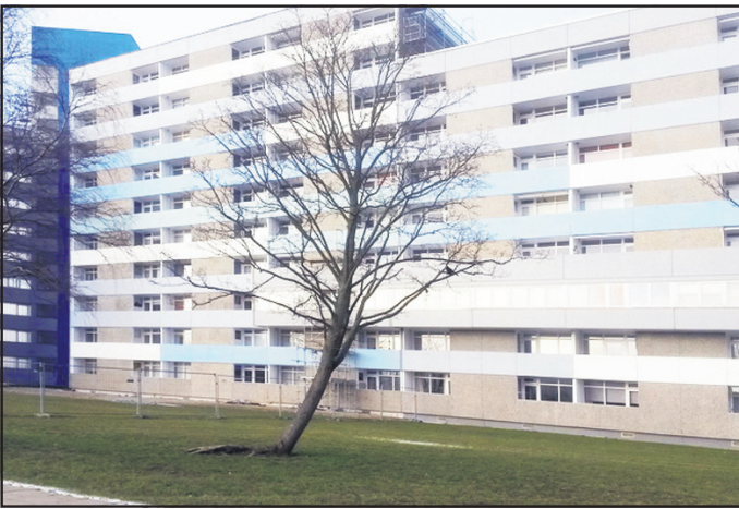
Dieses Bild ist am 21.01.2016 entstanden. Das Ergebnis kann sich sehen lassen.