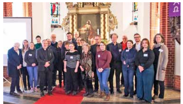
Das Symposium in Hansühn hat sich als Forum für Austausch in Sachen Forschung rund um das Archiv der Grafen von Platen etabliert.

Das Symposium hat selbst eine mittlerweile dreizehnjährige Tradition und beschäftigt sich dieses Mal mit Traditionen, Recht