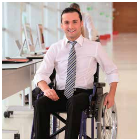
Mit oder ohne Behinderung – der Arbeitsmarkt bietet viele Möglichkeiten.

Ostholstein (t). Die Lübecker Arbeitsagentur lädt am Donnerstag, 27. Februar, zum „Talente-Speeddating“ ein. Wer sich vorstellen kann, seine berufliche Zukunft bei der Agentur für Arbeit zu gestalten, ist eingeladen, von 10.30 bis 12 Uhr zum „Talente-Treffen“ in das Berufsinformationszentrum (BiZ) in der Hans-Böckler-Str.1, in Lübeck zu kommen. Eine vorherige Anmeldung ist nicht notwendig. Von Vorteil ist es aber, für den Besuch der Veranstaltung einen Lebenslauf dabei zu haben.