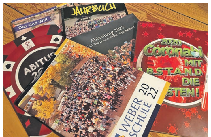
Beim Treffen wurde in alten Jahrbüchern geblättert.

besonderen Gesprächsstoff sorgte. Der aktuelle 13. Jahrgang, der im nächsten Jahr als Ehemalige teilnehmen kann, versorgte die Teilnehmenden während des Nachmittags mit Kuchen und verdiente sich dabei auch etwas Finanzierung des Abiballs hinzu.