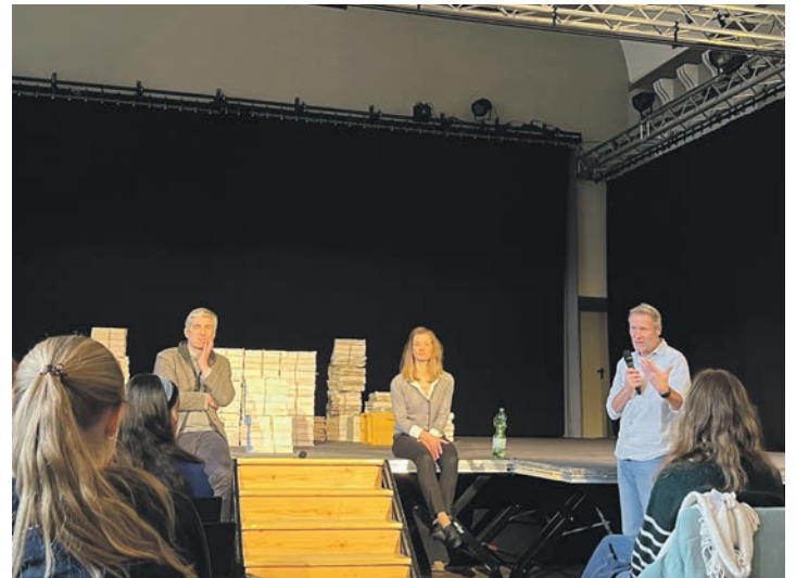
Im Anschluss an das Theaterstück wurden auch rechtliche Fragen beantwortet.

darzustellen, wurde perfekt umgesetzt. Das Publikum war von dieser dynamischen Vorstellung begeistert und stellte im Anschluss daran viele Fragen.