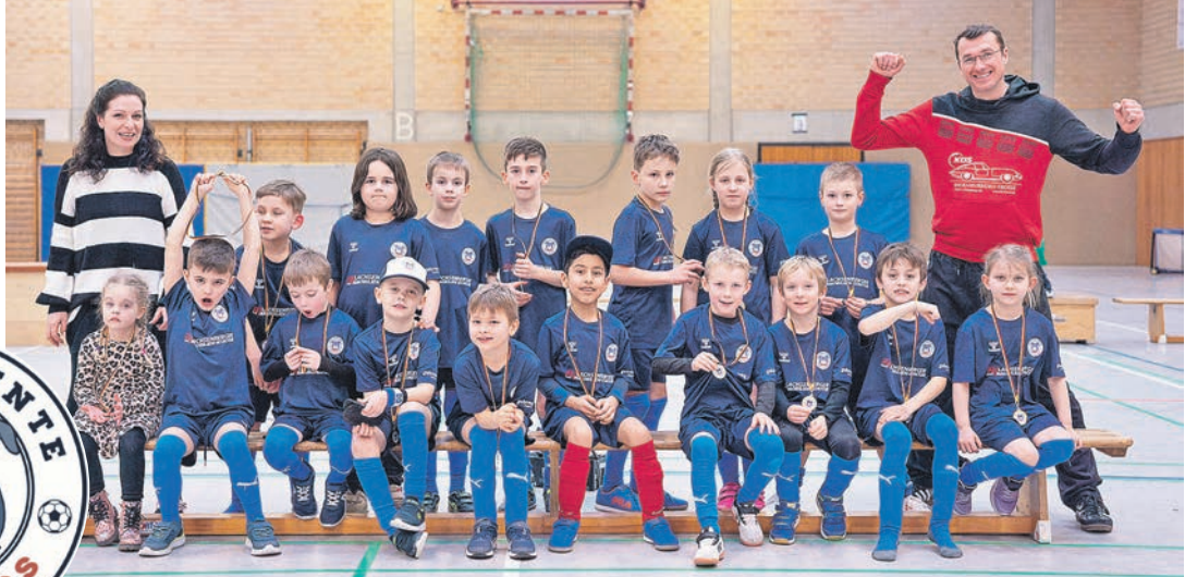
Die stolze F-Jugend der Malente Bulldogs