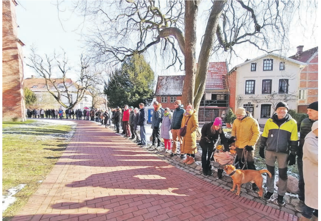
2.000 Menschen stark war die Menschenkette.

Eutin (aj). „Eutin ist bunt“ – das Motto des Organisationsteams aus Vereinen, Initiativen und Kirche schien gleichzeitig eine Hoffnung zu sein, dass sich genau dies mit der Menschenkette am 15. Februar bestätigen möge. Angesichts der 2.000 Menschen, die dem Aufruf gefolgt waren, eine Menschenkette für Demokratie und Vielfalt zu bilden, ist die Selbstvergewisserung eine Woche vor der Bundestagswahl geglückt. Denn die am vergangenen Sonnabendmittag im Stadtzentrum zusammenkamen, begegnen einander nicht täglich: Gruppen, Privatleute, Initiativen, Lehrkräfte und Erzieher*innen, Pastor*innen, Antifa, Parteien, Jung und Alt formierten sich zu einer Kette, die in der Peterstraße ihren Anfang nahm, sich am Wochenmarkt entlang durch die Königstraße und rund um die Kirche, über den Marktplatz am Rathaus vorbei bis zum Startpunkt schlängelte. Bunt war nicht nur die Mischung, bunt waren auch die Plakate und Regenschirme, die Buttons und Outfits, die eines gemeinsam hatten: Die Absicht nach außen zu tragen, dass Vielfalt und Toleranz ein wesentliches Merkmal der Stadtgesellschaft sein sollten. Es war der kleinste gemeinsame