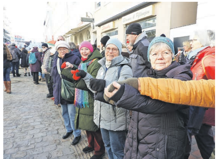
Hand in Hand standen die Menschen.