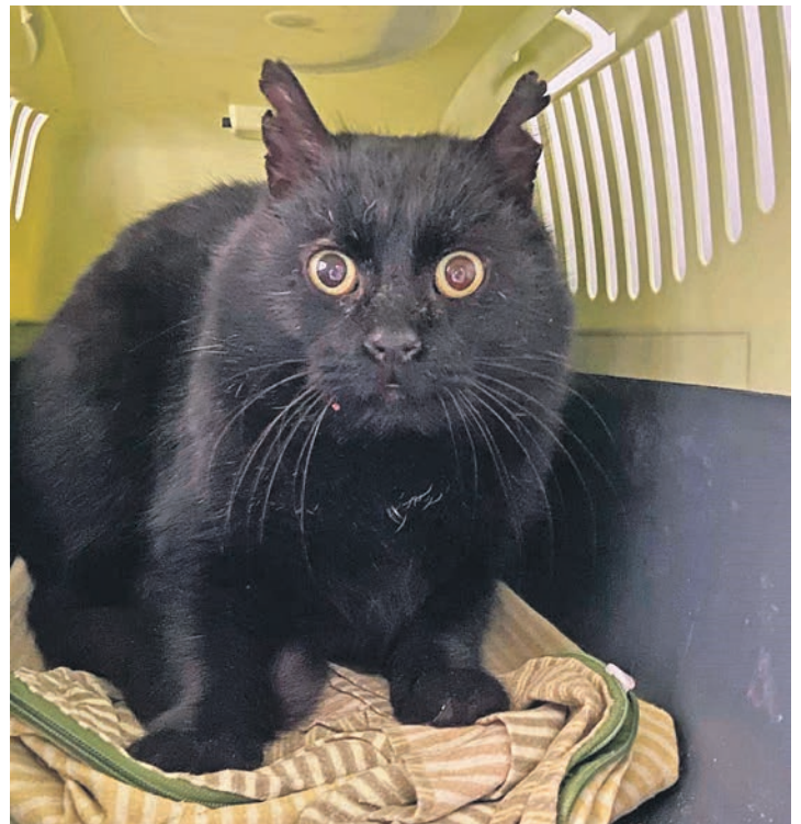
Wer diesen Kater vermisst, findet ihn im Eutiner Tierheim.

genehm ist. Und als er sich nun in einem Hühnerstall aufwärmen wollte, war die Chance da, ihn einzufangen. Leider ist sein Chip nicht registriert, aber er hat am linken Ohr eine unverkennbare Kerbe. Jetzt kann er im Tierheim gemütlich darauf warten, dass seine Besitzer, wenn er denn welche hat, ihn abholen.