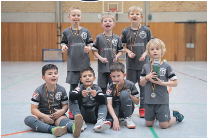
Die G-Jugend der Bulldogs freute sich über Medaillen für alle.

von den Kleinen bejubelt und gefeiert wie bei den Profis. Ein großer Dank geht auch an alle Helferinnen und Helfer, die das Turnier gut organisiert haben und mit einem großem Cateringange-