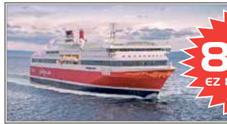
Norwegen-Kreuzfahrt direkt nach Bergen