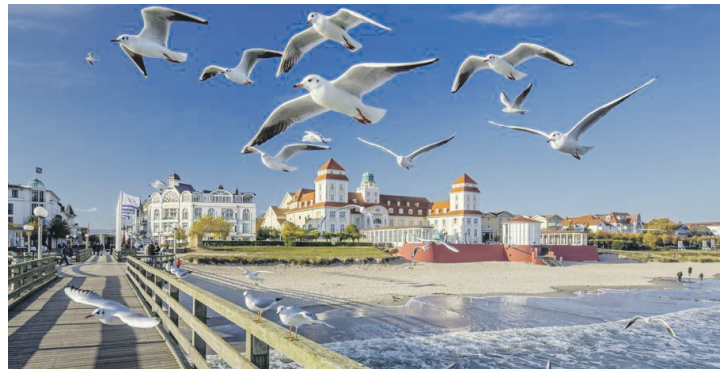
Das mondäne Seebad Binz auf Rügen erwartet unsere Leser zur großen Saison-Eröffnungs-Reise zum einmaligen Schnäppchenpreis.

Zum großen Leistungspaket gehören neben der Fahrt im 4-Sterne-Fernreisebus direkt ab Eutin ohne Einsammeltour zwei Übernachtungen im Top-Hotel in Binz auf Rügen mit Frühstücks- und Abend-Schlemmer-Buffets inklusive Getränk, eine große Insel-Rundfahrt Rügen mit fachkundiger Reiseleitung am zweiten Tag sowie die kostenlose Hallenbad-Nutzung und WLAN kostenlos im Hotel. Die Anreise erfolgt mit einer Mittagspause in der Hansestadt Stralsund, die Rückreise mit einer Mittagspause im beliebten Ostseebad Warnemünde, die Kurtaxe ist direkt im Hotel vor Ort zu bezahlen. Anmeldungen sind ab sofort möglich bei den Reporter-Leser-Reisen des Burg-Verlages in Eutin, Montag bis Freitag von 9 bis 13 Uhr unter Telefon 04521-701130 oder online direkt im Internet unter „leserreisen.der-reporter.info“.