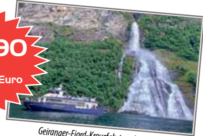
Geiranger-Fjord-Kreuzfahrt zu den weltberühmten Wasserfällen im Reisepreis bereits enthalten!

• Reisetermine: 05. - 10.06.2025 („Helle Nächte“) • 20. - 25.08.2025 (Sommerferien)