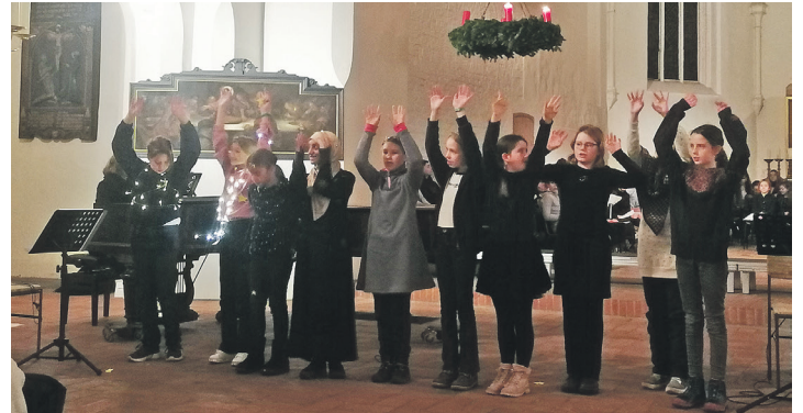
Der Chor der Orientierungsstufe zeigte: Auch Stimmen können leuchten.

inspirierte und machte einfach Spaß. Der Mut, die leisen Töne wirken zu lassen wie beim „Ich seh’ dich“ von Oliver Geis wurde ebenso belohnt wie der Schwung des Chores der Orientierungsstufe bei den Songs aus dem Musical „Leben im All“. Natürlich ist ein solches Konzert immer auch eine Talentschau und da funkelten echte Diamanten iwie Alice Kühnel, bei de-