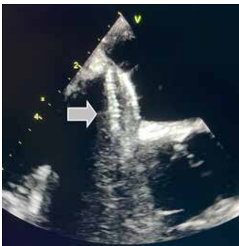
Ultraschallbild des implantierten Okkluders. Seine zwei Scheiben verschließen die Vorhofscheidewand und verhindern so einen Blutübertritt von der rechten zur linken Herzhälfte.