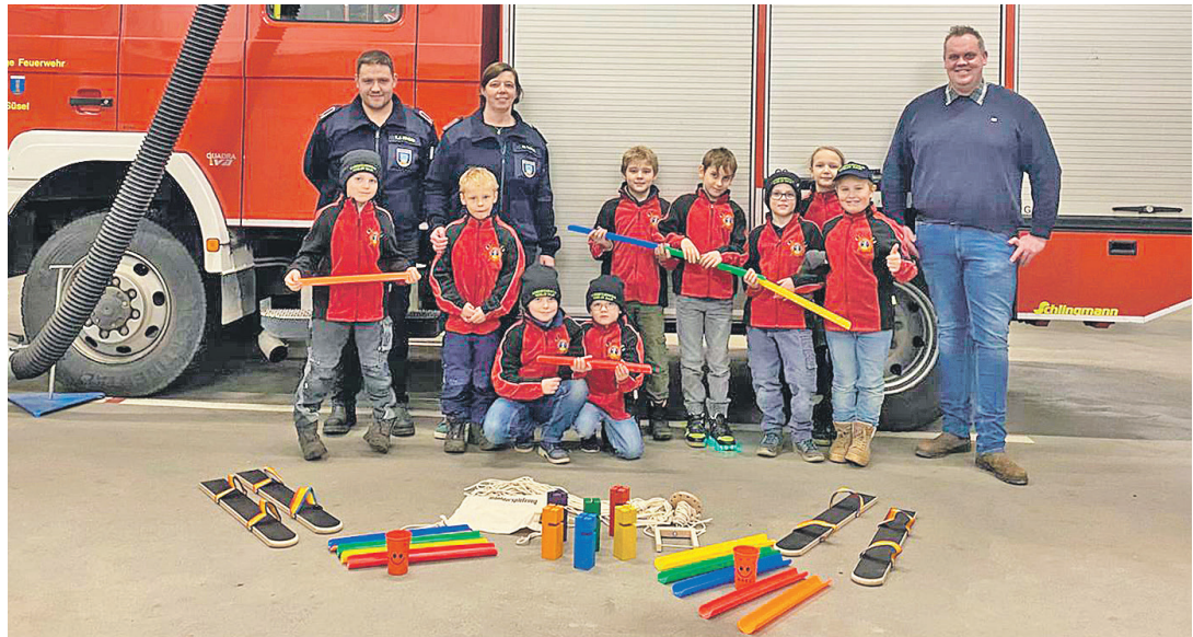
Die Kinderfeuerwehr Süsel freut sich über Spielzeug, das auf den Dienst vorbereitet.

Aktuell zählt die Nachwuchstruppe 18 Kinder und es ist noch Platz für Verstärkung. Wer also zwischen sechs und zehn Jahren alt ist und sich einer fröhlichen Gemeinschaft anschließen möchte, in der Spiel und Spaß wichtig sind, aber auch Inhalte wie Brandschutzerziehung (Umgang im Brandfall, Absetzen eines Notrufes), Erste Hilfe, Fahrzeugkunde und Umgang und Handhabung mit Feuerwehr-