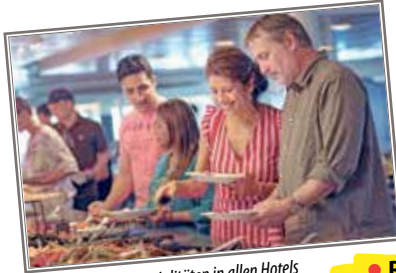
Skandinavische Spezialitäten in allen Hotels