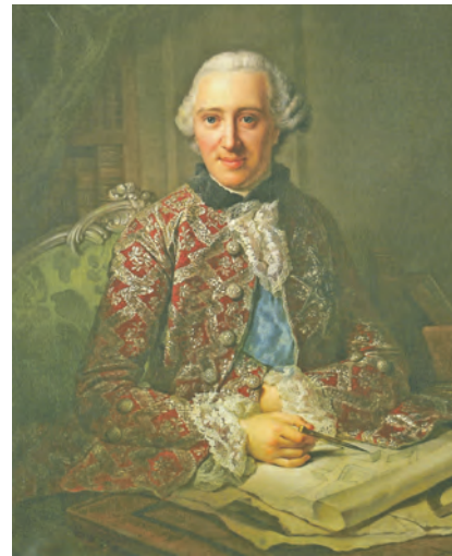
Friedrich Wilhelm von Hessenstein, Porträt nach Georg David Matthieu, 1762

Fürst Friedrich Wilhelm war einer von zwei Söhnen aus der Liebesbeziehung zwischen König Friedrich I. von Schweden und der schwedischen Hofdame Gräfin Hedvig Ulrica Taube. Zunächst mit dem Titel Graf von Hessenstein versehen, erhob ihn Kaiser Joseph II. später zum Fürsten von Hessenstein. Sein bewegtes, abwechslungsreiches Leben war anfänglich geprägt von Schicksalsschlägen in der Jugend und später den Idealen der Aufklärung verpflichtet, wobei er sich auch für