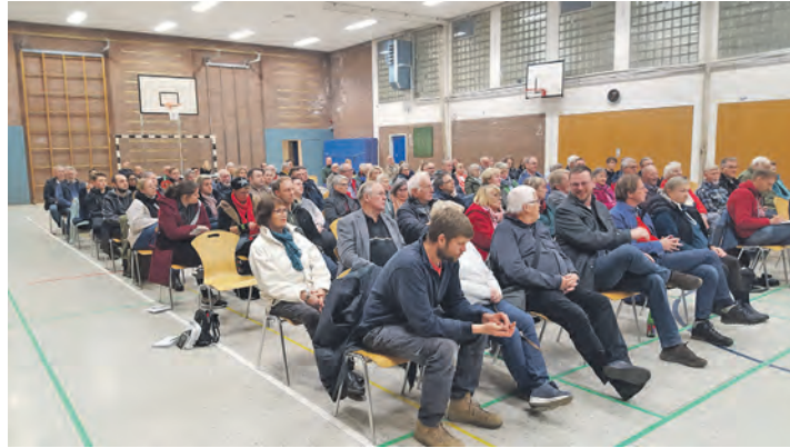
Circa 90 Interessierte kamen zur Vorstellung des Ortsentwicklungskonzeptes in die Sporthalle Hutzfeld.

Durch die Schließung der weiterführenden Schule in Hutzfeld steht ein großer Teil des Gebäudes leer. Die Räume könnten für Bildungs- und Veranstaltungsangebote wie Bücherei, Kulturräume und -café, außerschulische Programme und Workshops sowie Gemeinschaftsprojekte und einen Jugendtreff genutzt werden. Aktuell gibt es in der Gemeinde wenig Möglichkeiten, sich vor