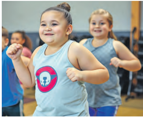
Die BSG ist Partner des ZIMT-Bewegungstrainings.