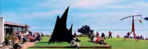
Kunst-Museum „Louisiana“ in einmaliger Lage am Öresund

Eines der berühmtesten Kunst-Museen der Welt in einmaliger Lage am Öresund nördlich Kopenhagens erwartet unsere Leser:innen zum genussvollen Kunst-Erlebnis der Extraklasse mit einmaligen Kunst-Ausstellungen, atemberaubender skandinavischer Architektur und malerischen Parks und Gärten direkt am Öresund mit ausreichend Freizeit (Eintritt zahlbar vor Ort). Besuch des weltberühmten „Königs-Domes“ in