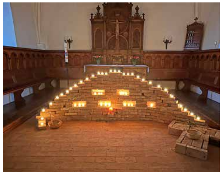
Die Hoffnungs-Lichterwand erinnert an die Verstorbenen.