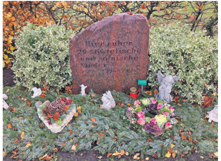
Ein Grabstein erinnert an 29 sowjetische und polnische Kinder.

Kinder von Zwangsarbeiterinnen galten im nationalsozialistischen Deutschland als unerwünscht. Wurden Frauen trotz ihrer ohnehin prekären Lebensumstände schwanger, wurden viele von ihnen zu Abtreibungen genötigt. Andere mussten ihre Neugeborenen in einfachsten Einrichtungen wie der in Lensahn abgeben. Grundlage für dieses Vorgehen war ein Erlass des Generalbevoll-