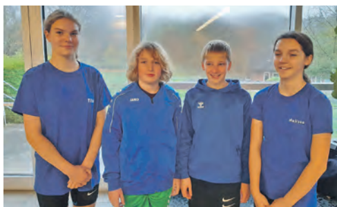
Das Malenter Schwimm-Team freut sich über beste Ergebnisse beim Wettkampf in Bad Schwartau.

Bad Malente-Gremsmühlen (t). Am Sonntag 10. November, fand in Bad Schwartau ein Schwimmwettkampf statt, bei dem ausschließlich lange Strecken angeboten wurden. Ab 200 Meter aufwärts standen auch 400er, 800er und 1500er Strecken sowie die 100 Meter Lagen auf dem Plan. Neun- und siebenzig Schwimmer*innen der Vereine PSV Eutin, SC Delphin Lübeck, Schwimmzentrum Elmsborn, SG Bad Schwartau, SG Neumünster, TSV Bargtheide, TSV Klausdorf und natürlich des TSV Malente waren am Start. Einlass war um 8.30 Uhr, um 9.15 Uhr begann der Wettkampf und dauerte sechs Stunden. Als Malenter Kampfrichter waren Michaela und Björn Mohr, Ina Steinke und Jörg Hardorp im Einsatz. Als Betreuer war Sven Künzel vor Ort. Die