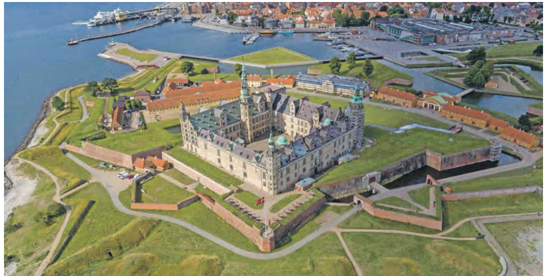
Traumhafte See-Festung am Öresund: Das malerische Schloss Kronborg erwartet unsere Gäste zum großen Weihnachtsmarkt.

Eutin (t). Eines der schönsten Renaissance-Schlösser der Welt erwartet unsere Leser*innen in atemberaubender Traumlage direkt am Öresund am Sonntag, 1. Dezember, mit Blick auf Schweden in Helsingör an der Nordspitze der Insel Seeland im weltberühmten Hamlet-Schloss „Kronborg“, wo einst in der gigantischen Seefestung Shakespeares Tragödie „Hamlet“ spielte und wo nunmehr ein traumhafter Weihnachtsmarkt „mit Meerblick“ in den alten Kasematten, im gewaltigen Festungswerk und im Schloss mehrere hundert Weihnachtsstände mit prachtvoller Dekoration begeistern werden. Die Anreise erfolgt direkt ab Eutin via die Vogelfluglinie mit den Scandlines-Großfähren über vier dänische Inseln zum Schloss Kronborg inklusive Eintritt und drei Stunden Freizeit.