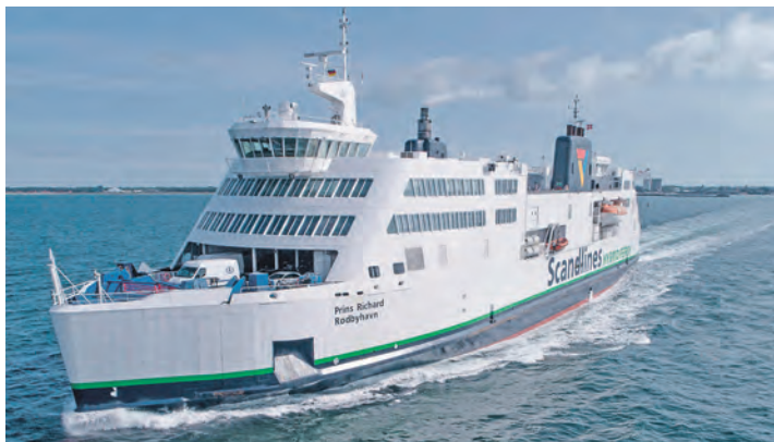
Kurs Nord auf der Weihnachtsstraße Skandinaviens erfolgt die Hin- und Rückreise mit den Scandlines-Fähren.