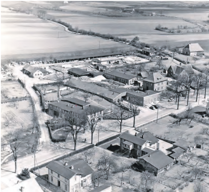
Eine historische Luftaufnahme aus dem Jahr 1955, das „Kinderheim Ost“ lag am Schwienkuhler Weg.

Ostholstein (t). Wenn am kommenden Sonntag, 17. November, der Volkstrauertag begangen wird, dann gilt das Gedenken in vielen Kirchengemeinden im Kirchenkreis Ostholstein diesmal vor allem auch den Kindern von Zwangsarbeiterinnen, die im sogenannten „Kinderheim Ost“ in Lensahn nur wenige Tage oder Monate nach der Geburt starben.