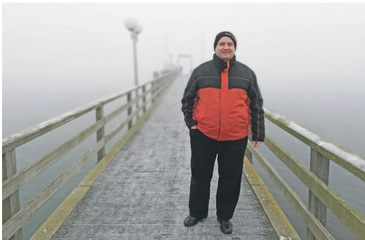
Das Übergewicht gehört für den Süseler der Vergangenheit an.

mo:bi schön NATURKOSMETIK ab SA 16.11.'24 MO bei EZRAH! -KLEINER KÖNIG- Stolbergstr.13 23701 Eutin FESTES SHAMPOO DUSCHBARS HANDBALSAM HAARÖL GESICHTSÖL etc