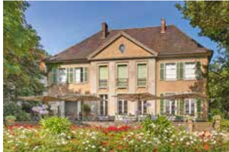
Die berühmte Liebermann-Villa am Wannsee entdecken die Reporter-Leser mit einer großen Sonderführung.