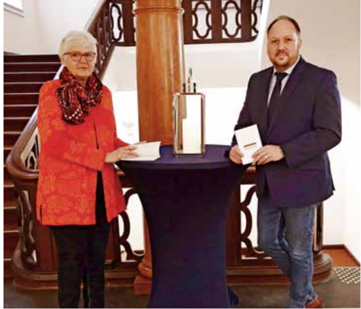
Das „Licht der Demokratie“ erinnert in der Kreisverwaltung an die Ereignisse des 9. November.