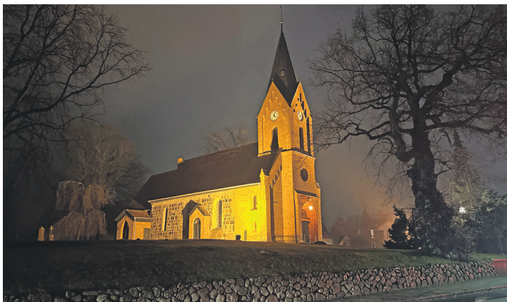
Zum Martinstag wird in der Maria-Magdalenen-Kirche Gottesdienst gefeiert.