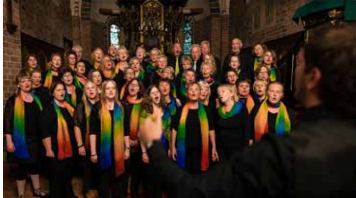
„Voice company“ kommen mit ihrem Programm „Heaven on earth“ nach Lensahn.