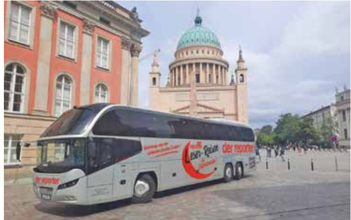
Weltkunst vom Feinsten erwartet die Leser in Potsdam und Berlin bei der großen Kunst-Sonderreise vom 15. bis 16. Februar 2025.

Residieren werden die Gäste der Sonderreise