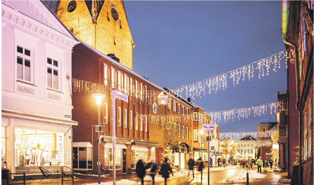
In der Königstraße wurden bereits Patenschaft von den Händlern übernommen.

Eutin (t). Seit Ende September sucht die Eutin Tourismus GmbH für die weihnachtlichen Überspannungen in den Einkaufsstraßen der Eutiner Altstadt sogenannte Leuchtpaten. 33 der insgesamt 39 Patenschaften für die festliche Beleuchtung sind bereits erfolgreich vergeben. Sowohl Gewerbetreibende als auch zahlreiche Privatpersonen haben sich beteiligt. Auch wenn noch sechs Patenschaften fehlen, werden die Überspannungen seit Anfang der Woche bereits in den Eutiner Einkaufsstraßen aufgehängt. „Zuerst möchte ich hervorhe-