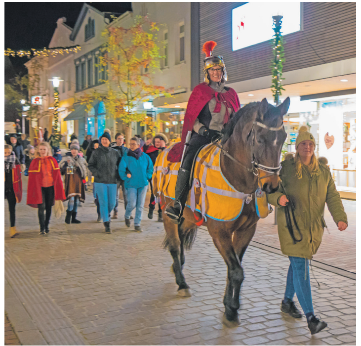
Sankt Martin reitet am 11. November durch Eutin.