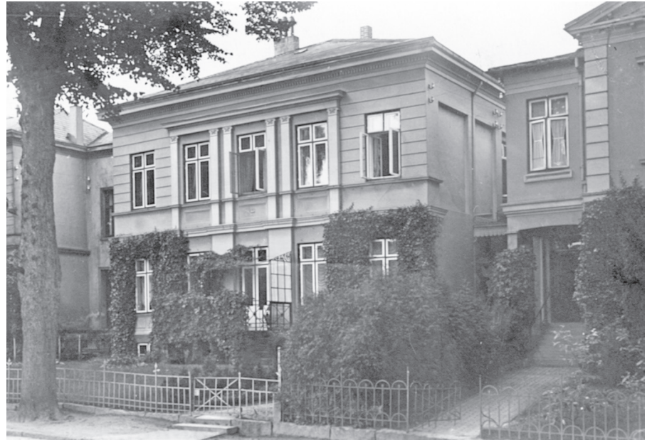
In den späten 1930er Jahren Umzug in die Plöner Straße 52

im Landesteil Lübeck beauftragt. Aus Akten des Kreisverbandes ist zu entnehmen, wie sich die Übernahme von ASB-Mitgliedern in die Sanitätskolonne Bad Schwartau vollzog. Zu einer Besprechung wurden die ASB-Mitglieder ... eingeladen. Von 20 erschienen aber nur 3, 17 lehnten damit eine Übernahme ins Rote Kreuz ab. ... Ob sich die Auflösung in Eutin in ähnlicher Weise abspielte, ist nicht festzustellen. Aber nach Aussagen alter ASB-Mitglieder vollzog sich der Übergang ohne Schwierigkeiten. Die ASB-Genossen traten geschlossen der Sanitätskolonne des Roten Kreuzes bei, ihr Dienst im ASB wurde ihnen angerechnet. Der reibungslose Übergang wurde sicher durch die frühere gute Zusammenarbeit sowie da-