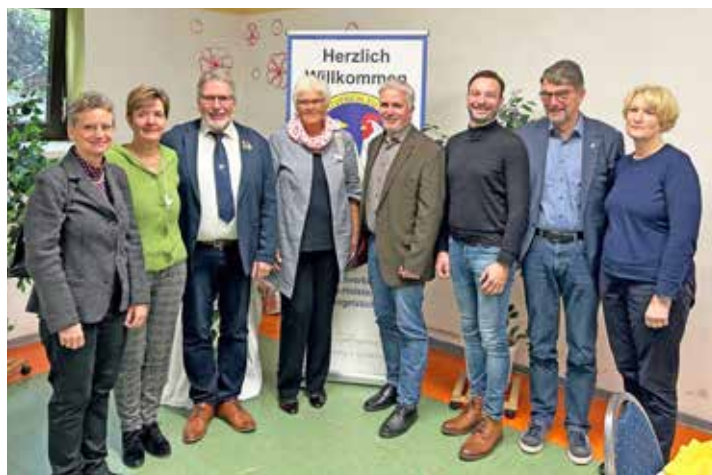
Gratulanten zum 150-jährigen Jubiläum

Im Rahmen der Geflügelchau wurde auch ein besonderes Jubiläum gefeiert. Der Geflügelzuchtverein Eutin besteht nunmehr seit 150 Jahren und ist