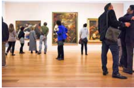
Europas spektakulärstes Kunstmuseum: das „Barberini“ im Herzen von Potsdam.

Anmeldungen zu dieser besonderen Zusatz-Kunst-Reise sind ab sofort bei den Reporter-Leser-Reisen des Burg-Verlages in Eutin, Lübecker Straße 12, Montag bis Freitag von 9 bis 13 Uhr unter Telefon 04521-701130 oder direkt online auf leserreisen.derreporter.info möglich.