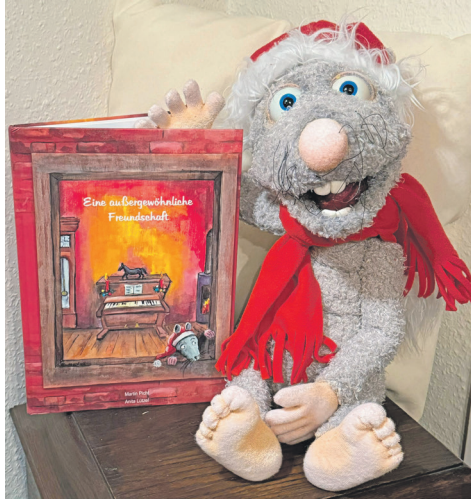
Ratte Rasmus ist von Kopf bis Fuß auf Weihnachten eingestellt und freut sich auf die Kinder.