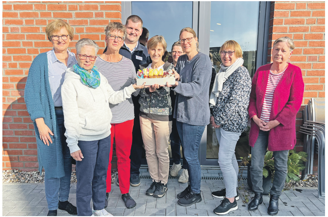
Die Spendenübergabe war der krönende Abschluss der mehr als gelungenen Kuchen- und Tortenchallenges.

Der gesamte Erlös der diesjährigen Kuchenchallenge wurde an zwei Organisationen gespendet, die Kindern und Jugendlichen in schweren Lebensphasen helfen: den „Kinder auf Schmetterlingsflügeln e.V.“ und „Die Muschel