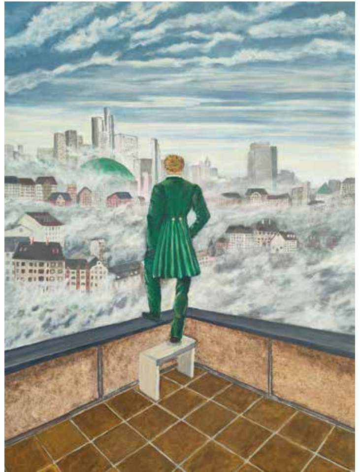
Die Vereinsmitglieder haben sich mit Caspar David Friedrich und seinem Werk beschäftigt.

ausgewählte Werke vorgestellt sowie die unterschiedlichen Darstellungsweisen innerhalb der Motivgruppen und die Bedeutung einzelner Werke eingehend beleuchtet. In der Ausstellung befinden sich Werke von Gerhard Richter, Ernst Barlach oder Eutiner Künstlern ebenso wie von niederländischen Malern des 17. Jahrhunderts, Johann Heinrich Wilhelm Tischbein oder von deutschen Expressionisten wie Erich Heckel und Karl Schmidt-Rottluff.