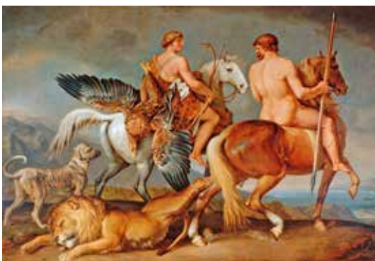
Das Tischbein-Bild „Die Stärke des Mannes/Verunftbild“ von 1821.

Eutin (t). Die Tischbein-Gesellschaft Eutin lädt am Donnerstag, 7. November, um 19 Uhr zu einem Vortrag ins Eutiner Ostholstein-Museum, Schlossplatz 1, ein. Dr. Sebastian Dohe aus Weimar spricht über das Thema „Der barocke Tischbein“.