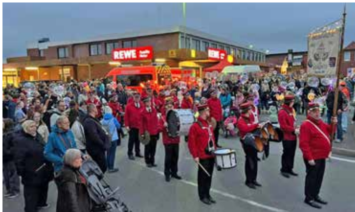
Der Laternenumzug in der Weidestraße hat auch 2024 wieder ein großes Echo gefunden.