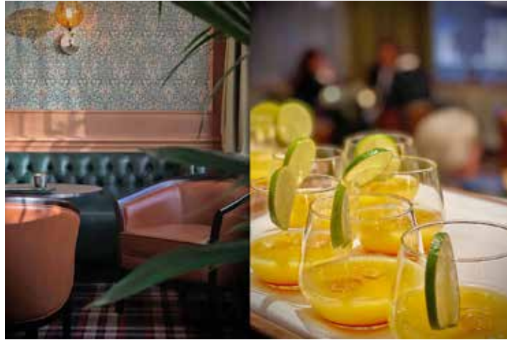
Die neue „Eichenbar“ im Hotel Dieksee besticht durch wunderschönes Ambiente.

„Mit der Gestaltung dieser Bar lebt ein gutes Stück Geschichte der erfolgreichen Tradition dieses Hauses wieder auf. Eine besondere Ehre am Eröffnungsabend war, dass wir das Ehepaar Braker mit Freunden hier begrüßen durften. Die beiden ehemaligen Hoteliers haben diesem Haus damals eine unvergleichliche Handschrift verliehen. Heute gehört das Hotel zur Ligula-Gruppe“, erzählt Hotelmanager Jesper Clausen und fährt fort: „In den vergangenen Monaten haben wir das Konzept unseres Restaurants ‚Louise‘ gänzlich überarbeitet, bieten eine Vielzahl an Veranstaltungsmöglichkeiten mit unvergleichlichem