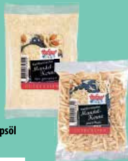
Hofgut Kalifornische Mandel-Kerne gestiftelt oder gemahlen 100-g-Beutel je (1 kg = 11,90 €)