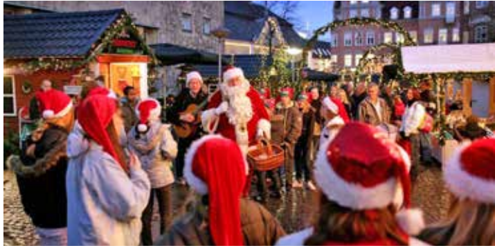
Schloss-Markt in Gavnö wartet am 10. November mit ganz viel dänischer „Hygge“ und dänischen Weihnachtstraditionen auf.

Skandinaviens. Die Gäste dürfen sich hier auf mehrere Hundert Stände und Buden im Schloss und den Nebengebäuden mit skandinavischen Weihnachtstraditionen freuen. Dort werden auch die köstlichen Advents-Aromen des Nordens mit Glühweinduft vom „Glögg“ und Pfefferkuchen sowie vielen skandinavischen Schlemmergenüssen mit kulina-