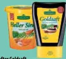
Original Grafschafter Goldsaft Zuckerrübensirup 500 g oder Heller Sirup 450 g Dosierflasche/Becher je (1 kg = 3,98/4,42 €)