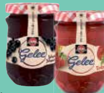
Schwartau Gelee Hausfrauenart verschiedene Sorten 200-g-Glas je (1 kg = 9,95 €)