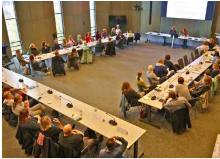
Beim Trägertreffen der Jugendhilfe wurde der Familienrat vorgestellt.

Eutin (t). Zweimal im Jahr lädt der Fachdienst Soziale Dienste der Jugendhilfe des Kreises Ostholstein die regionalen Träger der Jugend- und Eingliederungshilfe zum Vernetzen, Informationsaustausch und zu Fachdiskussionen ins Kreishaus nach Eutin ein. Beim letzten Treffen Anfang Oktober wurde der Familienrat Ostholstein vorgestellt. Dieser richtet sich an Familien im Kreisgebiet, die sich in einer bewegenden Situation befinden und hierfür Lösungen benötigen. Kostenfrei und unbürokratisch soll der Rat Familien befähigen, sich gemeinsam mit ihren Verwandten, Freunden und Bekannten zusammenzusetzen, um Ideen und Lösungswege für die Zukunft zu finden. Speziell geschulte Familienratskoordinatorinnen und -koordinatoren helfen den Familien bei der Vorbereitung, Organisation und Durchführung des Familienrats, ohne ihnen eine fertige Lösung vorzulegen.