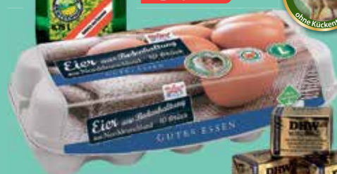
Hofgut Eier aus Bodenhaltung Gewichtsklasse L 10er-Packung oder