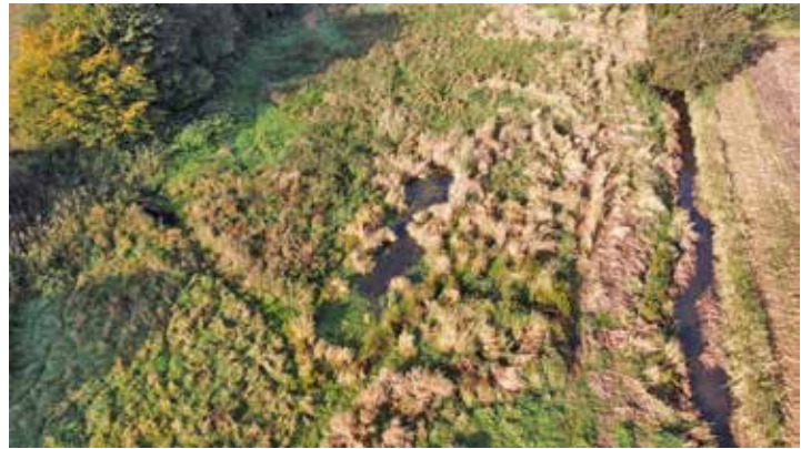
Das aktuelle Luftbild belegt eindrucksvoll, wie durch das Öffnen der Rohrleitung eine Wiedervernässung des Areals erfolgt ist. Der Gewässerverlauf ist bereits verschwenkt, Erlengruppen sind erkennbar.