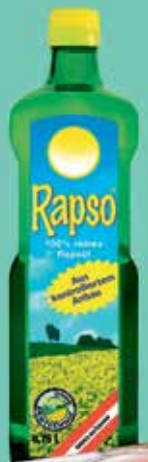
Rapso 100 % reines Rapsöl 750-ml-Flasche (1 Liter = 5,05 €)