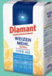
Diamant Weizen Mehl Extra Type 405 1-kg-Packung