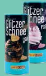
Decocino Glitzer Schnee gold oder rosa 100-g-Dose je (1 kg = 37,90 €)