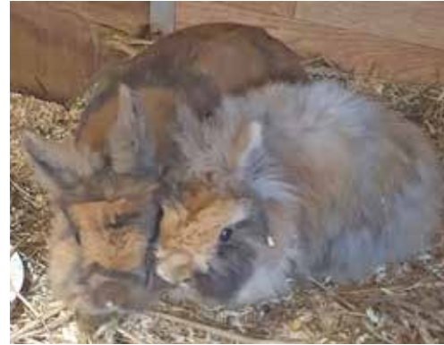
Die Kaninchenschwestern Keks und Cookie sind unzertrennlich.

Fiete ist circa 2019 geboren und rot getigert mit weißen Stellen, die schwarz-weiße Lucy ist etwa drei Jahre alt. Davon, dass die zwei auf dem Foto wie erfahrene Models wirken, sollte man sich nicht täuschen lassen. Es liegt wohl eher daran, dass das Futter in reichbarer Nähe ist und die Blicke bedeuten: Wann gibt's denn nun endlich was zu Fressen? Auch die beiden Kaninchendamen Keks und Cookie möchten unbedingt zusammenbleiben, denn als Schwestern haben sie schließlich schon ihr ganzes Leben gemeinsam verbracht. Obwohl das noch gar nicht so lange ist, denn sie wurden erst circa 2023 geboren, sind also noch junge Hüpfen. Es ist anzunehmen, dass die beiden Zwergkaninchen ein Mix aus Löwchen und Angora sind. Während bei Keks das Angorakaninchen stärke-