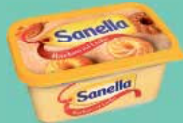
Sanella 400-g-Becher (1 kg = 3,23 €)