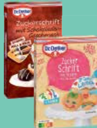
Dr. Oetker Zuckerschmift verschiedene Sorten 100/75-g-Packung je (1 kg = 19,90/26,53 €)