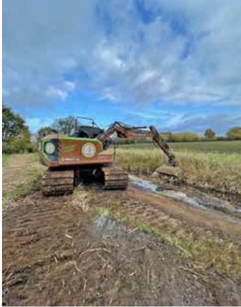
Dieses Bild aus der Bauphase 2023 zeigt die abgeflachte Böschung und das Einbringen von Kies und Störsteinen.

Gothendorf (t). Der Wasser- und Bodenverband (WBV) Schwartau bewertet die von ihm 2023 durchgeführten strukturverbessernden Maßnahmen auf einer Länge von 600 Metern an der Schwartau oberhalb des Barkauer Sees durchweg positiv. Im Bereich Gothendorf zeigen sie bereits erste Wirkung.