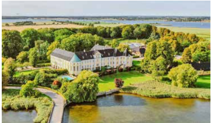
Eines der schönsten privaten Wasserschlösser Skandinaviens erwartet die Reisegäste zum großen Weihnachtsmarkt.

dinavien-Weihnachtsmarkt der Baronin auf dem märchenhaften Wasserschloss Gavnö auf der Insel Seeland. Das traumhafte Rokoko-Wasserschloss bei Naestved liegt auf einer eigenen Schloss-Insel und gilt als eines der schönsten privaten Schlösser