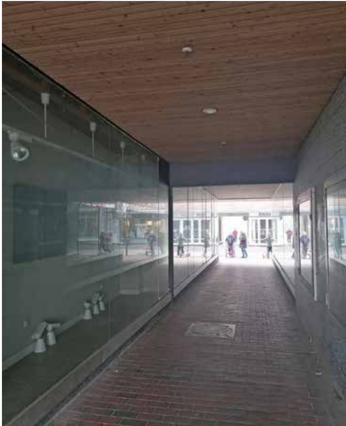
Auch für das LMK-Gebäude und den dazugehörigen Durchgang sind zum Advent Verschönerungsmaßnahmen vorgesehen.