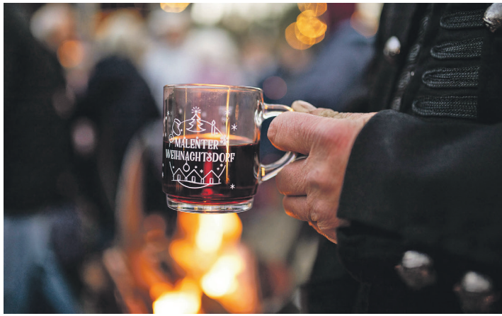
Es wird wieder gemütlich im Malenter Kurpark.

Das Weihnachtsdorf wird am Freitag, 29. November, um 17 Uhr mit stimmungsvoller Live-Musik von Markus Baltensperger eröffnet. Auf dem Konzertplatz vor der festlich beleuchteten Liegehalle verbreitet der Duft von Glühwein, Waffeln und anderen Köstlichkeiten weihnachtliche Atmosphäre. Am Sonnabend und Sonntag öffnet das Weih-