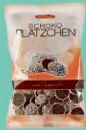
Schluckwelder Schokoladen- Plätzchen 150-g-Beutel (1 kg = 7,40 €)