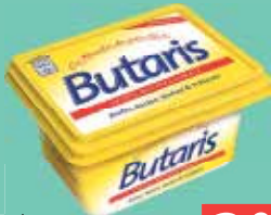
Butaris 250-g-Becher (1 kg = 11,69 €)