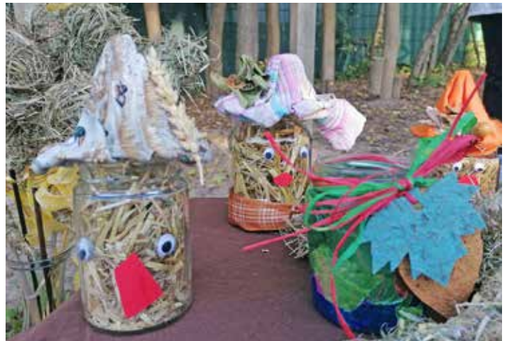
Kreative Deko-Ideen gab es zuhauf auf dem Herbstmarkt.