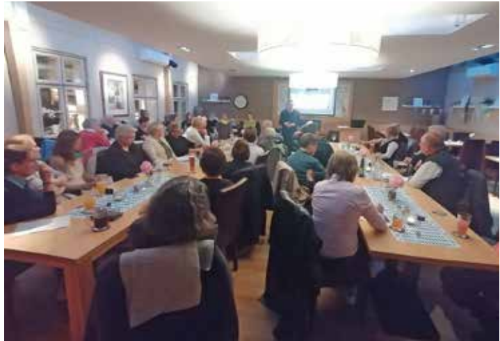
Die Gelegenheit zum Austausch soll es künftig zweimal jährlich geben.