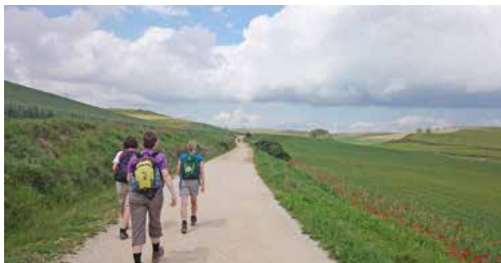
Für Mai 2025 plant die Kirchengemeinde eine Pilgerreise.