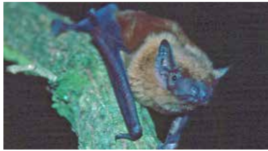
Der Große Abendsegler ist eine Fledermausart, die in Wäldern mit altem Baumbestand zu finden ist.

Schönwalde (t). Am Freitag, 1. November, findet um 18 Uhr ein Fotovortrag des bekannten Fledermaus-Experten Florian Gloza-Rausch im Schönwalder Gemeindehaus, Jahnweg 2, statt. Fledermäuse gehören zu den erfolgreichsten Säugetieren der Erde: Ihre heimliche, nächtliche Lebensweise hat die Menschen aller Zeiten in ihren Bann gezogen. Sie haben eine Ultraschallorientierung entwickelt, die sie vom Tageslicht unabhängig