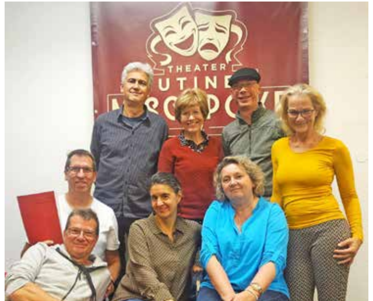
Die Eutiner Mischpoke probt für ein launiges Boulevardstück mit Biss.

An Silvester wird es Vorstellungen um 16 Uhr und um 20 Uhr