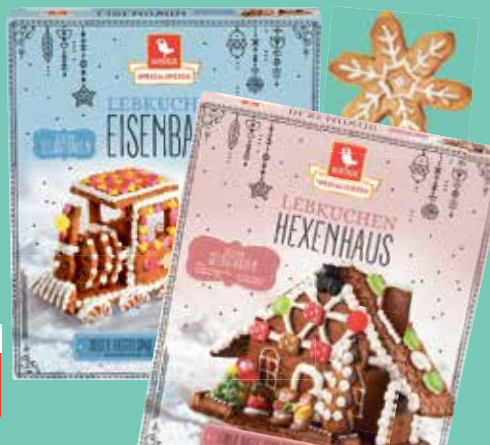
Weiss Lebkuchen Hexenhaus 900 g oder Eisenbahn 1035 g Packung je (1 kg = 9,87/8,58 €) nur solange der Vorrat reicht