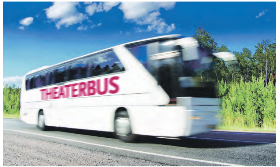
Bequem und entspannt kommt man mit dem „inkultur“-Theaterbus zu den Aufführungen nach Hamburg.

sierte direkt bei „inkultur“. Das kulturbegeisterte und freundliche Serviceteam beantwortet Fragen gerne unter Telefon 040-22700666 oder per E-Mail an theaterbus@inkultur.de. Auf Wunsch schickt „inkultur“ auch Informationsmaterial zu. Weitere Auskünfte sind online auf www.inkultur.de/eutin zu finden.