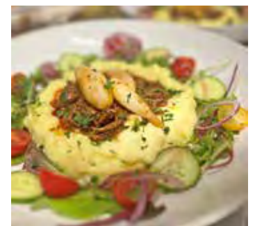
Ein Herbstleckerbissen: Stifado