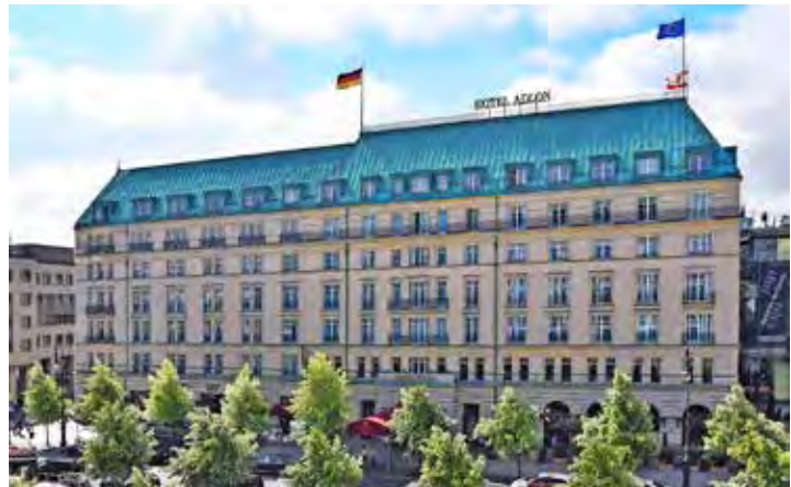
Das „berühmteste Hotel der Welt“ am Pariser Platz in Berlin können die Leser im November zum Weihnachts-Shopping ausgiebig genießen.

am Pariser Platz mit luxuriösen Hotel-Zimmern sowie dem legendären Adlon-Gourmet-Schlemmer-Frühstücksbuffet und der Möglichkeit zur Nutzung der großen Wellness-Abteilung mit Hallenbad, Sauna und Fitnessraum. Als kulturellen Höhepunkt der dreitägigen Sonder-Reise zum Termin vom 17. bis 19. November 2024 zum sehr günstigen Komplettpreis von nur 475 Euro genießen unsere Leser inklusive Eintritt ohne Warteschlangen und inklusive Hin- und Rück-Transfer das weltberühmte Barberini-Museum in Potsdam mit der gerade neu eröffneten, sensationellen Sonder-Ausstellung „Maurice de Vlaminck“ mit Leihgaben aus Museen in aller Welt und die große Impressionisten-Ausstellung von Hasso Platner. Am Abend lockt die Weltpremiere der neuen Groß-Revue „Falling in Love“ im berühmten Friedrichstadtpalast Berlin. Eintrittskarten inklusive