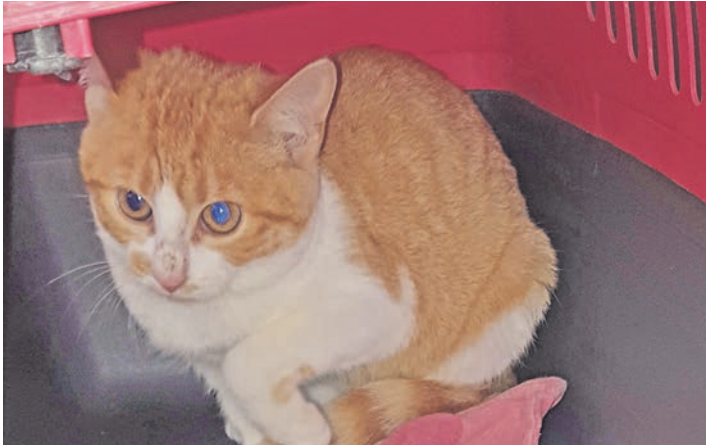
Kiara ist noch scheu, aber durchaus neugierig.

kaum aus ihrer Box heraustraut. Ein schönes Zuhause bei netten Menschen würde sicherlich helfen, ihre Zurückhaltung zu überwinden. Man sieht ja, eine gewisse Neugierde ist vorhanden.