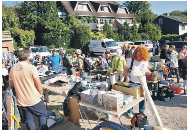
Auf dem Parkplatz Wittenburg und im Gasthaus selbst waren viele Stände aufgebaut.

heraus nach den besten Fundstücken Ausschau zu halten. Nicht selten wurde dabei schnell am Straßenrand gehalten, um einen Stand genauer zu begutachten oder auf den letzten freien Platz zu parken. Hier zeigte sich jedoch, dass die Parkplatzsituation für die nächsten Veranstaltungen sicherlich verbessert werden könnte, um dem Andrang noch besser gerecht zu werden. Trotz kleiner Herausforderungen war die Stimmung hervorragend. Zahlreiche Schätze wechselten die Besitzer, und das gute Spätsommerwetter trug dazu bei, dass die Flohmarktbesucher bei