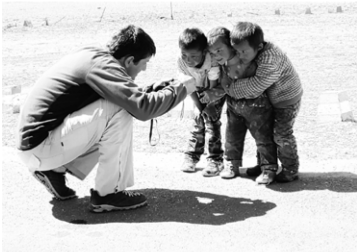
Mit seinen Aufnahmen erreicht Winfried Koenler eine besondere Tiefe.

Die Ausstellung ist montags bis freitags vom 30. September bis zum 25. Oktober zwischen 9 und 13 Uhr geöffnet.