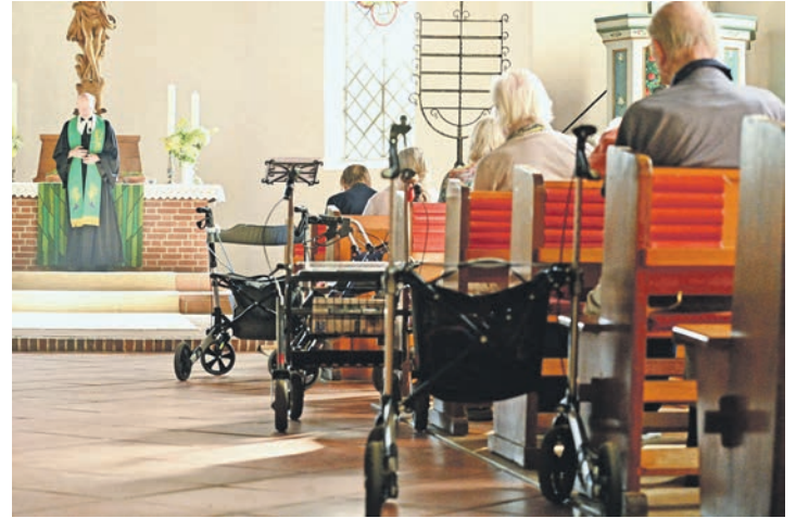
Einmal im Monat gibt es in Gleschendorf einen Gottesdienst für ältere und demenziell erkrankte Menschen.

Für die Lesung hat der Pastor die Bibelstelle ausgewählt, die von den Schwertern erzählt, die zu Pflugscharen umgeschmiedet werden. In seiner kurzen, einfach gehaltenen Predigt nennt er dies „eine tröstliche Verheißung, tröstlich angesichts von Krieg und Gewalt“, und er zählt die Kriege