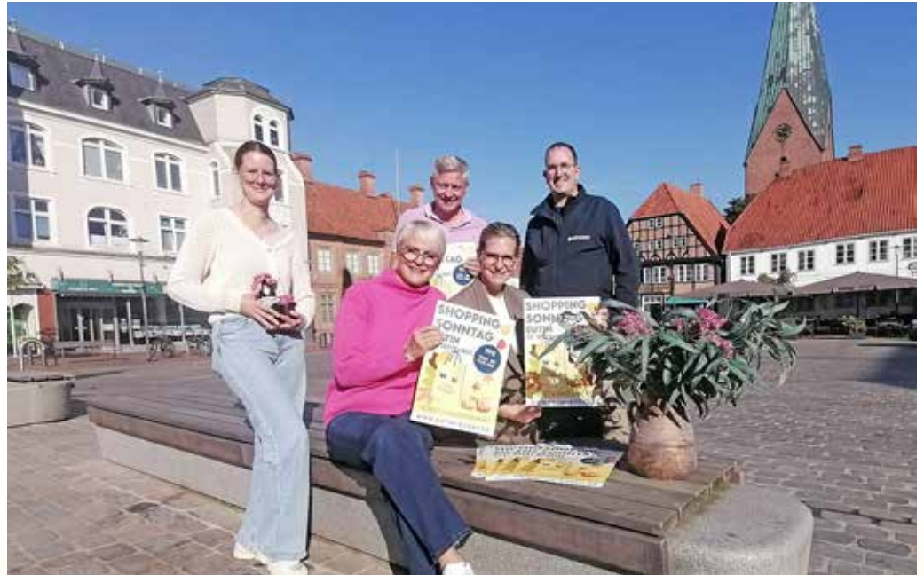
Das Organisations-Team der WVE hat einen tollen Sonntag geplant.

WVE bietet buntes Programm Ab 11 Uhr kann man sich auf dem Markt in beste Herbstlaune versetzen lassen. 25 Stände locken mit einer großen Auswahl an kreativen Deko-Ideen, Trockenblumen liegen übrigens nach wie vor im Trend. Frisch und saftig sind Obst und Gemüse am Epona-Stand. Die Eutiner Firma liefert auch den Spitzkohl für einen deftigen Eintopf aus