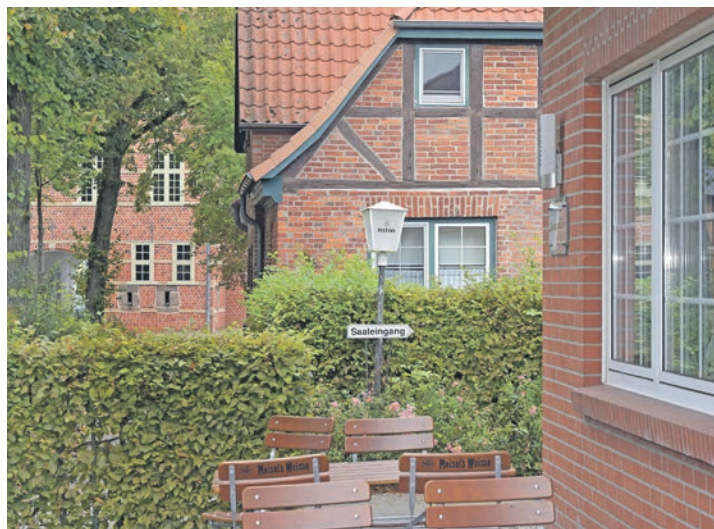
Eine tolle Zeit zum Wandern und Radwandern: Noch locken die warmen Herbsttage auf die sonnige Terrasse der Turmschänke in Sichtweite des historischen Torhauses von Gut Seedorf.

oder Sauerfleisch im Programm. Daneben gibt es eine Empfehlungskarte, die alle zwei Wochen gegen eine neue ausgewechselt wird und jahreszeitlich beeinflusst ist. Gäste dürfen sich zum Beispiel auf typische Herbstgerichte wie Rübenmus, Kohlroutaden, hausgemachte Pasta mit Kürbis und natürlich Grünkohl freuen. Aber auch Burger, Labskaus und Steaks seien mitunter auf der Empfehlungskarte zu finden, erzählt Florian Ritzki. Und stets werde das Angebot durch vegan beziehungsweise vegeta-