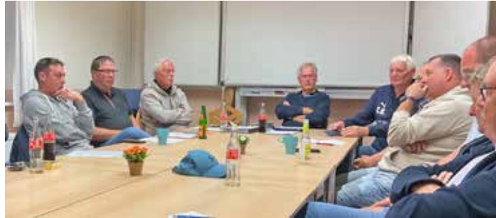
Die Enttäuschung stand dem Waldeck e.V.-Vorstand auch bei der außerordentlichen Mitgliederversammlung noch ins Gesicht geschrieben.