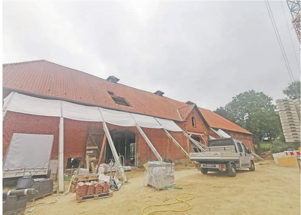
Die Hülle der Scheune auf dem Feddersen-Hof wird noch von Trägern gehalten, im Inneren ist der Rohbau der neuen Wohnungen und Gewerbeflächen fast vollendet.

meister hat kein Einvernehmen erteilt“, verdeutlichte Susanne Stange, Fachdienstleiterin für Stadt- und Gemeindeplanung. Sie stellte einen Rückbau in Aussicht, eine niedrigere begrünte Mauer soll die hoch aufragende Betonwand ersetzen. Auch damit so etwas nicht noch einmal passiert, läuft aktuell eine städtebauliche Studie. In einer Bestandsaufnahme durch „Mensch und Drohne“ sollen Potentiale und Probleme erfasst werden. Damit schafft sich die Verwaltung eine Grundlage, um Fissau „dorfgerecht weiterzuentwickeln“, wie Stange formulierte.