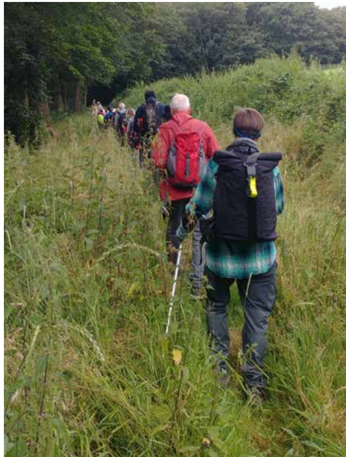
Pilger auf dem Weg zum Redingsdorfer See .

Für das „Pilgern durch die Jahreszeiten“ mit Pastor Sönke Stein und dem erfahrenen Pilgerführer Horst Bade, muss man etwas früher aufstehen und es braucht mehr Ausdauer und Zeit, denn dieser Pilgerweg ist 14 Kilometer lang. Horst Bade