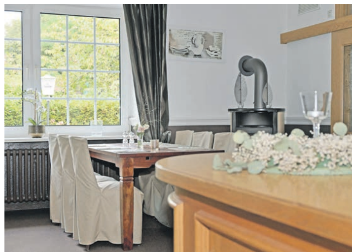
Einladend, gepflegt und gemütlich: die Räume der Turmschänke Seedorf.

Für ein letztes Arztgespräch und die Ausgabe der Befunde für den weiterbehandelnden Arzt kann mit vorheriger Terminabsprache im Oktober die Sprechstunde besucht werden.