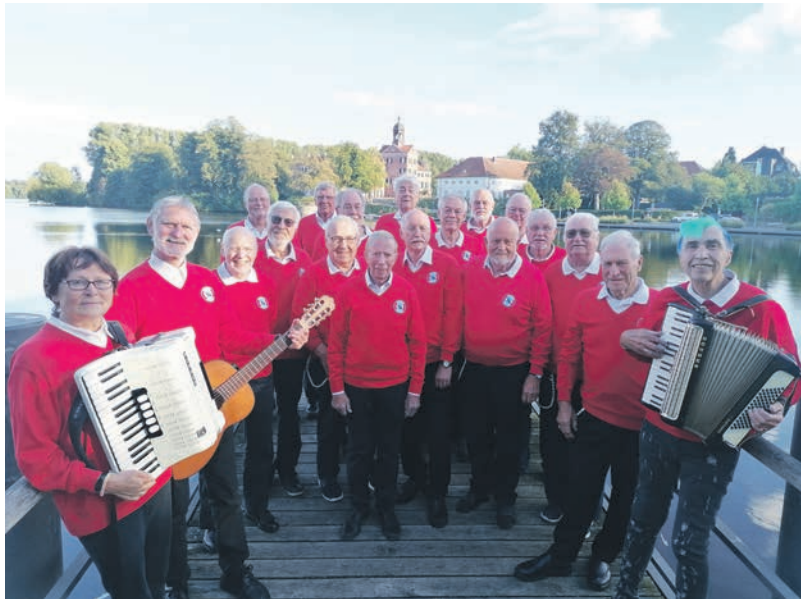
„Eutiner Wind“ sorgt für Seemanns-Flair.

auch die grauen Herbsttage schönzufärben. Und wer sich mehr als einen Farbtupfer für die Bildergalerie sichern will, fotografiert wie alle Jahre den reich bestückten Erntewagen der Tafel Eutin. Die Musik zum