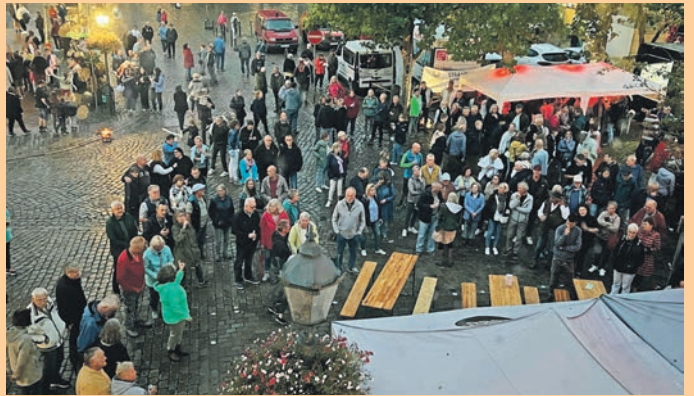
Anziehungspunkt Marktplatz: beim Herbstzauber präsentiert sich die Lütjenburger Geschäftswelt mit buntem Kulturprogramm.