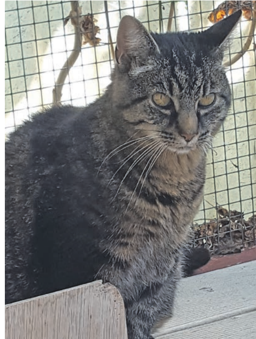
Willow ist auf der Suche nach einem schönen Zuhause.

fahrt aus Richtung Eutin gesperrt, bitte Umleitung nutzen. Die Teilnahme ist kostenlos, Spenden für den Naturerlebnisraum sind erwünscht. Bei Dauerregen und Sturm fällt die Veranstaltung aus.