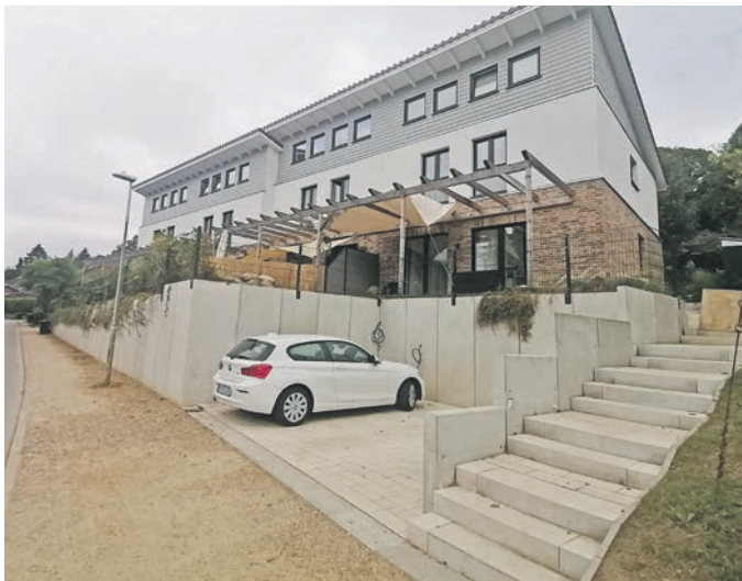
Die Mauer muss weg, wäre zu viel gesagt, aber deutlich schrumpfen soll sie, wenn es nach Bauamt und Dorfschaft geht – nicht genehmigt stört sie den dörflichen Charakter. So etwas soll künftig verhindert werden.

Noch einmal zurück zum Feddersen-Hof: Welche Informationen es zur Montessori-Kita gibt, lesen Sie am nächsten Mittwoch in Ihrem reporter.