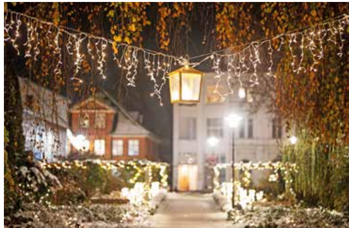
Eine Überspannung mit Laterne.

In den Vorjahren waren für die weihnachtlichen Überspannungen die Eutiner Gewerbetreibenden verantwortlich und dies soll auch zukünftig so bleiben. Da die Teilnahme 2023 jedoch zu gering ausfiel und die Kosten weiter gestiegen sind, wird 2024