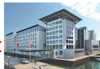
First-Class-Hotel am Hafen