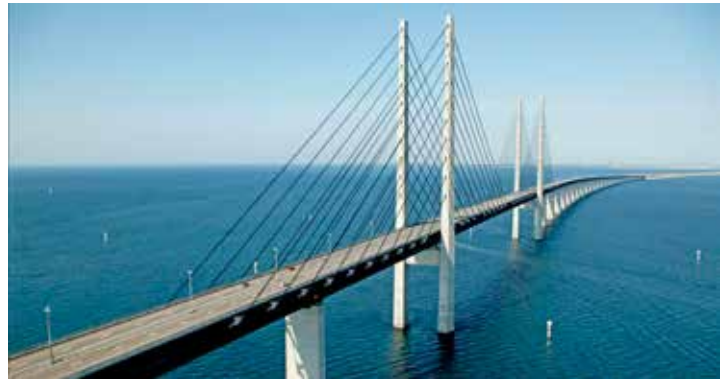
Hautnah genießen unsere Leser*innen die gigantische Öresund-Brücke zwischen Kopenhagen und Malmö.

klassigen Fernreisebus ab Eutin alle genannten Leistungen. Anmeldungen sind ab sofort möglich bei den Reporter-Leser-Reisen des Burg-Verlages in Eutin unter Telefon 04521-701130, Montag bis Freitag von 9 bis 13 Uhr, oder direkt online im Internet unter „leserreisen.derreporter.info“.