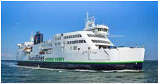
Kurs Nord mit den modernen Großfähren der Scandlines auf der Vogelfluglinie.

Eutin (t). Attraktive Höhepunkte Skandinaviens im Herbst-Kleid entdecken unsere Leser*innen bei der großen Drei-Brücken-Fahrt nach Dänemark und Schweden mit unserem großen Entdecker-Programm mit fachkundiger Reiseleitung mit unserer erlebnisreichen Skandinavien-Tagesfahrt zum Superpreis. Zunächst erfolgt die Anreise ab Eutin über die Feh-