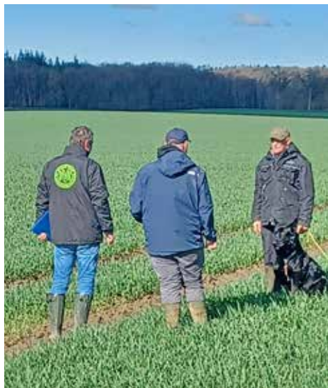
Der PGHV OH ist erneut Ausrichter der Landesmeisterschaft der Fährtenhunde.

Stendorf (t). Am Wochenende 28. und 29. September findet die Landesmeisterschaft der Fährtenhunde statt. Der Polizei- und Gebrauchshundeverein Ostholstein (PGHV OH) ist erneut Ausrichter dieser Veranstaltung. Der oder die Sieger/Siegerin wird an der Bundessiegerprüfung teilnehmen. Das ursprünglich geplante Fährtenengelände in Zarnekau steht leider nicht zur Verfügung. Es wurde kurzfristig umgeplant. Hier gehört den Landwirten ein besonderes Dankeschön dafür, dass in Stendorf die Fährten abgesucht werden können. Die Teilnehmenden treffen sich ab 8 Uhr im Vereinsheim des PGHV OH An der Schäfererei 27 in Eutin. Um 10 Uhr beginnt das Absuchen der Fährten. Das Ver-