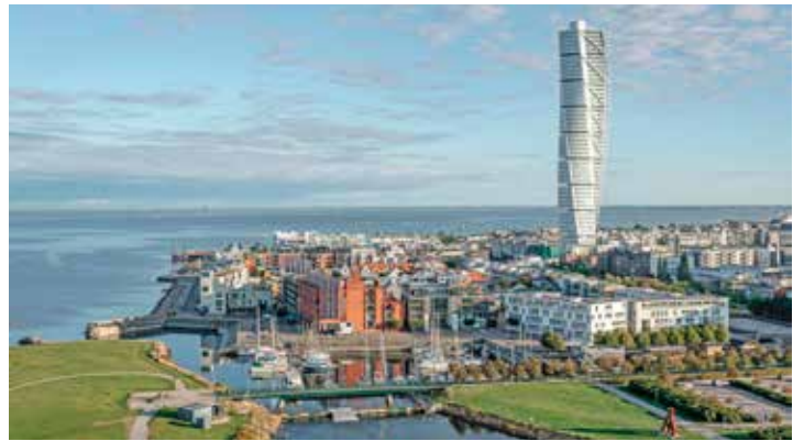
Die südschwedische Hafen-Metropole Malmö am Öresund entdecken unsere Gäste bei der großen Stadtrundfahrt.