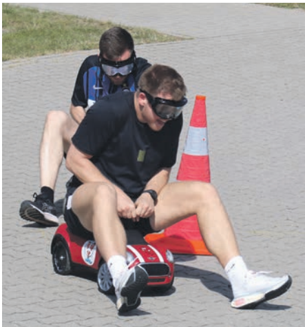
Bobbycar fahren mit einer Rauschbrille dient zur Simulation der Fahruntüchtigkeit unter Alkoholeinfluss.