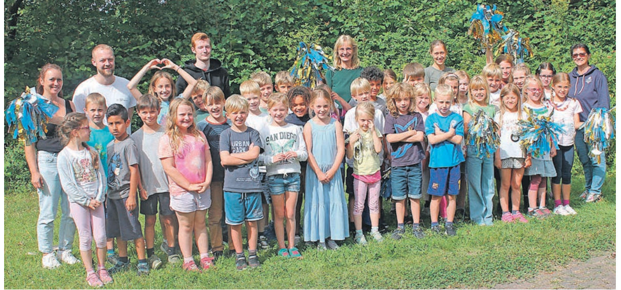
Die drei Wochen Ferienbetreuung haben allen großen Spaß gemacht. Nun läuft wieder der Schulalltag...

Alljährlich finden die Ferienbetreuungen der Offenen Ganztagschulen in Kooperation mit dem Kinderschutzbund, Kreisverband Ostholstein e.V., statt. Spannende Themen wurden von den Kindern bearbeitet. Unter dem Motto Alltagshelden gab es einen spannenden Besuch bei der Malenter Feuerwehr. Mit einer gemeinsamen Müllsammelaktion machten sich die Mädchen und Jungs selbst zu nachahmungswürdigen Helden. Und auch ein Besuch im Malenter Klärwerk zeigte den Kids, dass die Mitarbeiterinnen und Mitarbeiter dort sehr wichtige Arbeit für die Allgemeinheit leisten. Denn ohne sie hätten wir alle kein trinkbares Leitungswasser. Helden spielten auch in den