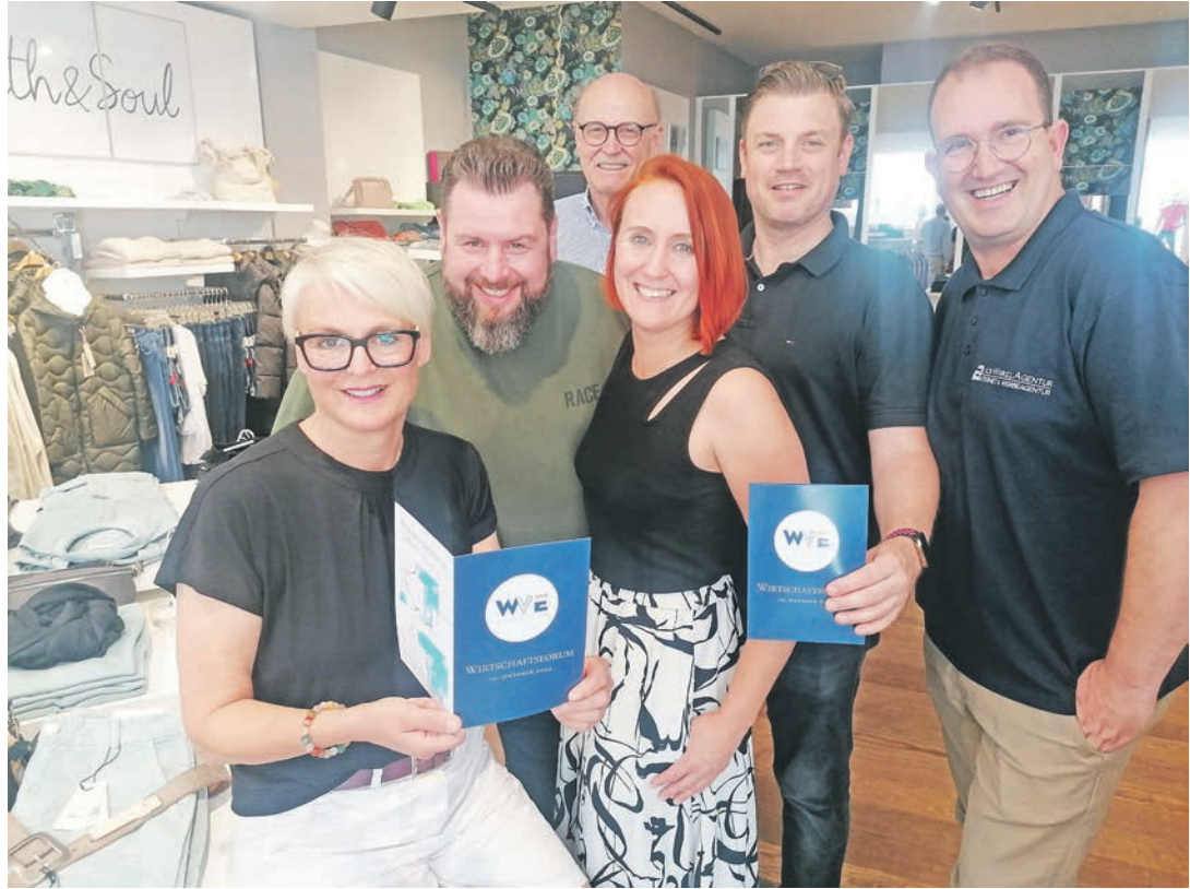
Das 2. Wirtschaftsforum will konkrete Tools zur Fachkräftegewinnung liefern, dafür hat das Orga-Team die entsprechende Vorarbeit geleistet.