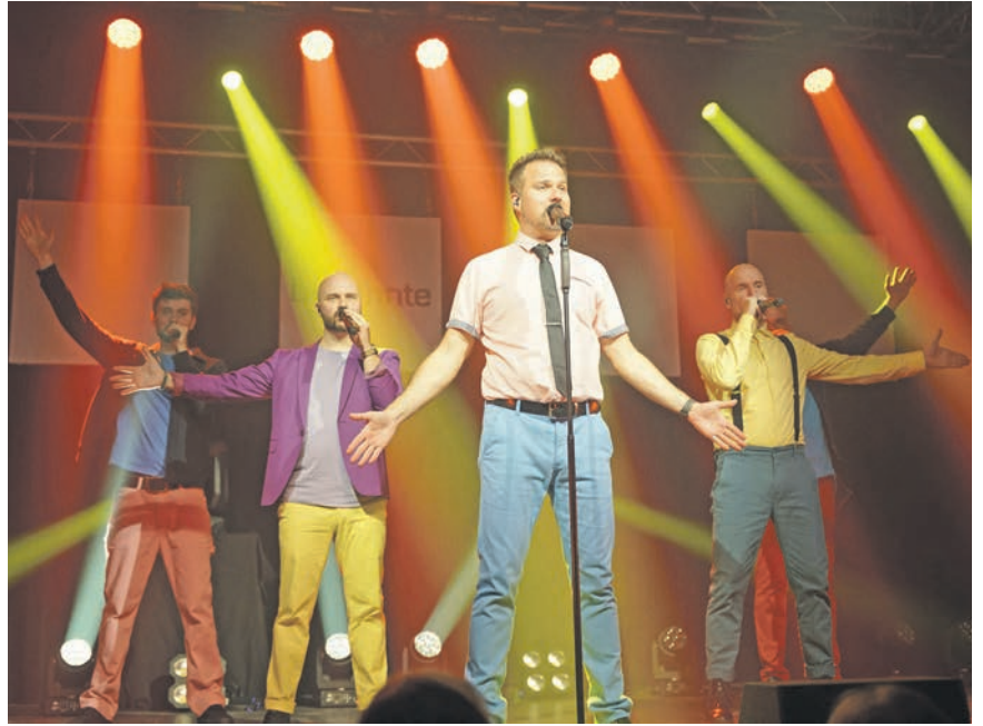
Gute-Laune-Garantie: „Alte Bekannte“ sind Nachfolgeband der legendären „Wise Guys“.

Auch für das Konzert A-Cappella-Formation „Alte Bekannte“ am Sonntag, 1. September, um 18 Uhr sind noch