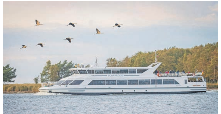
Ein einmaliges Natur-Spektakel erleben unsere Leser bei der großen Schiffs-Sonderfahrt auf der großen Müritz-Seenplatte.

Bei der großen Bus- und Schiffs-Sonderfahrt am 23. September direkt ab Eutin ohne weitere Einschammeltour nehmen die Reporter-Leser Kurs auf den großen Müritz-See und können mit Einbruch der Dämmerung eine dreistündige Sonder-Schiffahrt auf der Müritz mit fachkundigem Kranich-Ranger an Bord und hochinteressanten Erklärungen haut-