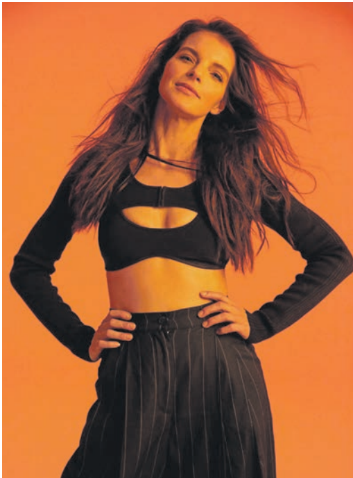
Hat mit dem Song „Move“ einen aktuellen Hit im Gepäck: Yvonne Catterfeld.