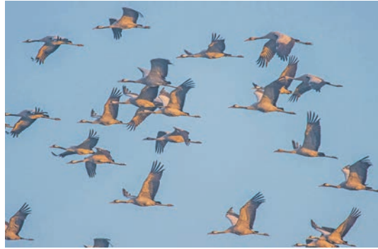
Millionen von Kranichen sammeln sich im Herbst zum „Indian Summer“ im Nationalpark der Müritz-Region.

nah miterleben und genießen. Perfekt komplettiert wird die Reporter-Leser-Reise zum Sonderpreis von 79,90 Euro durch ein leckeres Abendessen an Bord während der Schiffahrt. Die Rückkehr in Eutin ist gegen 22.30 Uhr geplant.