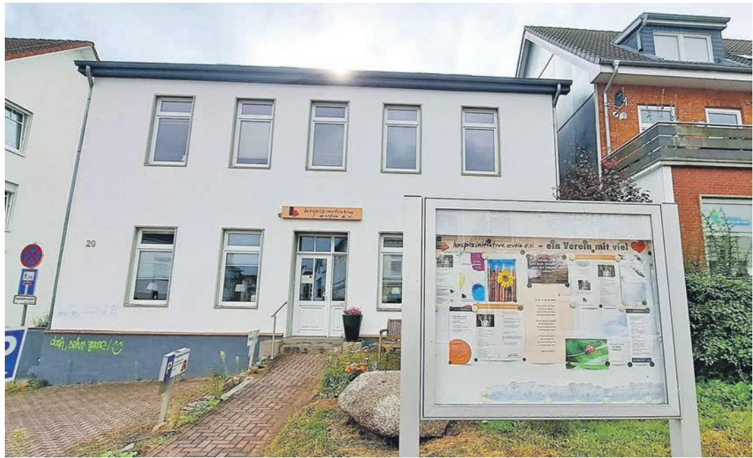
Im Gebäude in der Albert-Mahlstedt-Straße 2 in Eutin treffen sich die Teilnehmer des Frühstück.

Der Sonntag ist bewusst gewählt: Während unter der Woche die Anforderungen des Alltags oft auch Ablenkung bieten, können sonntags Leere und neue Einsamkeit über die Trauernden hereinbrechen. Von 10 bis 12 Uhr können sich interessierte Frauen und Männer in den