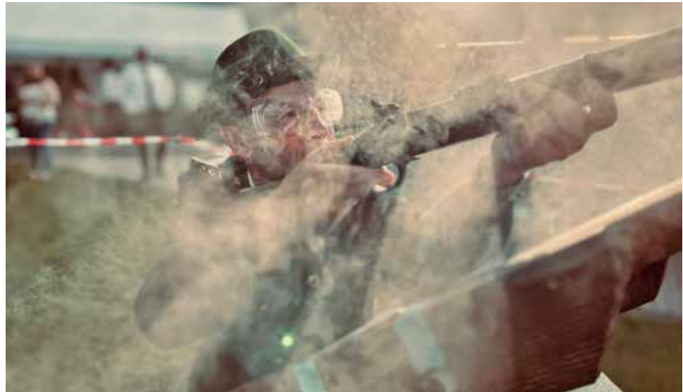
Hochspannung herrscht beim Schießen.

Parallel am Nachmittag beginnt das Kinderfest für rund 80 angemeldete Kinder. In vier Altersgruppen können neun- bis 15-jährige