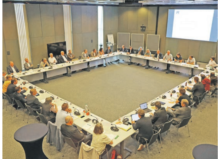
Die Teilnehmerinnen und Teilnehmer der Wohnraumkonferenz wohnen regelmäßig zusammenkommen.

Mit Teilnehmerinnen und Teilnehmern aus den Kommunalverwaltungen, Landespolitik, Selbstverwaltung, Kredit-, Bau- und Landwirtschaft sowie Verbänden wurde die Zukunft am Wohnungsmarkt erörtert und eine Verstärkung der Gespräche vereinbart.