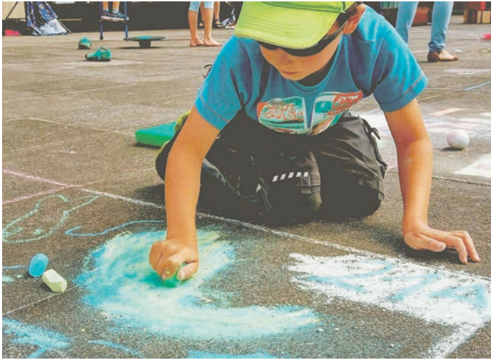
Am Sonnabend wird es bunt auf dem Schwentineplatz - wer malt die schönsten Bilder?

Die Auswertung erfolgt nach Alterseinteilung. Die Teilnehmer starten in den Kategorien Einzelkünstler bis 5, 6 bis 9 und 10 bis 14 Jahre. Außerdem können sich