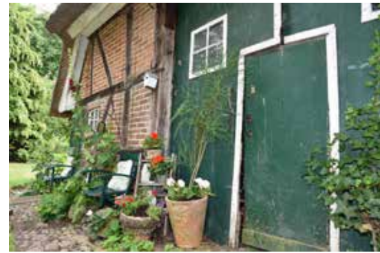
Die Türen zur Diele werden geöffnet – hier und im Katengarten verspricht die Cafeteria köstliche Torten und gemütliches Beisammensein.

dafür den ganzen Tag Zeit.“ Aber reine Warenspenden können bereits ab sofort abgegeben werden, ergänzt Gerti Schell-