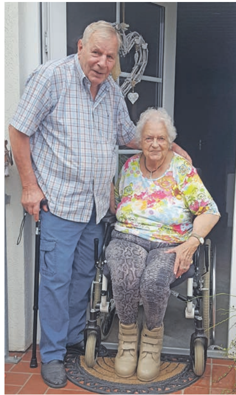
65 Jahre später feiert das Jubelpaar die Eiserne Hochzeit.