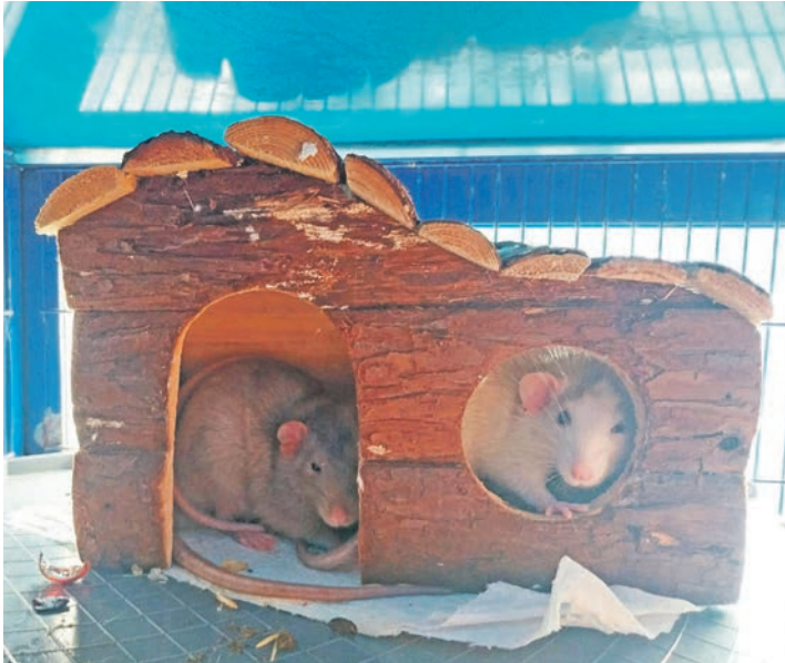
Rattenfreude im Dreierpack: Wer bietet ihnen ein schönes Heim?

ziemlich schüchtern und brauchen noch etwas Gewöhnung an menschliche Gesellschaft. Aber wer drei kleine Freunde braucht, die ihn aufmuntern und Leben in den Alltag bringen, der ist bei diesem Trio genau richtig. Im Tierheim haben außerdem noch sechs weibliche Ratten Unter-