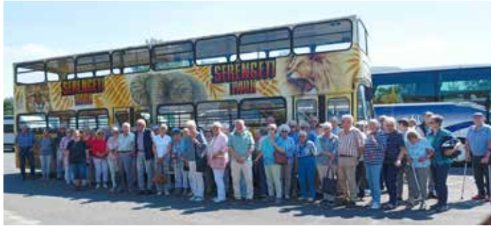
Mit der Fahrt in den Safari-Park haben die Eutiner SoVDler eine schöne Erinnerung mehr.

Eutin (t). Am 6. August unternahm der Eutiner Ortsverband des Sozialverbandes Deutschland mit 57 Mitgliedern eine Tagesfahrt in den Serengeti Park nach Hodenhagen. Nach einem gemeinsamen Mittagessen in der Waldgaststätte „Eckernworth“ in Walsrode ging es mit dem Safari-Bus und einem Ranger zu einer Tour durch den Park. Die Gruppe „durchfuhr“ viele Kontinente