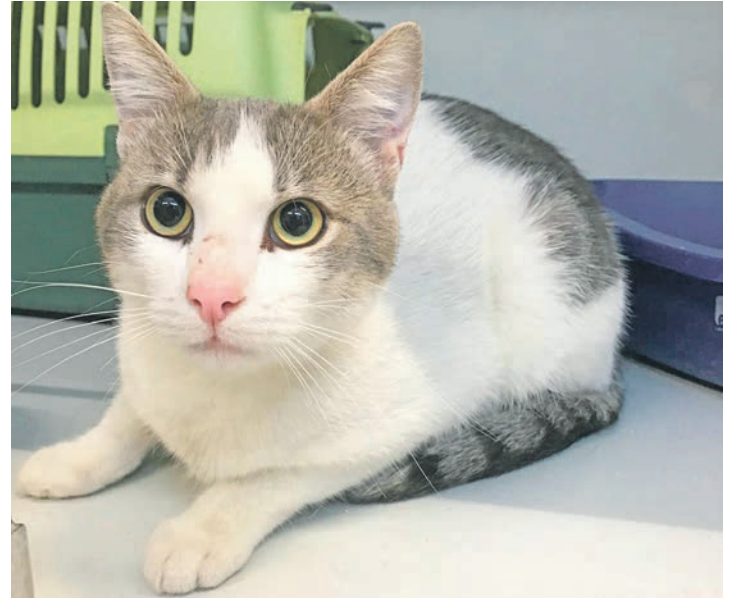
Kater gefunden! Wer kennt ihn?

an seiner Seite. Außerdem würde sich Harumi über ein Außenhege freuen. Harumi ist ein heller Japaner und genießt gerne die frische Luft. Er ist ein sehr nettes und wenig zurückhaltend Tier. Vielleicht können Sie dem freundlichen Langohr einen Start in ein neues Leben ermöglichen. Am Montagabend kam außer-