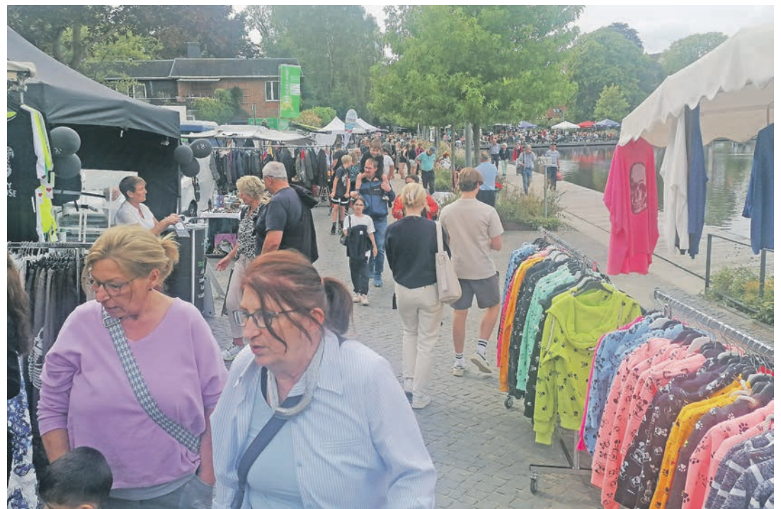
Munteres Treiben herrschte am Sonntag in der Stadtbucht.

transport mit Auto und Anhänger: „Zum Glück!“, meint Schönke. Auch deshalb nimmt er beide Tage mit. Mittlerweile schlendern deutlich mehr Menschen durch den Rosengarten, der gutbesuchte Gottesdienst auf dem Markt ist beendet, das Sonntagsfrühstück auch. Es geht gemächlicher als am Sonnabend, aber reichlich Betrieb wird auch an diesem Tag herrschen. Die Partys am Freitag- und Sonnabendabend waren bestens besucht, Hochstimmung bis nach Mitternacht, auch wenn es am Freitag später losging als angekündigt. Ein bisschen erschöpft und durchaus zufrieden wirkt Eutin nach diesem Wochenende – wie das so ist nach einem Fest für alle Generationen.