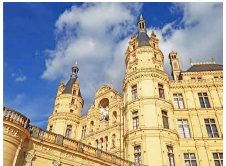
Die Gruppe 60+ besichtigt das Schloss Schwerin.

Eutin (t). Die Gruppe 60+ der Evangelisch-Lutherische Kirchengemeinde Eutin fährt am Donnerstag, 29. August, um 9.30 Uhr mit dem Zug nach Schwerin. Treffen ist um 9.20 Uhr am Bahnhof Eutin, Gleis 2. Das Schloss wird im Rahmen einer privaten Führung besichtigt und anschließend ist eine Einkehr im Schlosscafé geplant (Essen nach freier Wahl, nicht im Preis inbegriffen). Wer sich den Schlossgarten oder die Kirchen ansehen will oder in der Stadt bummeln will, hat bis 17.30 Uhr Zeit. Dann trifft sich die Gruppe am Bahnhof Schwerin, Gleis 2, und fahren zurück nach Eutin. Um 19.28 Uhr ist man wieder am Bahnhof Eutin. „Wir würden neue Teilnehmer sehr begrüßen“, betont Organisatorin Inge Buck. Die Kosten richten sich nach der Zahl der Teilnehmenden und betragen etwa 21 Euro. Um Anmeldung bis zum 27. August wird gebeten bei Inge