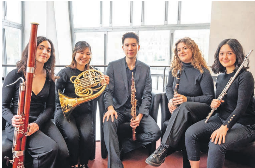
Ein Ensemble in Bestform: Quantum Quintett bereiten sich auf den ARD-Wettbewerb vor. Vorher spielen sie in Bosau.