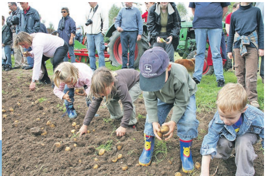
Beim Kartoffelbuddeln bleibt kein Wunsch offen – und keine Hand sauber. Versprochen!

Mit fortschreitender Mechanisierung kamen in