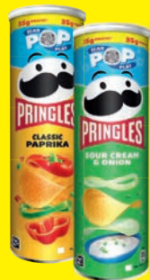
Pringles verschiedene Sorten 165 g + 35 g gratis 200 g (1 kg = 8,33 €)