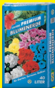
Blumenerde 40 Liter (1 Liter = 0,07 €)