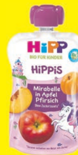
Bio Hipp HIPPIS Quetschbeutel verschiedene Sorten 100 g (1 kg = 10,00 €)