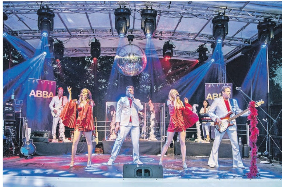
Sie gilt als einer der besten ABBA-Coverbands überhaupt: die Gruppe „ABBA Fever“ aus Hamburg.