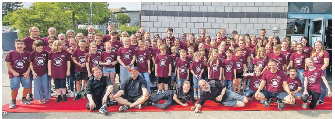
Auch bei der 25. Auflage der Kinder-Musik-Freizeit hatten die Teilnehmer wieder jede Menge Spaß.

Neben den musikalischen Proben, dem Schauspielen und Requisitenbau stand natürlich auch jede Menge Spaß dem Programm. Viele gemeinsame Freizeitaktionen, Spiele, Lagerfeuer, Nachtwanderung, Schwimmen, Kanufahren und verschiedene