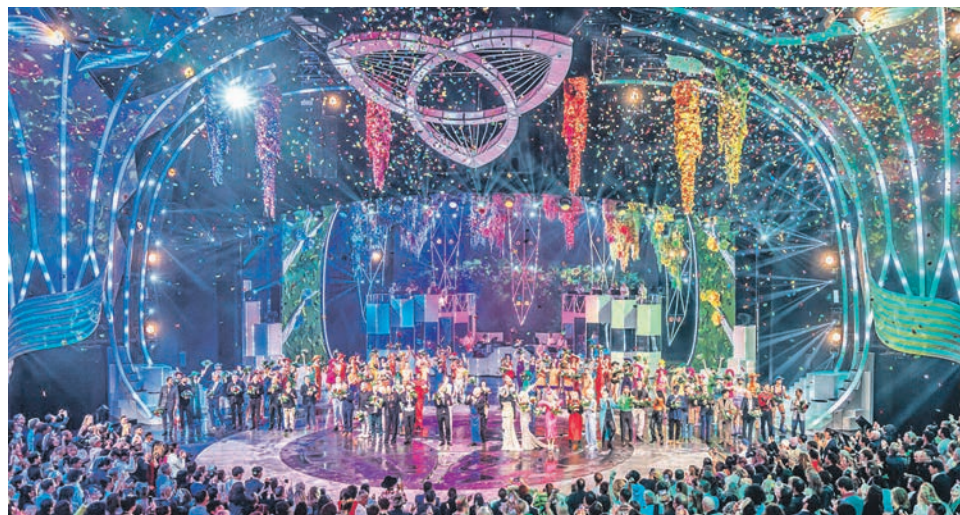
Weltklasse-Show like Las Vegas: Die Weltpremiere „Falling in Love“ begeistert das Publikum in Berlin.

Als kulturellen Höhepunkt der dreitägigen Sonderreise zum Termin vom 17. bis 19. November zum sehr günstigen Komplettpreis von nur