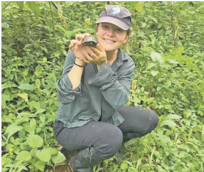
Eine junge Frau kümmert sich in Ecuador um den Schutz von Schildkröten.

Für Experiment ist es von besonderer Bedeutung, dass Teilnehmer sich nicht nur aktiv in ihrem Projekt engagieren, sondern auch für einen längeren Zeitraum eine andere Kultur erleben können. Je nach Land und Projekt können daher Sprachprogramme vor dem Beginn des Freiwilligendienstes besucht werden. Zudem finden am Anfang eines jeden Aufenthalts Seminare statt, die auf bestimmte Feinheiten eines Landes sowie auf kulturelle Unterschiede