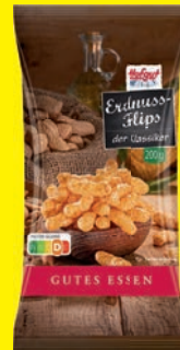
Hofgut Erdnuss-Flips 200 g (1 kg = 3,13 €)