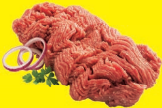
Hackfleisch vom Schwein zum Braten und Garen vielseitig zu verwenden oder Rinderhackfleisch 1 kg = 8,88 €