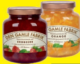
Den Gamle Fabrik Konfitüre verschiedene Sorten 380 g (1 kg = 6,58 €)