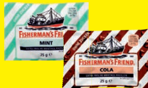
Fisherman's Friend mit oder ohne Zucker verschiedene Sorten 25 g (1 kg = 33,33 €)