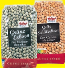
Hofgut Hülsenfrüchte verschiedene Sorten 500 g (1 kg = 2,00 €)