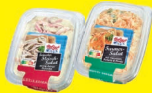
Hofgut Fleischsalat verschiedene Sorten oder Farmersalat 200 g (1 kg = 6,25 €)