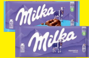
Milka Schokolade verschiedene Sorten 85-100 g (1 kg = 8,33-9,80 €)