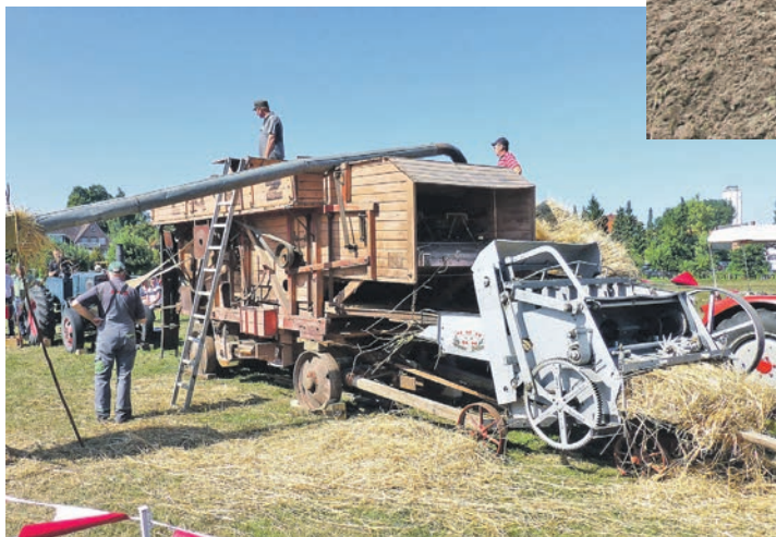
Dreschen wie in alten Zeiten ist Programm auf dem Museumshof.

der Landwirtschaft Dreschmaschinen zum Einsatz. Die ersten Dreschkästen wurden noch von Menschen- oder Pferdekraft bewegt. Auf dem Museumshof Lensahn kommen einige der historischen Geräte zum Einsatz, wie z.B. die Lanz-Dreschmaschine, ein Stiftdrescher, und die Windfege.