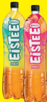
Rauch Eistee verschiedene Sorten 1,5 Liter (1 Liter = 0,83 €) zzgl. 1,00 € Pfand