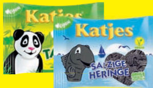
Katjes Fruchtgummi oder Lakritz verschiedene Sorten 175 g (1 kg = 4,08 €)