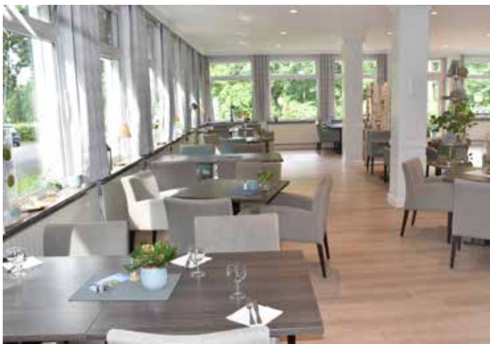
Im Restaurant auf der Wilhelmshöhe gibt es einen Mittagstisch, zu weiteren Terminen auch Kaffee und Kuchen.

und Käse, Saft und Bier sowie natürlich Fleisch von unseren eigenen Galloways.“ Es ist ein Bio-Vollsortiment, das über die Naturkostprodukte hinausreicht und auch Pflege- und Haushaltsartikel umfasst. „Es sind an die 1000 Artikel, die wir hier führen“, sagt