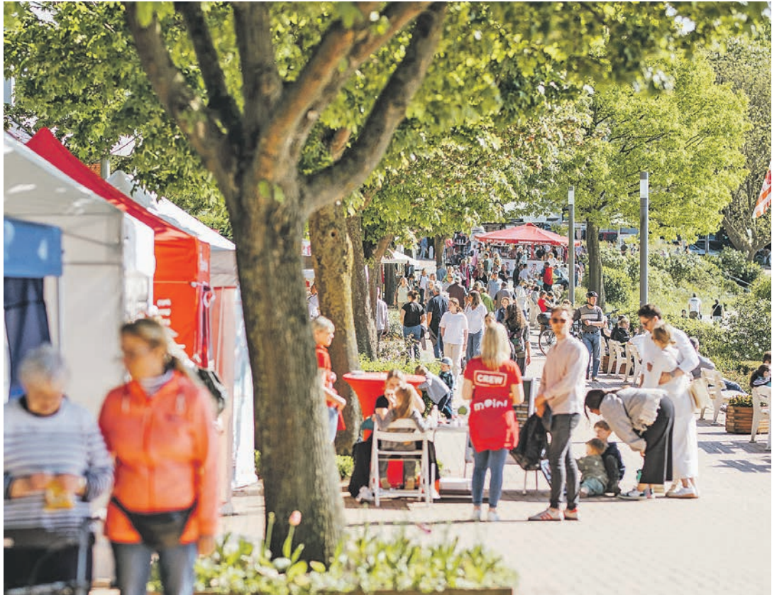
Die Veranstaltung findet ausnahmsweise auf der Diekseepromenade statt.

Malente (t). Auch In diesem Spätsommer können sich Malenter*innen wieder auf einen abwechslungsreichen Bauernmarkt freuen. Am Sonnabend und Sonntag, 14. und 15. September, steigt die Traditionsveranstaltung jetzt unter dem neuen Namen „Malenter Landmarkt“ jeweils von 10 bis 18 Uhr ausnahmsweise auf der Diekseepromenade statt, weil die Durchfahrt zur Sebastian-Kneipp-Straße wegen der Brückenbauarbeiten noch gesperrt ist. Aufgrund des sich über die Jahre weiterentwickelten Charakters des Events, hat sich die Malente Tourismus- und Service GmbH (MaTS) für eine Umbenennung entschieden. Zukünftig soll die Veranstaltung weiterhin am dritten Septemberwochenende auf der bekannten Veranstaltungsfläche rund um die Tews-Kate in der Sebastian-Kneipp-Straße stattfinden, teilt Inga Matthiesen von der Veranstaltungsabteilung der MaTS mit. Man setzt weiterhin auf das bewährte Angebot: An verschiedenen Ständen finden die Besucher*innen eine Vielfalt an Produkten. Das Sortiment reicht von Gemüse, Marmeladen, Likören und Honig über kunsthandwerkliche Artikel wie Keramikarbeiten, selbst gestrickte und selbst genähte Kleidung sowie Holzskulpturen bis hin zu hochwertigen Lederwaren, Silberschmuck und Sonnenbrillen. Ein passendes Livemusik-