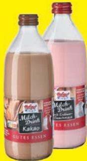
Hofgut Milch-Drink verschiedene Sorten 1,5% Fett 500 ml (1 Liter = 2,00 €)