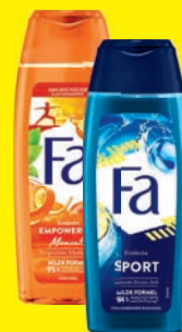
Fa Duschgel verschiedene Sorten 250 ml (1 Liter = 4,00 €)