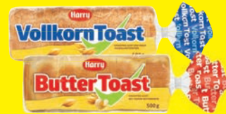
Harry Butter- oder Vollkorn-Toast 500 g (1 kg = 2,50 €)