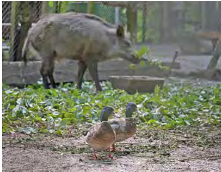
Die Enten – und zahlreiche andere Vögel – sind gern auf Stippvisite in der liebenswerten Wildschwein-WG.

Doch lohnt sich ein Abstecher zu den gedrunghenen Borstentieren mit den platten Schnüffeln eigentlich immer, da sie gern ein aktionsreiches Familienleben pflegen. Da wird gerandelt und gequitscht, geschubst und gerauft oder im freundschaftlichen Miteinander fried-