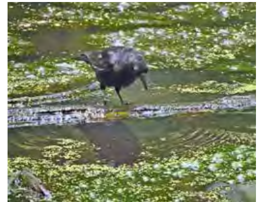
Die Krähe bringt den treibenden Knüppel in die Drehung und schnappt sich die leckeren Larven, die dabei an die Oberfläche kommen.