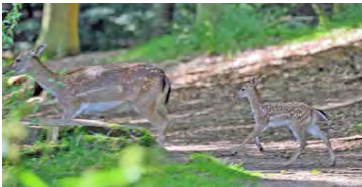
Der noch junge Damwild-Nachwuchs saust im Galopp hinter seiner Mutter her.