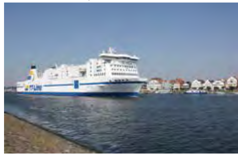
Unterwegs mit den Jumbo-Linern der TT-Line zum großen Jubiläum Kurs Schweden.

ternationale First-Class-„Scandic“-Hotel mit stilvollen Komfortzimmern und dem leckeren Frühstück vom Buffet für zwei Nächte. Am zweiten Tag ist eine große Stadtrundfahrt in Malmö mit fachkundiger, deutschsprachiger Reiseleitung zu den Höhepunkten Malmös, eine der schönsten Städte Schwedens in malerischer Lage am Öresund, extra zu buchen für nur 19,90 Euro.