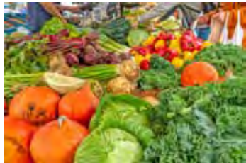
Demnächst starten im Kreis Ostholstein noch AOK-Kurse mit freien Kursplätzen. Unter anderem geht es um Gemüse.

Eutin (t). Regelmäßige Bewegung und ausgewogene Ernährung steigern die Fitness und das Wohlbefinden. Eine gute Balance zwischen Bewegung und Entspannung sowie ein rauchfreies Leben sind die besten Voraussetzungen