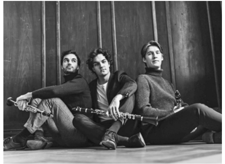
Das „Trio ClariNoir“ gastiert in Eutin.