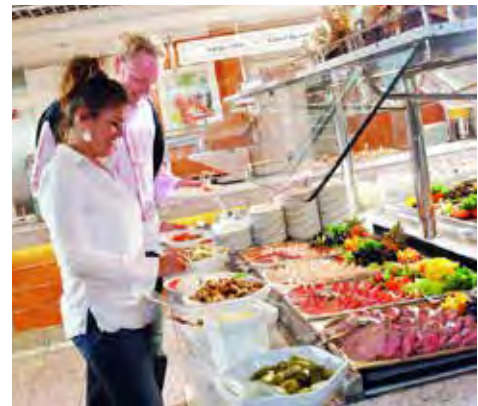
Auch kulinarisch werden die Reporter-Leser an Bord der Märchenschiffe auf dem Hin- und Rückweg rundum verwöhnt.

Anmeldungen sind ab sofort im Reporter-Leser-Reisen-Büro des Burg-Verlages in Eutin unter Telefon 04521-701130 (täglich von 9 bis 13 Uhr) sowie direkt online auf leserreisen.der-reporter.info möglich.