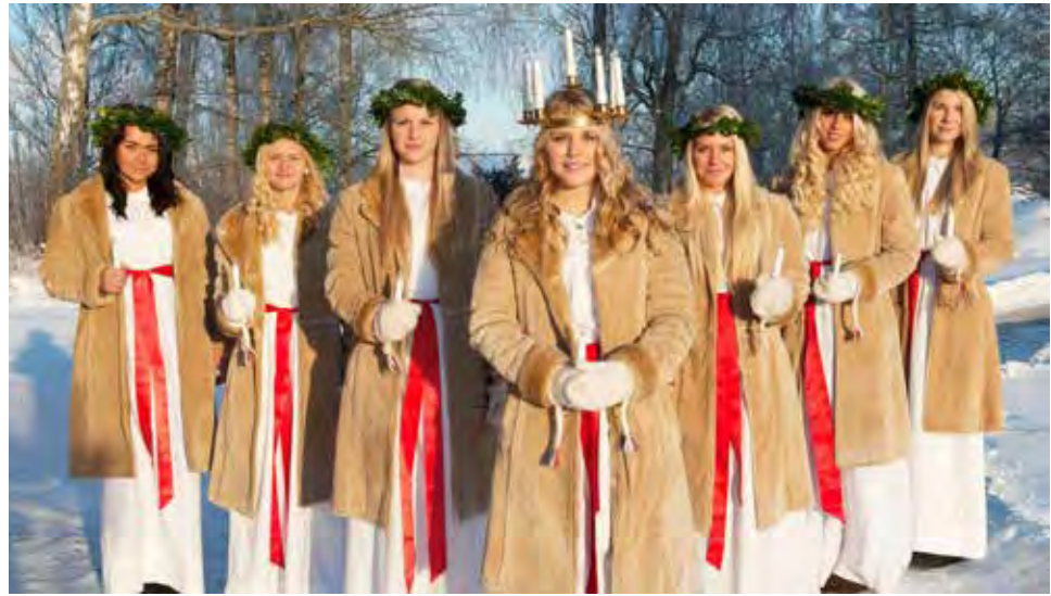
Das Lucia-Lichterfest wird in Schweden fröhlich und opulent gefeiert.

Der Kurs der Reise startet ab Eutin mit einer Entdecker-Kreuzfahrt mit Bus und Jumbofähren nach Schweden: Die Einschiffung von Bus und Fahrgästen erfolgt in Travemünde auf das größte „Green Ship“-Jumbofährschiff der Welt, die MS „Peter Pan“ (Schiffsänderungen vorbehalten). An Bord werden die Leser mit schwedischen Schlemmer-Spezialitäten preisinklusive rundum verwöhnt und sie genießen die komfortable Überfahrt auf dem Jumbo-Liner mit kostenloser Benutzung der herrlichen Sonnendecks zum Entspannen. In Schweden erwartet die Reporter-Gäste sodann das in-