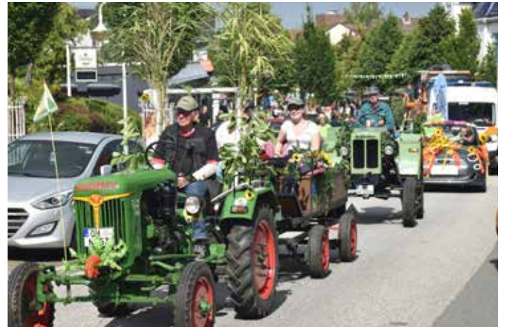
Der Festumzug nimmt am Sonnabendnachmittag wieder Fahrt auf.

Die Marschroute entspricht der des Vorjahres. Sie wurde an die Gegebenheiten angepasst, die aktuell mit den verschiedenen Baustellen in Malente vorzufinden sind. So beginnt der gesamte Festumzug am Vereinsheim in der Neversfelder Straße 98. Dabei versammeln sich die Fahnenabordnungen zum Start auf dem Vereinsgelände, während alle anderen Teilnehmenden sich aus Richtung Neversfelde in der Neversfelder Straße aufstellen. Der Festumzug führt dann über Marktstraße und Bahnhofstraße zur Buswendeschleife auf dem Bahnhofsvorplatz und zurück. Die Fahnenabordnungen biegen jedoch zuvor in die Lindenallee ein und marschieren über die Wilhelminenstraße und Kampstraße wieder auf die Bahnhofstraße, wo sie sich den anderen wieder anschließen. Der Festumzug klingt dann auf dem Vereinsgelände mit Blasmusik der „Original Ostholsteiner“ aus und geht ab 19 Uhr in die Partynacht mit DJ Alex D über.