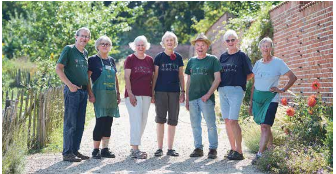
Übrigens: Wer selbst im Küchengarten aktiv werden möchte, ist herzlich willkommen. Die gesellige Runde der ehrenamtlichen Gärtnerinnen und Gärtnern freut sich auf neue Mitglieder.

Eutin (t). Bis zum Spätsommer gibt es jeden ersten Freitag im Monat das „Küchengarten-Spezial“ in Eutin: Um 14.30 Uhr gehen Gäste im geführten Spaziergang „Das grüne Herz von Schloss Eutin“ vom Schloss in den Küchengarten, plaudern von 15 bis 17 Uhr mit ehrenamtlichen Gärtnerinnen und Gärtnern über den Gartenzaun hinweg und bekommen am Marktstand gegen Spende die frische Ernte aus den Beeten. Die letzten Termine der Gartensaison finden am 2. August, 6. September und 4. Oktober statt. Im Sommer und bis in den Herbst hinein, wenn es im Küchengarten viel zu sehen und zu tun gibt, geht dieses Event über die Bühne. Der Nachmittag im Küchengarten ist ein offenes Angebot: Interessierte können die Führung und die ehrenamtlichen Gärtnerinnen und Gärtnern in ihren Beeten und den Marktstand besuchen oder