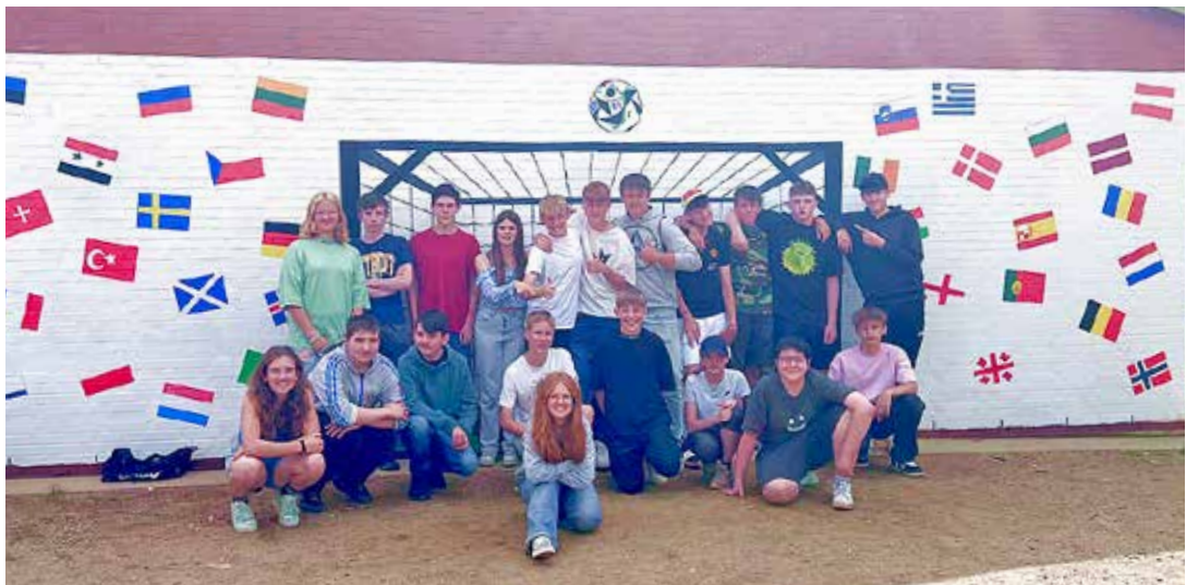
Das Projekt der Klasse 8a war ein Hingucker: Sie hatte ein riesiges Tor an die Schulwand gemalt.