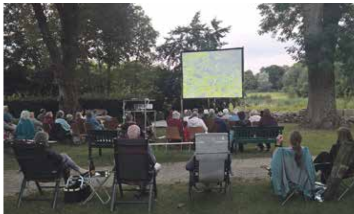
Der Naturerlebnisraum „Historischer Pfarrhof Schönwalde“ bietet eine imposante Kulisse für die vierte Auflage des Kinosommers.

schen den 45 Minuten langen Dokumentationen wird es die Gelegenheit für eine Erfrischung und den Austausch geben. Der Verkaufserlös der Snacks und Getränke trägt zum Erhalt und zur Entwicklung des Naturerlebnisraumes bei. Der Eintritt zum Kinosommer ist frei, Spenden sind jedoch willkommen. Bei schlechtem Wetter werden die Filme auf einer Großleinwand in der Schönwalder Kirche gezeigt. „Die Natur-Dokumentationen der BBC gehören regelmäßig zu den mit Preisen ausgezeichneten Produktionen. Auch deshalb haben wir uns entschieden, in die-