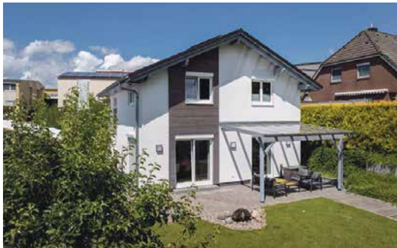
Das Musterhaus in Dakendorf kann jederzeit nach Terminabsprache besichtigt werden.

Neben dieser grundlegenden Qualität können „Contract-Vario“-Häuser individuell, flexibel und unkompliziert gestaltet werden. Um Interessierten die gesamte Bandbreite der Möglichkeiten zu demonstrieren, hat