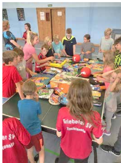
Die Kinder wurden am Ende mit gestifteten Sachpreisen belohnt.