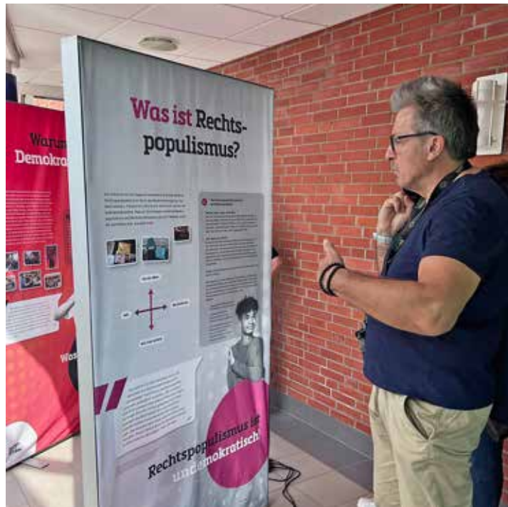
Eine Ausstellung informierte über die Themen Demokratie, Diskriminierung und Zivilcourage.

Weitere Informationen über die Arnesboken-Schule und ihre Projekte sind auf der Website arnesboken-schule.de zu finden.