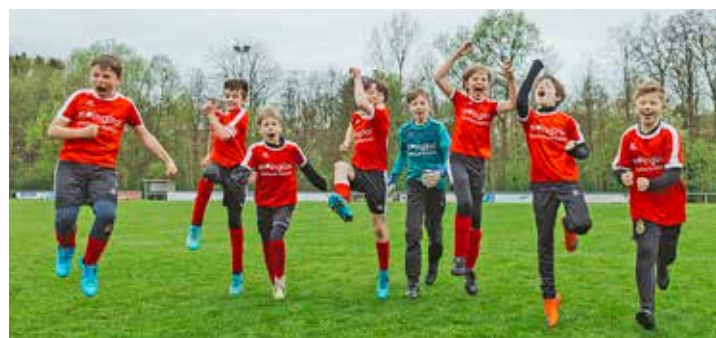
122 Teams können sich in diesem Jahr über neue Trikots freuen.

Zur Ermittlung der Gewinnerteams wurde ein dreistufiges Verfahren eingesetzt: in der ersten Stufe ein Online-Voting, in dem jeder auf der Webseite der Trikotaktion für sein Team abstimmen konnte, in der zweiten Stufe ein Online-Voting der moingiro!-Inhaber bei der Sparkasse und in der dritten Stufe ein Jury-Entscheid.