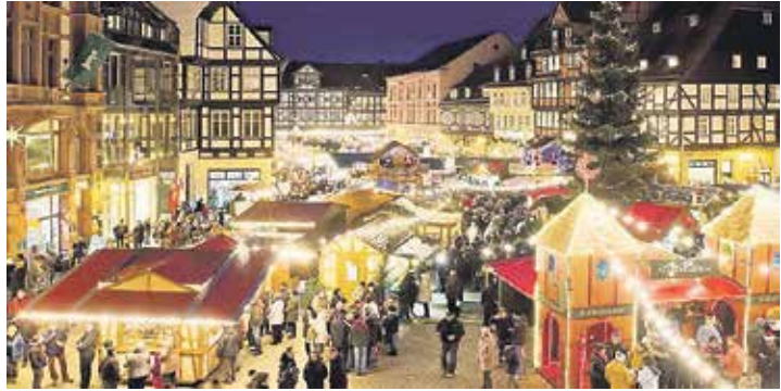
Weltweit einmalig ist der berühmte „Advent in den Höfen“ in Quedlinburg im winterlichen Harz.

den Höfen“ in Quedlinburg, wo im UNESCO-Weltkulturerbe mehr als 30 der historischen Höfe nur an drei Sonntagen im Jahr im Advent ihre Tore öffnen für ein ganz besonderes Vorweihnachts-Erlebnis.