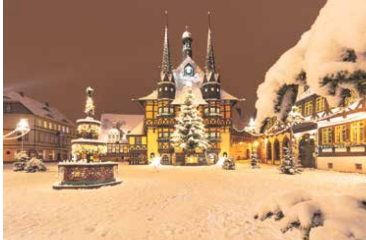
Ein magisches Winter-Erlebnis ist auch der romantische Weihnachtsmarkt in Wernigerode.

1. Dezember (1. Advent) und am 2. Advent vom 6. bis 8. Dezember. Es geht in den weihnachtlichen Harz mit dem Höhepunkt des Besuches des romantischen Weihnachtsmarktes „Advent in