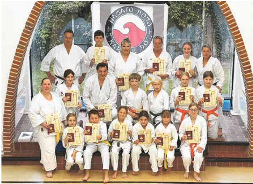
Die Mitglieder des Nagato Dojo e.V. Eutin haben ihre Fähigkeiten in Prüfungen unter Beweis gestellt.

Das Nagato Dojo in Eutin bietet Kinder-Karate für Kids im Alter ab sechs Jahren immer mittwochs und freitags von 16 bis 17 Uhr im „Vielklang“ in der Janusstraße 2b an. Das Mittwoch-Training findet auch in den Sommerferien statt, außerdem nimmt der Verein an der Ferienpass-Aktion teil. Neugierig gewordene Jugendliche und Erwachsene sind ebenfalls gerne zu einem Probetraining eingeladen. Hierfür sind weitere Informationen auf der Homepage www.nagato-dojode.de zu finden.