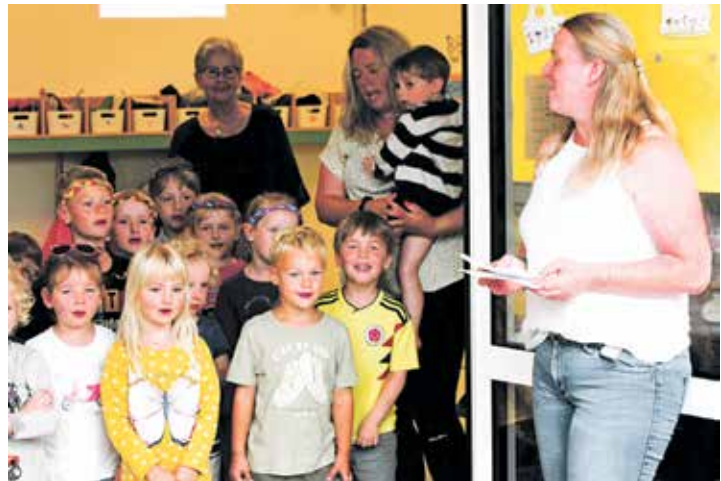
Mit einem gemeinsamen Lied wurden die Kinder der Bienengruppe verabschiedet.