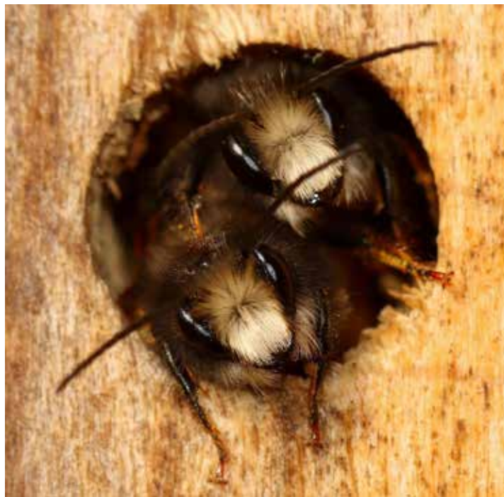
Dieses Bild zeigt zwei Gehörnte Mauerbienen.

werden dann Fragen beantwortet wie: Warum sind Wildbienen so wichtig? Haben die im Sommer oft störenden Wespen ihren schlechten Ruf eigentlich verdient? Gibt es vegetarische Wespen und sogar fleischfressende Bienen? Und was ha-