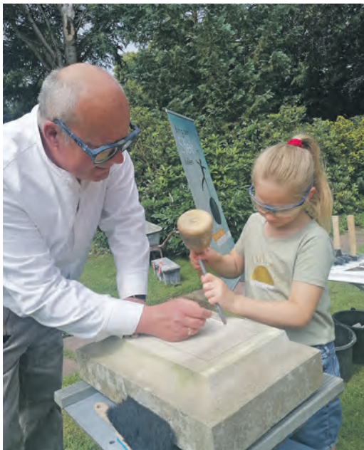
So arbeiten Steinmetze.