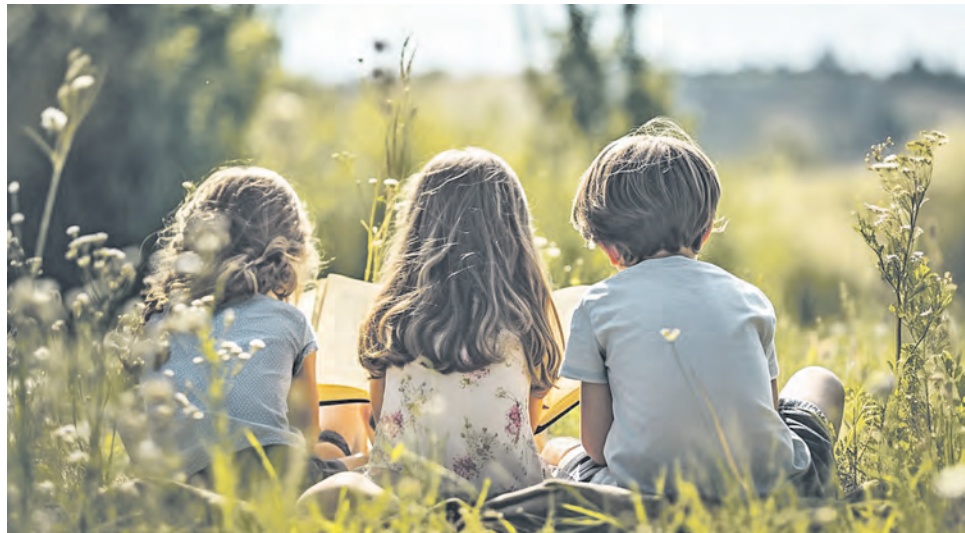
Garantiert nicht langweilig wird es im Ferienleseclub.

Die älteren Schüler*innen können sich im digitalen Clubraum anmelden und mit anderen Teilnehmenden, gelesene Geschichten und Tipps für spannende Lektüre austauschen. Im Clubraum befinden sich Links zur Onleihe (Portal für eBooks) und zu den Bibliothekskatalogen. Darüber hinaus können die Teilnehmer*innen, Bücher mit kreativen Beiträgen (Texte, Bilder, Audios) bewerten und sich informieren, was ande-