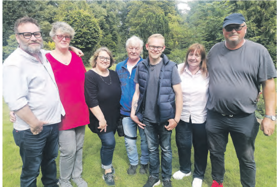
Voller Einsatz: Das Friedhofsteam sorgte für die Vorbereitungen und einen reibungslosen Ablauf.