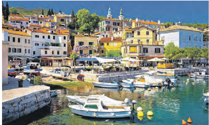
Malerische Städte und mediterranes Klima prägen die azurblaue Urlaubs-Küste in Kroatien in den Herbstferien.

Zwischenübernachtung in Bayern mit Halbpension sowie vier Nächte mit Halbpension und abendlichem Getränke-Paket, ein großer Panorama-Ausflug in das weltberühmte mondäne Seebad Opatija mit seiner einmaligen Gründerzeit-Architektur und herrli-