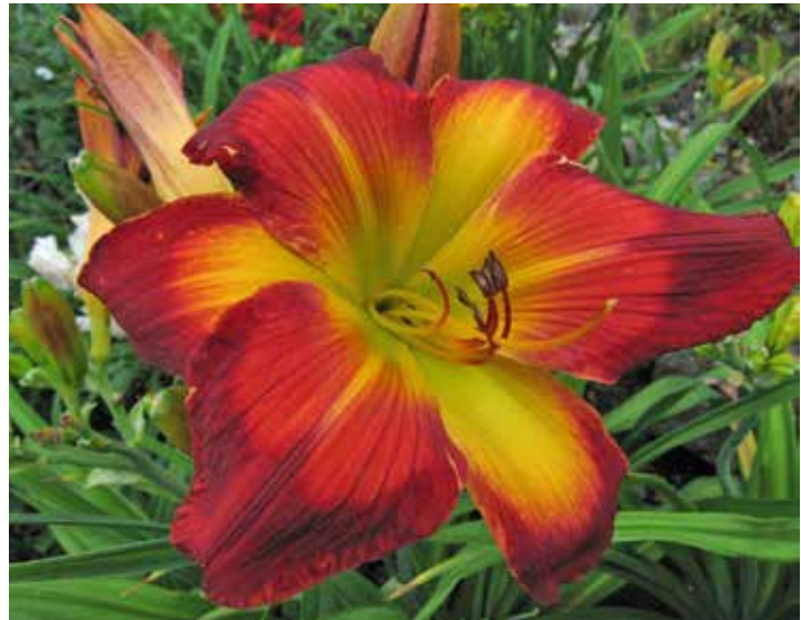
Wispy Rays ist ein davon.