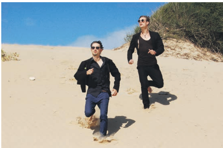
Die Brüder von Tanga Elektra mit ihrem unverwechselbaren Sound aus Neo-Soul, Elektro und Funk-Elementen.