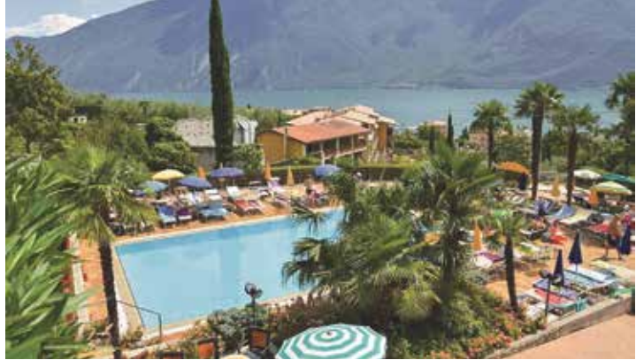
In traumhafter Lage in Limone am Gardasee erwartet das First-Class-Hotel die Reporter-Leser.

anlage, umgeben von Oliven- und Zitronen-Hainen, im beliebten Urlaubsort Limone erwartet. Das Hotel verfügt über ein Panorama-Hallenbad sowie subtropische Gärten mit großen Freischwimbädern und Liegewiesen. Kulinarisch werden sie rundum mit den reichhaltigen Schlemmerbuffets verwöhnt. Außerdem erhalten die Leser zum Abendessen „All inklusive“-Getränke ohne Begrenzung. Zum großen Leistungspaket der Sonderreise gehören neben der Fahrt im erstklassigen Fernrei-