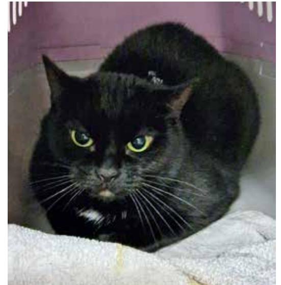
Eher schüchtern: Bailey.