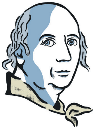
Mit „Willem“ kann man das Museum auf einer Rallye erkunden.