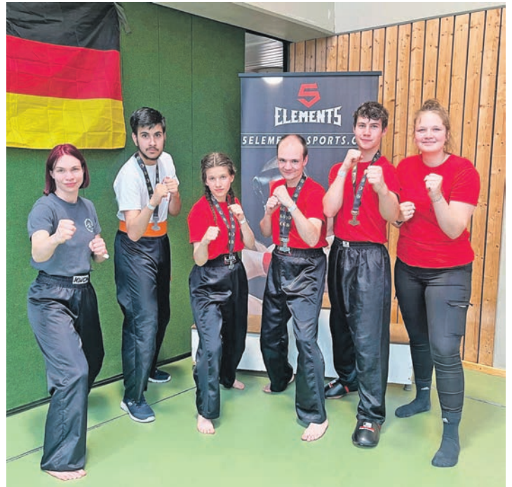
Gut aufgestellt: Das Kickbox-Team der Kampfkunst Academy Eutin.