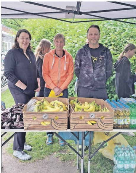
Gut bestückt war der Verpflegungsstand, den die Cafeteria unterhielt.