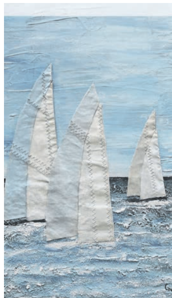
Eines der maritimen Kunstwerke von Gudrun Naujok.

13. Juli, ist die Bilderschau von 14 bis 20 Uhr geöffnet. Am Sonntag, 14. Juli, können die Werke von 11 bis 16 Uhr bestaunt werden. Dazu gibt es stets Snacks und Getränke. Die 40 Exponate präsentieren den Norden, Schleswig-Holstein und die Küste.