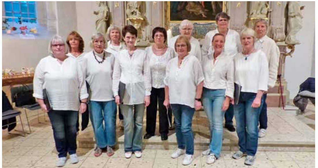
Der Chor „Dreiklang“ lädt zum Sommerkonzert ein.

Der Chor ist eine feste Größe im Gemeindeleben und bereichert mit seinen Auftritten Gottesdienste und Feste. Mit sommerlichen Weisen stimmt das Ensemble auf sonnige Zeiten ein. Ein Höhepunkt, den man sich nicht entgehen lassen sollte.