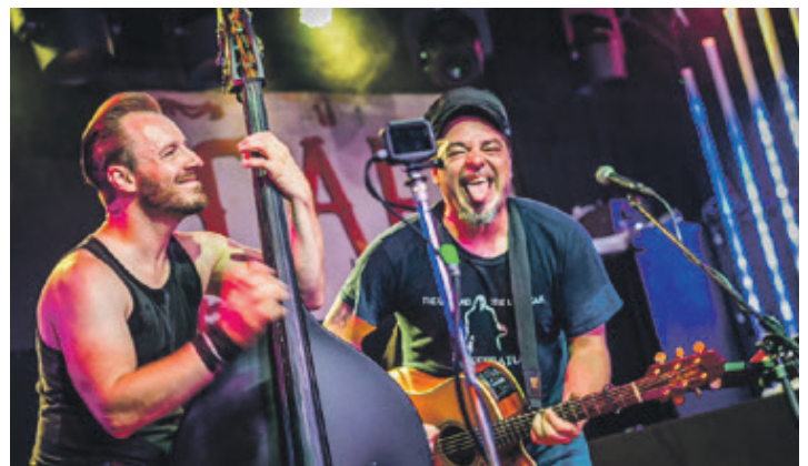
„Rossi & Offel“ – ein Duo wie Rampe und Sau.

dann wird das ein oder andere Konzert im großen Zelt der Puppenspieler auf der Wiese vor der Seebrücke „Flunder“ stattfinden. Sehr herzlich willkommen! Ihr Team der Hohwachter Bucht Touristik GmbH