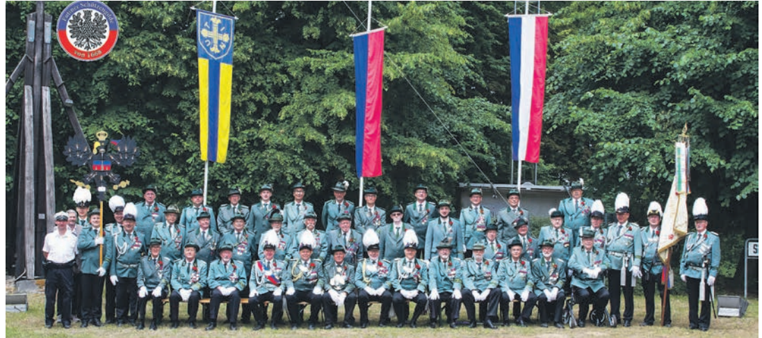
Schützenfest 10. Juli 2023

Am Sonnabend, 13. Juli, ist für alle Schützen das „Stangenrichten“ angesetzt. Die Holzvögel werden für das Schießen aufgerichtet. Das Kindervogelschie-