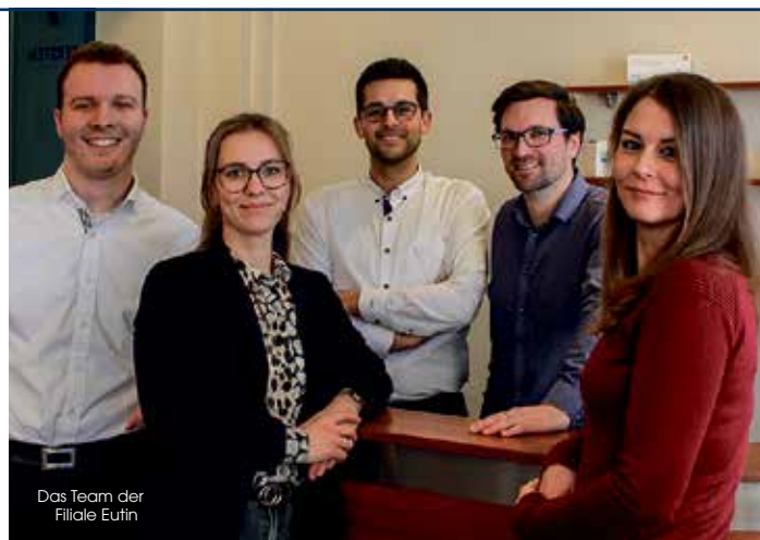
Das Team der Filiale Eutin