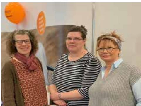
Das BDH-Team freut sich auf viele Interessierte.

steht der BDH für starke Selbsthilfe: Information, Beratung, Unterstützung und Vertretung in allen Angelegenheiten des Sozialrechts – und eine echte Gemeinschaft vor Ort. Wer Fragen zum Sozialrecht, zu Krankenversicherung, Pflege, Behinderung oder Erwerbsminderungsrente hat, ist hier ebenso richtig wie alle, die Beratung, Unterstützung bei Anträgen oder professionelle juristische Vertretung brauchen: „Wer sind wir? Was machen wir? Lernen Sie uns und unsere Arbeit kennen“, lädt das freundliche Malenter Team ein, das gern einen Einblick in die Regionalgeschäftsstelle gibt. Dazu werden Getränke gereicht und ein Glücksrad steht bereit.