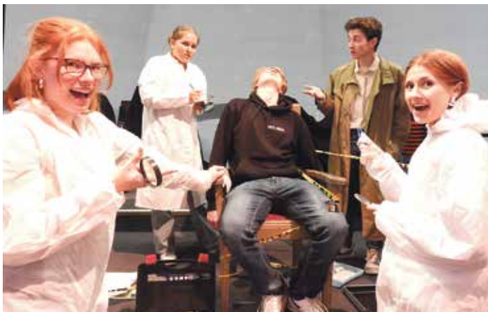
Die Freude über den Todesfall steht den Ermittlern ins Gesicht geschrieben.