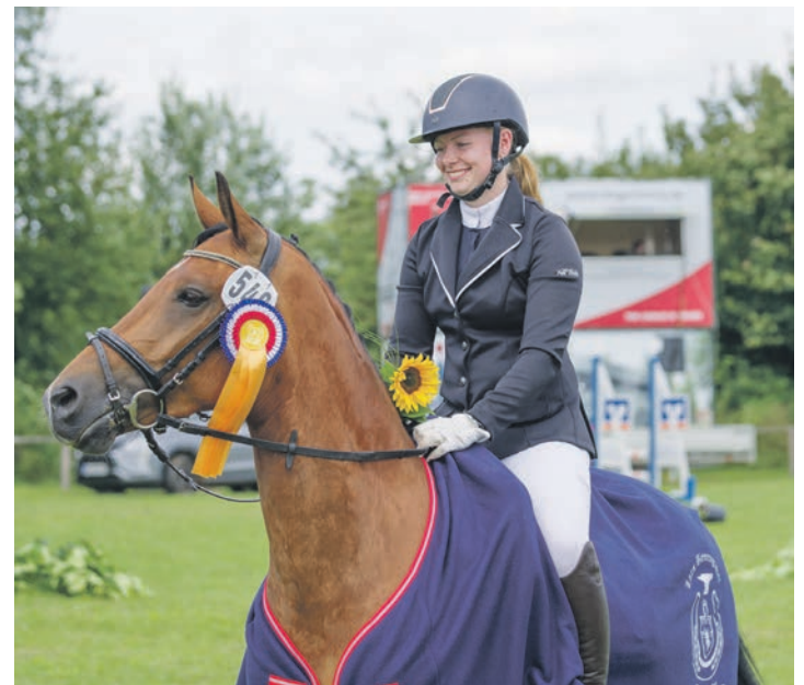
Die großen Preisschleifen und von den Sponsoren gestellten Siegerdecken sicherten bei allen Reitern wieder ein strahlendes Lächeln auf das Gesicht.

Bei den Dressurreitern wurde der Tag mit einer Ü 30-Dressurprüfung der „Casper von Rumohr