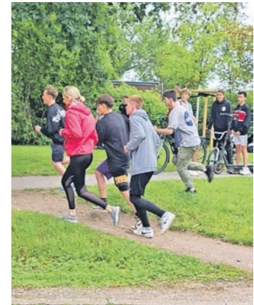
Flinke Beine waren gefragt bei den Runden am See.

Sogar das Wetter spielte bei diesem fröhlichen Sportevent mit, starke Teams sind beim Wisserslauf gefragt und bei der EM.