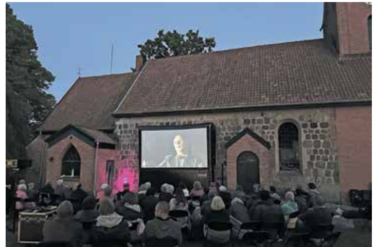
Das KirchenKino steht für eine ganz besondere Atmosphäre.

ist kostenlos, es wird jedoch die Möglichkeit zur Spende geben, die dem Hospizverein Kindern auf Schmetterlingsflügeln e.V. zugutekommen. Für Popcorn, Getränke und ausreichend Sitzmöglichkeiten ist gesorgt. Es darf aber auch alles selbst mitgebracht werden. Das Team der Kirchengemeinde Malente freut sich auf viele Besucher*innen. Der Eintritt ist frei, eine Spende wird erbeten. Weitere Infos gibt es auf www.kirche-malente.de