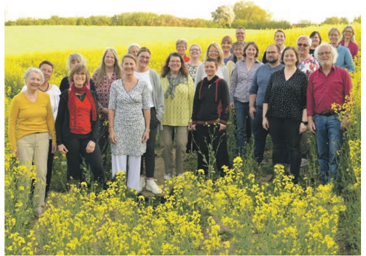
Seit 25 Jahren bereichert Vocapella Eutin die regionale Musikwelt.

aktuell circa 40 Mitglieder zählen. Zu seinem besonderen Jubiläum plant der Chor Vocapella Eutin eine Reihe von Konzerten, um das 25-jährige Bestehen gebührend zu feiern. Mit einem Querschnitt seines Repertoires vom Mittelalter bis zur Moderne freuen sich die Mitglieder auf ihr Publikum am Samstag, 6. Juli, um 15 Uhr in der Kapelle Bliesdorf, am Donnerstag, 11. Juli, um 19.30 Uhr in der Evangelischen Kirche Süsel und zum offiziellen Jubiläumskonzert am Sonnabend, 20. Juli, um 19 Uhr im Jagdschlösschen am Ukleisee. Der Eintritt ist jeweils frei, um Spenden wird gebeten. In Bliesdorf und Eutin wird es einen kleinen Imbiss geben. Die Konzerte und deren Vorbereitung wurden unter anderem durch eine großzügige Spende der Sparkassenstiftung Ostholstein möglich.