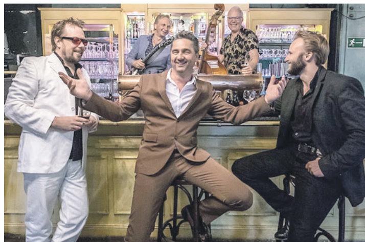
Mit einer Mischung aus Soul und Rhythm & Blues rocken diese fünf Hildesheimer von „BB & The Blues Shacks“ alles – von Clubs bis zu Festivals.