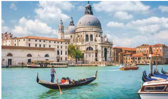
Eines der attraktiven Ausflugsziele der Gardasee-Reise ist die weltberühmte Lagunenstadt Venedig.

sebus direkt ab Eutin ohne Einsammeltour je eine Zwischenübernachtung/Halbpension in Bayern auf der Hin- und Rückreise im idyllischen Altmühltal, vier Übernachtungen im First-Class-Hotel in Limone mit vier Frühstücksbuffets und vier reichhaltigen abendlichen Schlemmerbuffets sowie viermal „All-inklusive“-Getränke zum Abendessen ohne Begrenzung (Wein, Wasser, Softdrinks) sowie eine große Gardasee-Rundfahrt mit Aufenthalt in einigen der schönsten Wein- und Kurorte am See. Zusätzlich gegen Aufpreis