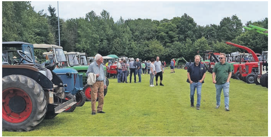
Rund 200 Teilnehmer zieht es nach Hutzfeld.

angebotene Eis bei dem schwülwarmen Wetter für Erfrischung. Das Treffen endete am Sonntag mit einem zünftigen Frühstück und einem Treckergottesdienst. Danach haben alle Helfer und auch der Rasen des Sportplatzes wohl eine Erholung verdient.