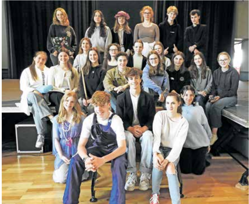
Das Ensemble freut sich auf die Premiere.

mit seinem Team aus Assistenten, Tatortermittlern und Gerichtsmedizinerin – allesamt sichtlich erfreut über den Todesfall – versucht er, dem Geheimnis auf die Spur zu kommen. Leider zeigen sich die Mitarbeiter des Theaters wenig kooperativ. Und auch Braining selbst scheint mehr mit seinen eigenen Problemen und Interessen beschäftigt zu sein, als ernsthaft an dem Fall zu arbeiten. Während der Ermittlungen rückt auch ein mysteriöses Küstenstädtchen in den Fokus der Beteiligten. Wird es Braining gelingen, den Fall zu lösen?