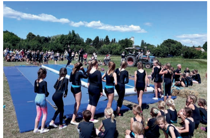
Beim Kinderfest auf dem Museumshof finden viele tolle Aktionen für Kinder statt.

Tag einen spannenden Spieleparcours, Trecker-Rundfahrten, die Teppichrutsche, leckere Speisen und Getränke. Der Eintritt ist frei. Zeitgleich findet auf dem Hofplatz ein Kinderflohmarkt statt, auf dem Kinder kostenlos verkaufen dürfen. Stände von Erwachsenen kosten 6 Euro pro Meter. Es dürfen nur Kindersachen verkauft werden. Anmeldungen zum Flohmarkt erfolgen unter Telefon 04363-91122.