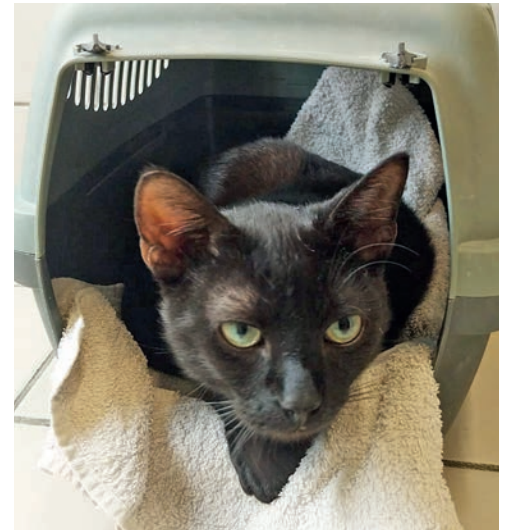
Loki ist sehr freundlich und freut sich über jeden Kontakt mit Menschen.

Kater Loki ist ein junger, draufgängerischer Kater. Er sucht einen tierliebenden Haushalt mit viel Auslauf. Weil Loki auch auf fremde Leute sehr zutraulich zugeht, wäre es besser, wenn der einjährige Vierbeiner etwas ländlicher wohnen würde. Dort könnte er über Wälder und Wiesen streifen und auf Entdeckungstour gehen, satt anderswo Anschluss zu suchen. Loki hätte kein Problem damit, mit einer weiteren Katze zusammen zu leben. Gerne kann er auch mit einer der anderen Tierheimkatten zusammen adoptiert werden. Auch für Loki gilt, dass er kleine Kinder nicht die ideale Gesell-