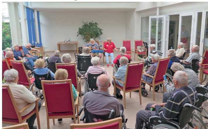
Rund 30 Seniorinnen und Senioren erfreuten sich im DRK-Pflegeheim an der Musikdarbietung.

„Es ist immer wieder beeindruckend, wie Musik auf die Seniorinnen und Senioren