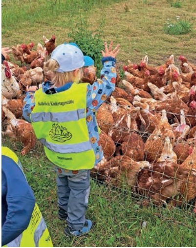
Hühner zu füttern...

Eutin (hs). Wenn sich die „Hummelgruppe“ und die „Kükengruppe“ der Kita Spatzennest mit ihren Erzieherinnen auf den Weg zum Biohof Froberg machen, dann steht ein Tag ganz nach dem Motto der Kita „Fröhlich sein, Gutes tun und die Spatzen pfeifen lassen“ bevor.