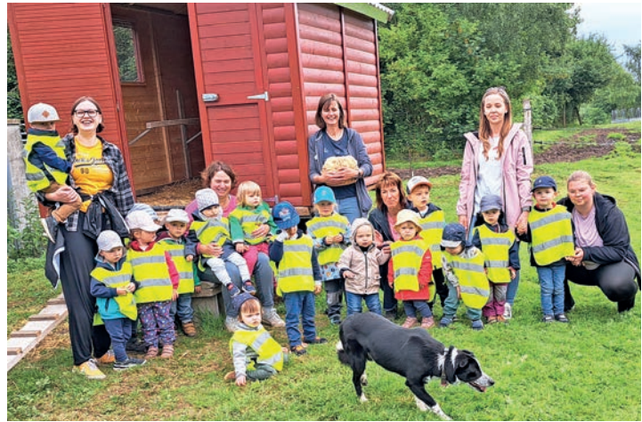
Die „Hummeln“ und „Küken“ aus dem „Spatzennest“ hatten viel Freude beim Ausflug auf den Froberghof.

Der Hof Froberg am Rande von Eutin ging aus einer Gärtnerei hervor. Familie Froberg bietet Kindern von einem Jahr bis ins Teenageralter die Möglichkeit, den Kontakt zu Tieren und der Natur unkompliziert aufzunehmen. Die bauernhofpädagogin