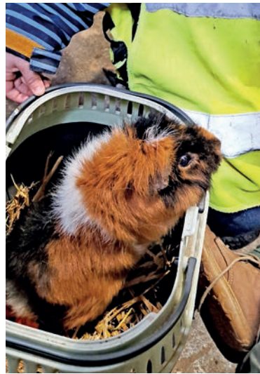
...und Meerschweinchen zu streicheln war eine tolle Erfahrung.

schen Angebote werden von dem auf dem Hof befindlichen Bauernhofkindergarten und anderen festen Gruppen, unter anderem der Familienbildungsstätte, der Tagesklinik und den Bewohnern des Hauses am Priwall regelmäßig genutzt.