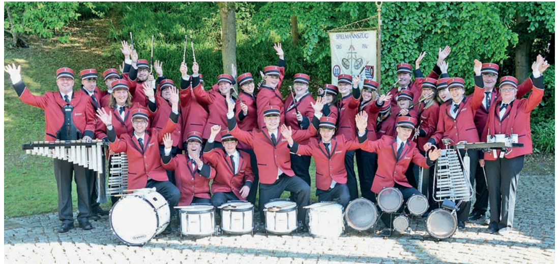
Ein Malenter Original: der Spielmannszug.