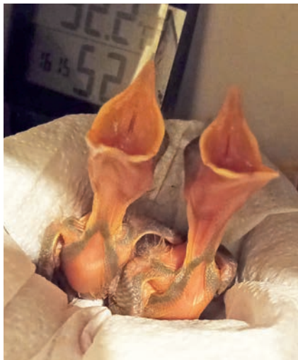
Hungrige Schnäbel zu stopfen: Amseln essen circa 75 Gramm Insekten am Tag.

Eutin (jo). Unter den mehr als 150 geretteten Wildtieren, die das Eutiner Tierheim-Team nicht nur aufnimmt und versorgt, sondern auch zu Hause wieder komplett fit pflegt, befinden sich viele verschiedene Tierarten. So pflegen die Mitarbeiter und Mitarbeiterinnen über 130 Wildvögel (Spatzen, Amseln, Maisen, Tauben, Rabenvögeln, Enten