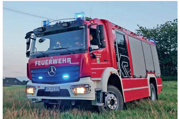
Das moderne Hilfeleistungslöschgruppenfahrzeug der Ortswehr steht am 30. Juni vor dem Museum.

Bestehen. Aus diesem Anlass präsentiert sich die Feuerwehr Schönwalde mit einer Sonderausstellung zu Geschichte der Wehr im Dorf- und Schulmuseum. Auch ein Einsatzfahrzeug steht vor dem Ausstellungshaus. Wer will, darf auch einmal Ausrüstungsgegenstände in die Hand nehmen und in die Einsatzkleidung schlüpfen. Für Kinder baut die Jugendfeuerwehr eine Hüpfburg auf und bietet Spiele rund um die Feuerwehr an. Hightec präsentiert die Drohnengruppe der Amtsfeuerwehr Ostholstein-Mitte. Interessierte können sich über die Drohne auf neuestem Stand der Technik informieren und diese auch in Aktion erleben.