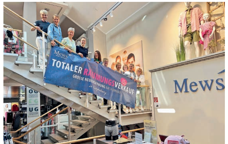
Das Modehaus Mews will noch frischer und moderner werden. Doch vor der Renovierung startet ein großer Räumungsverkauf, der am Donnerstag, 27. Juni, beginnt.