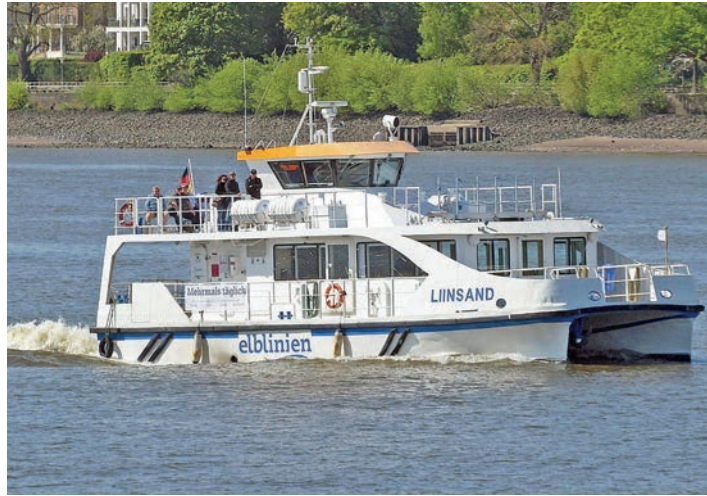
Unter Reporter-Flagge Kurs Dänemark reisen die Leser*innen bei der Premieren-Kreuzfahrt mit dem neuen Highspeed-Katamaran.

Der Kurs der Exklusiv-Kreuzfahrt unter Reporter-Flagge mit dem umweltfreundlichen Hybrid-Katamaran, der komplett emissionsfrei nur mit Batteriekraft unterwegs ist, führt zunächst vorbei an Glücksburg und den dänischen Ochsen-Inseln durch die Flensburger Innen- und Außenförde, rund um die Halbinsel Holnis und sodann Kurs Nord entlang der dänischen Inselwelt zur Insel Alsen und direkt zum Anleger am