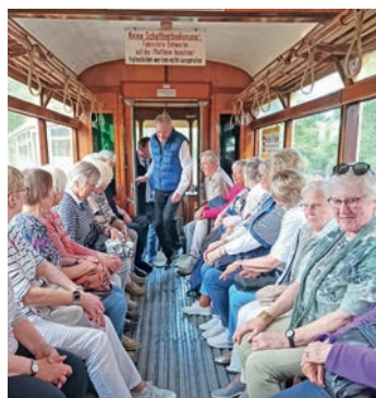
Fröhlich unterwegs ist man auf den Fahrten des Eutiner SoVD, jüngst ging es ins Straßenbahnmuseum.

Nach einem gemeinsamen Mittagessen ging es zum Straßenbahnmuseum am Schönberger Strand. Auf zwei Demonstrationsstrecken fuhren die Teilnehmenden mit verschiedenen Straßenbahnen mit ehrenamtlichen Straßenbahnführern. Es waren lustige Fahrten zum Beispiel in einer Bahn der „Holz-Klasse“ aus Hannover aus dem Jahre 1927 oder einer etwas jüngeren Bahn aus Hamburg. In der Fahrzeughalle gab es dann noch viele Bahnen von 1894 bis 1975