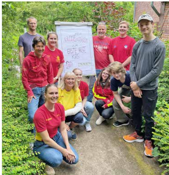
Bestens vorbereitet startet das DLRG-Team in die Saison.