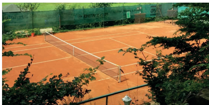
Die Tennisplätze des ETC befinden sich am Seescharwald zwischen Seepark und Waldecksportplatz.

Für Anregungen, Kooperationen, Fragen und viele spannende Ideen mehr lädt das Team Zukunftsschule ein, mit ihnen unter zukunftsschule@bs-eutin.de Kontakt aufzunehmen.