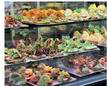
Grenzenlos schlemmen und genießen unsere Gäste beim großen Smørrebrød-Buffet in Dänemark

Anmeldungen zu diesem einmaligen Premieren-Trip sind ab sofort bei den Reporter-Leser-Reisen in Eutin von Montag bis Freitag von 9 bis 13 Uhr unter Telefon 04521-701130 oder direkt online auf leserreisen.derreporter.info möglich.