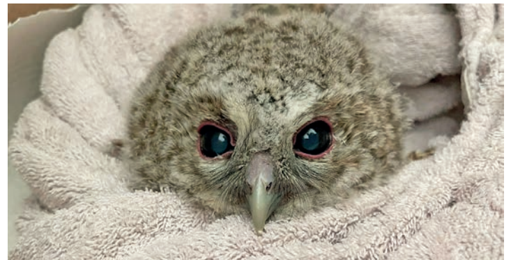
Unter den geretteten Vögeln befand sich auch ein Waldkauz.

und Spechte) und circa 20 Igel und Eichhörnchen. Zur fachlich korrekten Pflege gehört natürlich einiges: Die Tiere müssen nicht nur artgerecht gefüttert und gesäubert werden, sondern auch Tierarztbesuche und eine Unterbringung brauchen die Piepmätze. Eine Amsel ist im Schnitt 70 Tage beim Tierheim untergebracht. Die Insekten, die die Amsel in der Zeit verspeist, kosten alleine schon fast 400 Euro. Ausreichend Insekten sind für Vögel sehr wichtig. Leider finden unsere gefiederten Freunde in der Natur immer weniger Nahrung, weshalb die bemitleidenswerten Tiere oft kurz vorm Hungertod stehen, wenn sie im Tierheim ankommen. Umso wichtiger ist es, dass sie im Tierheim versorgt und langsam aufgepäppelt werden können. Neben der Zeit und dem vielen Geld, das die Pflege der Wildtiere kostet, ist auch enormer persönlicher Einsatz der Mitarbeiterinnen