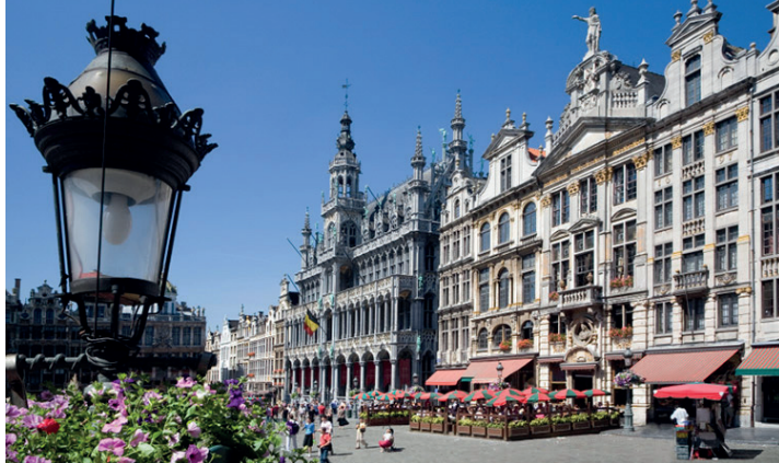
Hauptstadt Europas und Schlemmer-Paradies: Brüssel im Sommerkleid entdecken die Leser*innen im August 2024.

Herzen der Stadt in eine einmalige Blütenlandschaft mit großartigen Bildern und Formaten verwandelt. Residieren werden die Gäste im internationalen First-Class-Hotel mit exklusivem Hotel-Komfort und einem großen Schlemmerfrühstück vom Buffet im guter Stadtlage von Brüssel. Zum großen Leistungspaket zum Komplettpreis von nur 299,90 Euro gehören neben der Fahrt im