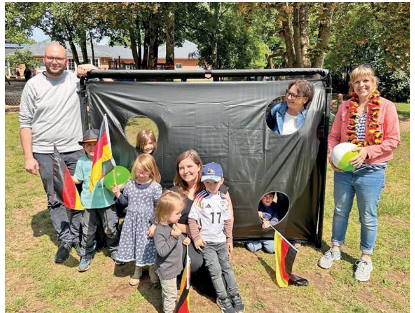
Der Förderverein ist ein Volltreffer für die Kita „Pusteblume“ und ermöglichte die Anschaffung neuer Fußballtore.

Wer weiß, ob irgendwann vielleicht einer der Pusteblumen Kinder es in die große Welt des bezahlten Fußballs schafft. Und sich dann mit einem Lächeln an die ersten Tore auf dem Kindergarten Gelände zurückert. Aber auch wenn nicht,