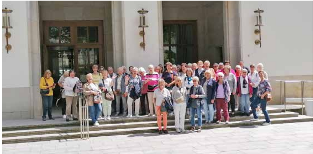
Einen ereignisreichen Tag verbachten die Malenter Landfrauen in Kiel.

Malente (t). Die Malenter Landfrauen waren „on tour“ und sind um tolle Erinnerungen reicher. Am frühen Morgen des 30. Mai ging es am Krützen mit dem los. Dann hieß es volle Fahrt auf die Landeshauptstadt Kiel. Den ersten Stopp erreichte die Gruppe um 10 Uhr beim Botanischen Garten auf dem Gelände der Christian-Albrechts-Universität (CAU). Dort gab es eine spannende Führung über Teile des 8 Hektar großen Geländes. Gestartet wurde in Amerika, wo eine Vielzahl an verschiedenen Baumarten aus überwiegend Nordamerika sowie kleinere Pflanzenarten warteten. Auf dem Weg Richtung des Alpinums streiften man die europäische Pflanzenwelt und