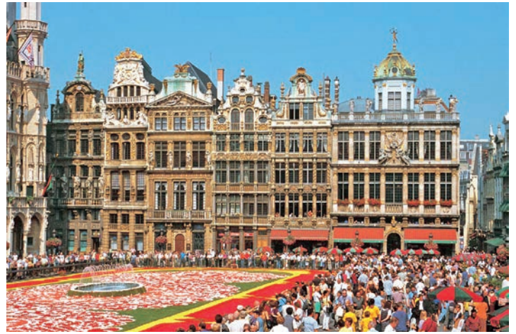
Eine Stadt blüht auf: Der „Brüsseler Blumen-Teppich 2024“ erwartet die Reisenden.