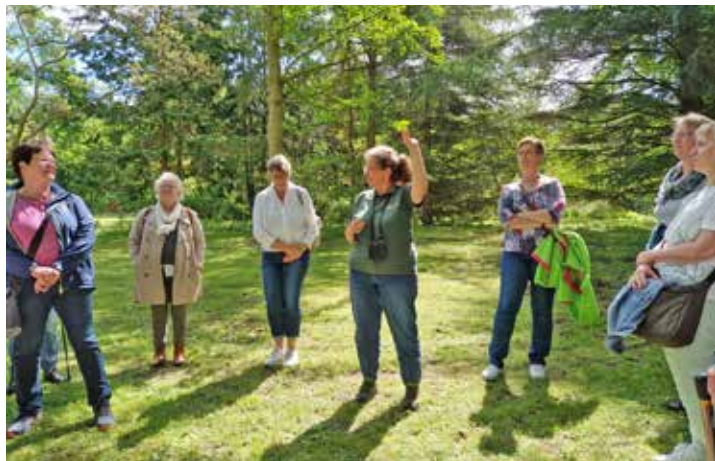
Im Botanischen Garten gab es eine Reise durch die Pflanzenwelt der Kontinente.

das „System der Pflanzen“, welches den zentralen Bereich des Gartens bildet. Im Alpinum gab es nicht nur Pflanzen aus den Alpen, sondern auch aus den europäischen Hochgebirgen, aus Asien, Amerika und Afrika. Selbst einige Pflanzen des Himalaya werden dort beheimatet. Das Ende der Führung bildete Asien mit den Ginkgobäumen. Im Botanischen Garten steht einer der größten Bäume Schleswig-Holsteins.