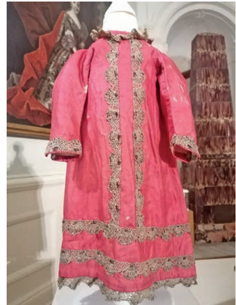
Ein Kleid aus roter Seide, 1700 – 1750

ihre Meinung ist gefragt. Dafür wurden extra Feedback-Stationen eingerichtet. Die Ausstellung ist bis zum 29. September zu sehen. Ein vielfältiges Programm aus Workshops und Vorträgen begleitet die Schau. Alle Informationen finden Interessierte auf www.schloss-eutin.de