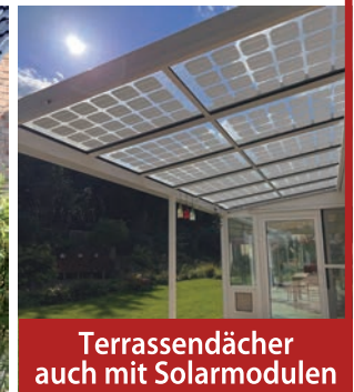
Terrassendächer auch mit Solarmodulen