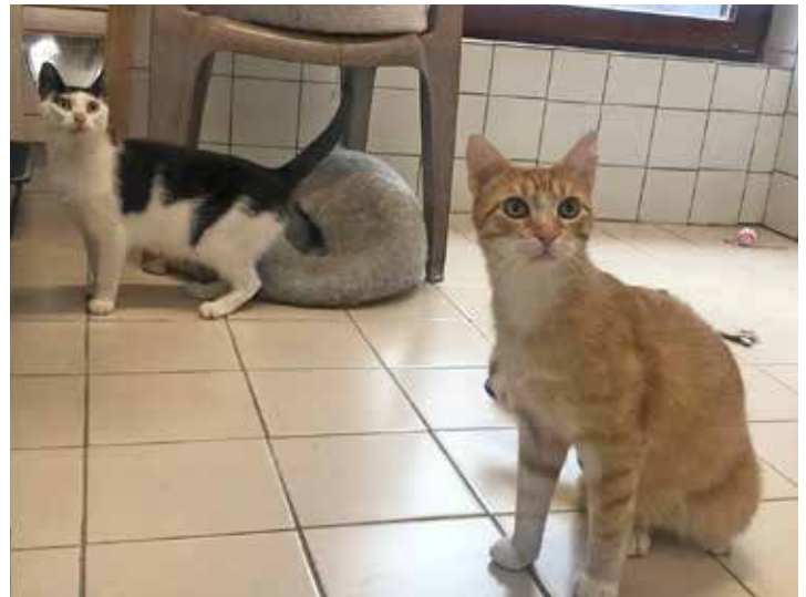
Fiete und Lucy sind zwei der elf Hofkatzen, die aktuell ein neues Zuhause suchen.

23823 Seekamp (bei Hutzfeld) • Eutiner Straße 21 Tel. 0 45 55 / 2 46 - Fax 0 45 55 / 71 40 86