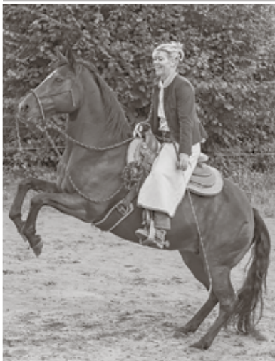
Sieversdorf, im Juni 2024

die für uns alle plötzlich und unerwartet im Alter von nur 51 Jahren verstorben ist.