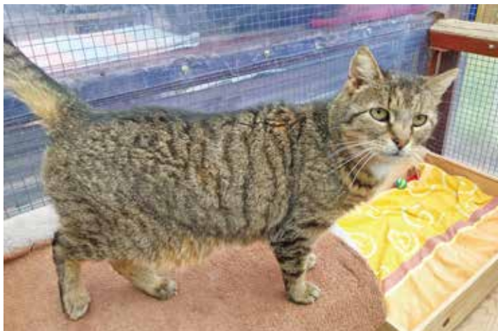
Gerne draußen unterwegs: Katzendame Buffy.

Wenn Sie einen Hof besitzen und ein oder zwei vierbeinige Gehilfen gebrauchen kön-