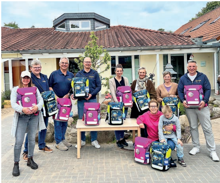
Fröhliche Gesichter gab es, als die Kiwanis-Delegation die Ranzen an die Kitaleitungen aus Ahrensbök und Gnissau übergab.

Entsprechend groß war die Freude, als die Kiwanier in der letzten Woche 14 Schulanfänger mit hochwertigen Schulranzen-Sets der Marke Felidae im Wert von insgesamt fast 3.500 Euro ausstatten konnten. Dieses Rundum-Schulranzenpaket beinhaltet einen ergonomischen Schulranzen, Sportbeutel, Brustbeutel, Brotdose, Schlamperetui und die dazugehörigen Schreibutensilien.