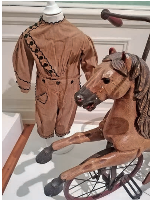
Passend: Skeleton Suit und Dreirad-Pferdchen.

der Kombination mit den Roben und Anzügen aber geschieht etwas Wunderbares: „Die Porträts werden uns nahegebracht“, meint Sophie Borges. Staunend steht man vor einem Säuglingskleidchen aus reiner Seide aus der Zeit von 1700 bis 1750, hinter einer aufwendigen Hofrobe für ein Mädchen mit bunten Blumen auf bronzefarbenen Grund hängt ein Porträt, auf dem die Prinzessin Louise von Dänemark in einem ganz ähnlichen Modell zu sehen ist. Nach dem Staunen kommen die Fragen, auch das ist ein Kennzeichen einer guten Schau: Was kann Kinderkleidung