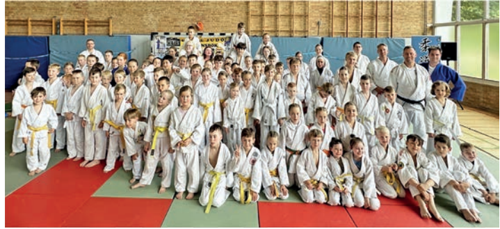
In Ahrensbök freut man sich über ein gelungenes Ranglistenturnier.