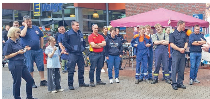
Gespannt warteten die Ehrenamtlichen auf den Verkaufsstart.

plare vorhanden. Als Raritäten gelten jedoch die Glitzervarianten, die es insgesamt pro Bild nur zweimal gibt. Und sein eigenes Foto als Glitzerversion zu