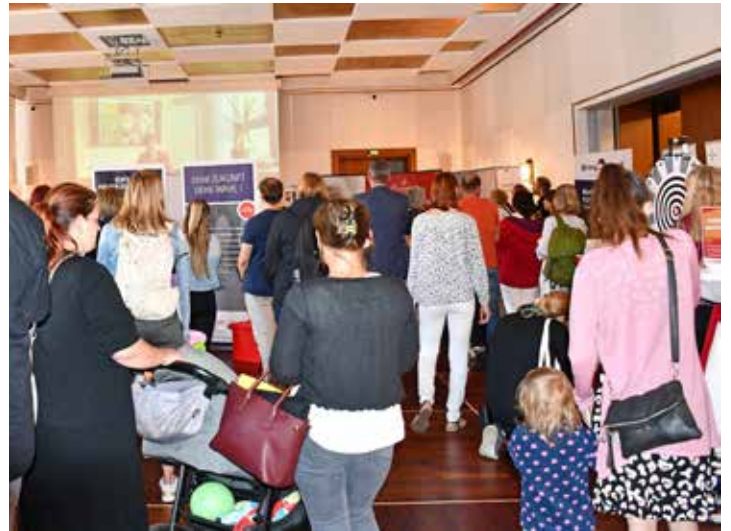
Auf der Messe erhalten Alleinerziehende wertvolle Tipps.

Eine besondere Neuerung in diesem Jahr ist der „Job-Turbo“: Die erste Stunde der Messe (10 bis 11 Uhr) ist speziell Geflüchteten gewidmet. Sprachmittlerinnen und Sprachmittler werden vor Ort sein, um bei sprachlichen Herausforderungen zu unterstützen. Das Frauennetzwerk zur Arbeitssituation e. V. und die Fortbildungsakademie der Wirtschaft (FAW) gGmbH stellen