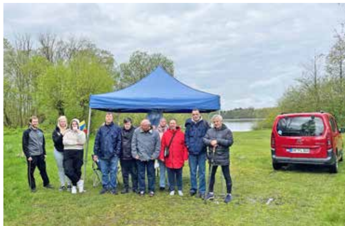
Am Sonnabend laden Die Ostholsteiner wieder zum Lauftreff ein.