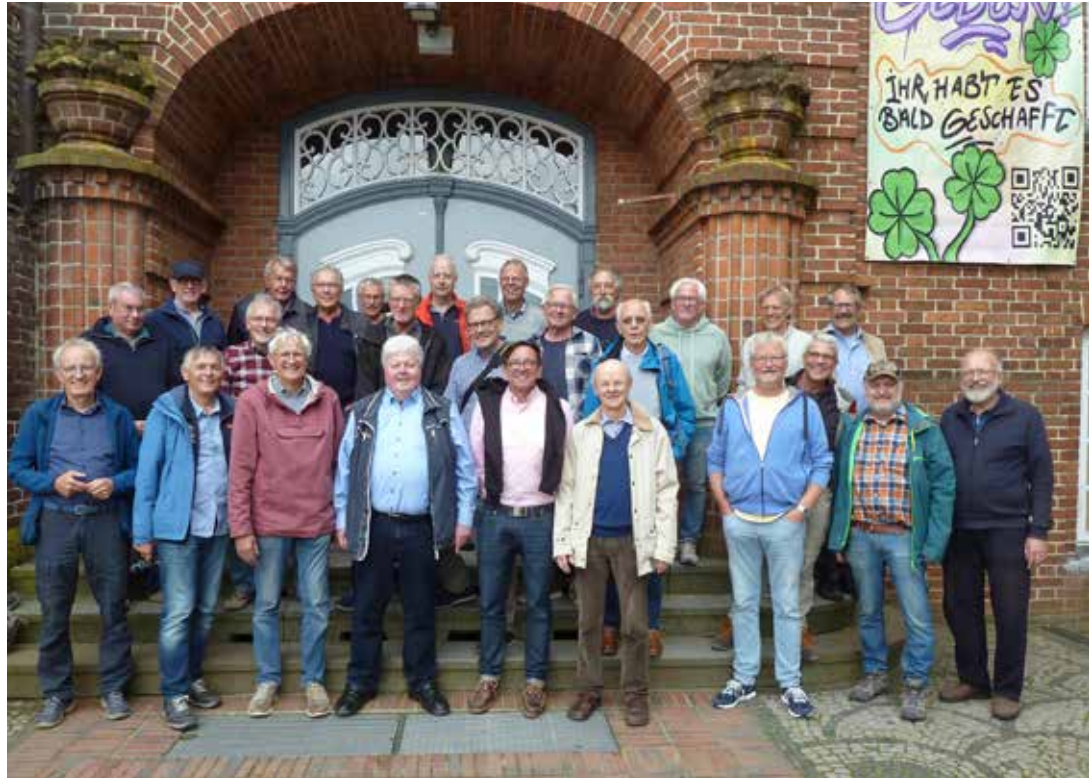
50 Jahre Abitur führten die 26 ehemaligen Voß-Schüler zurück an den Ort des Geschehens.

Zum ersten Mal stand ein Abschluss in der reformierten Oberstufe an. Darüber hinaus mussten alle Beteiligten erst ihre Erfahrungen mit dem sogenannten Kursystem machen. Es bestand unter anderem die Möglichkeit, Kurse im Bereich Ölmalerei in die Benotung einzustellen. Unliebsame Fächer konnten abgewählt werden. Diese Umstände haben die Absolventen nicht gehindert, in der Folgezeit ihren Weg zu gehen in