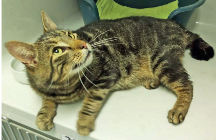
Wer vermisst diesen Kater?

Eutin (jo). In dieser Woche sind es zwei ausgesprochen nette Vierbeiner im Eutiner Tierheim, die auf Ihre Hilfe zählen. Schäferhund Senta ist circa fünf Jah-