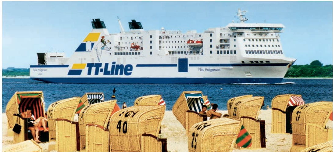
Unterwegs mit den Jumbo-Linern der TT-Line zum großen Jubiläum Kurs Schweden.

Die Einschiffung von Bus und Fahrgästen erfolgt in Travemünde auf Entdecker-Kurs Nord. An Bord werden die Leser mit schwedischen Schlemmer-Spezialitäten preisinklusive rundum verwöhnt und sie genießen die komfor-