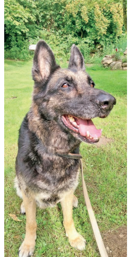
Schäferhündin Senta sucht eine tierliebende Familie.

Zum zweiten „Fell“: In der Dorfstraße in Sieversdorf ein Kater gefunden. Er ist kastriert, aber nicht gechipt. Auch er macht einen sehr netten und freundlichen Eindruck. Wahrscheinlich vermisst er aber bereits seine Familie und sein Zuhause. Der Stubentiger ist ziemlich groß und hat einen auffälligen schwarzen Streifen auf dem Rücken. Wenn Sie wissen, wem der nette Ka-