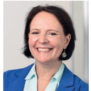
Christine Halisch

Die Trauerfeier findet im engsten Familien- und Freundeskreis statt.