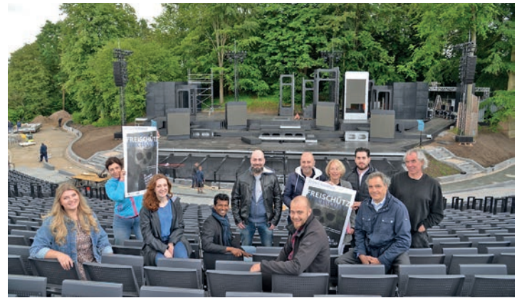
Es kann losgehen: Team „Freischütz“ ist bereit für die intensive Probenarbeit.