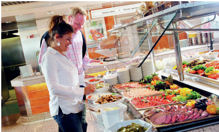
Auch kulinarisch werden die Reporter-Leser an Bord der Märchenschiffe auf dem Hin- und Rückweg rundum verwöhnt.

Anmeldungen sind ab sofort im Reporter-Leserreisen-Büro des Burg-Verlages in Eutin unter Telefon 04521-701130 (täglich von 9 bis 13 Uhr) sowie direkt online auf leserreisen.der-reporter.info möglich.