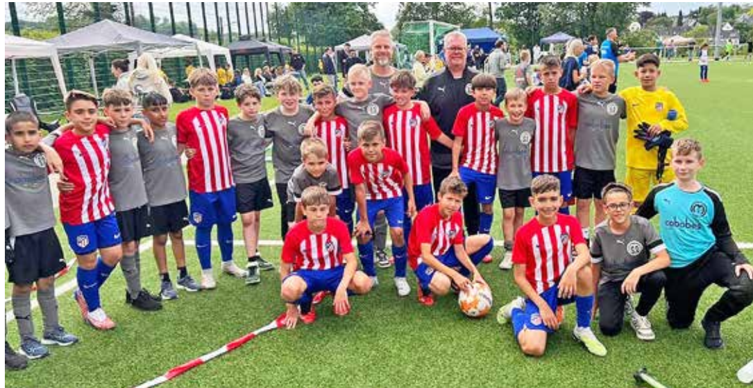
Eine schöne Erinnerung ist das Mannschaftsfoto der E-Jugend vom TSV Malente zusammen mit dem Turniersieger vom Pfingstcup der E-Jugend, Atletico Madrid.

Logisch, dass auch seine Jungs voll bei der Sache sind: „Für sie ist es natürlich auch ein tolles Ereignis und im eigenen Land noch etwas ganz Besonderes“, so Kretzer und erklärt: „Sie gehören zu den Jahrgängen 2013 und 2014, waren bei der WM 2006 ja noch gar nicht geboren.“ In jedem Training werden die Trikots der verschiedenen