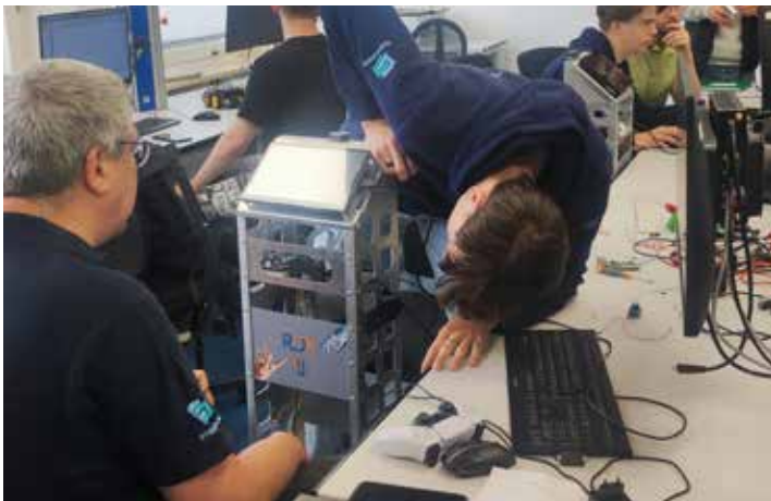
Letzte Vorbereitungen vor der Präsentation.