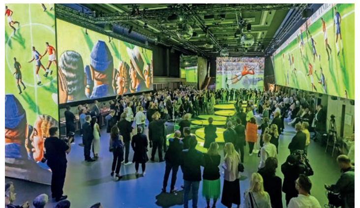
Die digitale Kunstschau „In Motion – Art & Football“ im Dortmunder Fußballmuseum ist ein raumgreifendes, multimediales Ereignis.