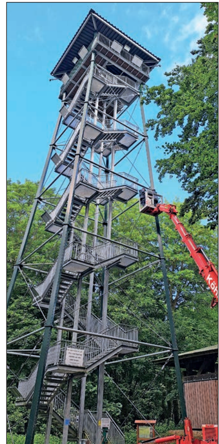
Gut gewartet: Der Holzbergturm.