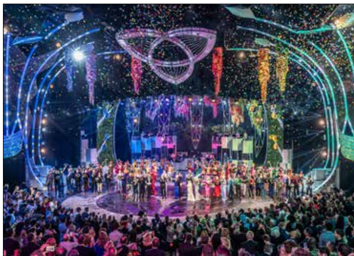
Weltklasse-Show like Las Vegas: Die Weltpremiere „Falling in Love“ begeistert das Publikum in Berlin.

das weltberühmte Barberini-Museum in Potsdam mit der gerade neu eröffneten, sensationellen Sonder-Ausstellung „Maurice de Vlaminck“ mit Leihgaben aus Museen in aller Welt und die große Impressionisten-Ausstellung