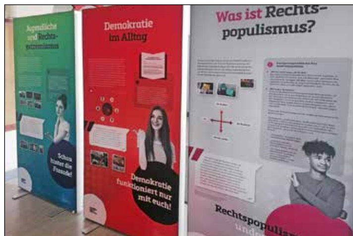
Eine Ausstellung informierte zum Thema Demokratie.

verschwunden war: „Ich würde mir wünschen, dass in der Schu-