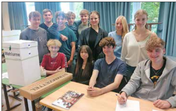
Die Klasse 10a hat die Juniorwahl engagiert und kenntnisreich vorbereitet.

Die Ergebnisse der Juniorwahl werden am Sonntag, 9. Juni, um 18 Uhr im Internet auf www.juniorwahl.de veröffentlicht. Bundesweit sind 5.600 Schulen mit über 1,5 Millionen Schüler*innen am Projekt beteiligt.