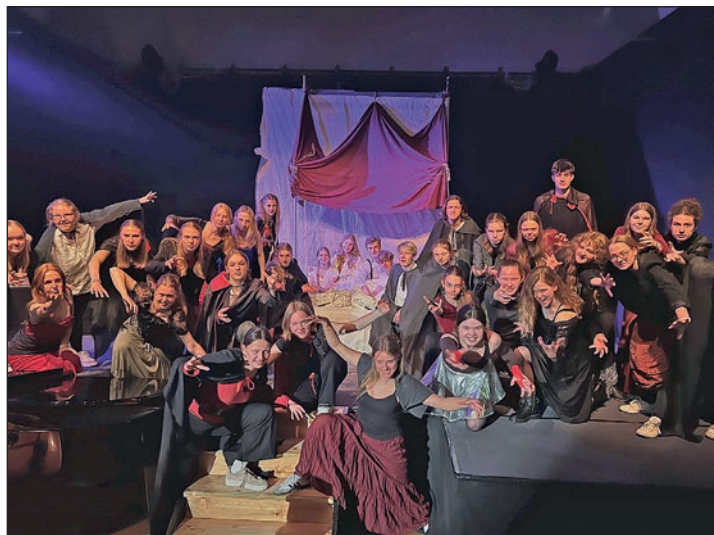
An der Voß-Schule spielt die Musik – oder besser: das Musical.