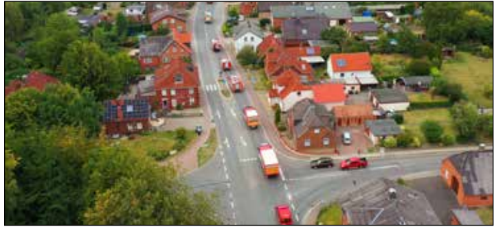
Nichts wie hin! Die Ahrensböcker Feuerwehr lädt zum Flohmarkt ein

Ahrensböck (aj). Am Sonntag, 16. Juni, wird es trubelig rund um das Feuerwehrgerätehaus in Ahrensböck. Die Blauröcke richten ihren Flohmarkt aus. Um 8 Uhr geht los und wenn die Taschen voll sind und der Magen leer, gibt es belegte Brötchen, Gegrilltes und Kaffee und Kuchen. Wer selbst et-