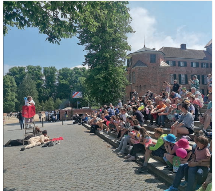
Verschiedene Gruppen traten auf der Bühne am Schloss auf.