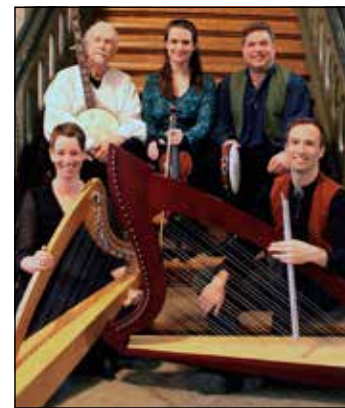
Das Ensemble Garden of Delights spielt im Jagdschlösschen.

Der Kartenpreis beträgt 22 Euro, der Kartenverkauf läuft über den Eutin Ticketshop in der Tourist-Info Eutin, Markt 19, unter Telefon 04521-709734 und die über die Malente Touristinformation, Bahnhofstraße 3, unter Telefon 04523-9842730. Ob Nympe oder Dame, die Art der Verführung bleibt die Gleiche! So süß der Morgengesang der zwitschernden Lerche auch sein mag, so beendet er doch meist jäh die romantische Zusammenkunft zwischen zwei Liebenden. Mit diesem Thema beschäftigt sich das Ensemble Garden of Delights, indem es sich in der englischen Musik des 17. und 18. Jahrhunderts mit Komponisten wie Purcell und Händel, sowie in keltischen Liedern und Instrumentalstücken aus Irland auf die Suche der Verführung der schönen Nymphen und reizenden Damen begibt und eine Verbindung zwischen diesen beiden findet. Der Bezug wird