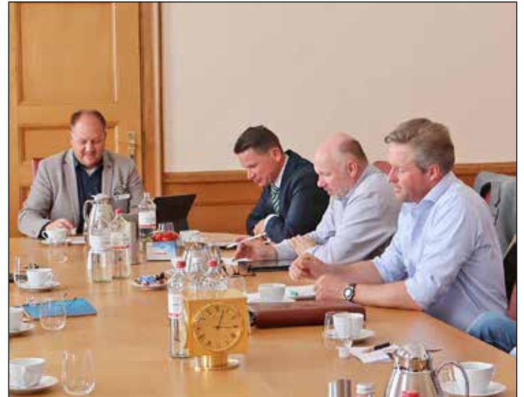
Ostseeschutz, Tierwohl und „Ostholstein blüht auf“ waren Themen beim Jahresgespräch des Kreisbauernverbandes im Kreishaus.

„Insbesondere die starke Präsenz unseres Landrates hier vor Ort