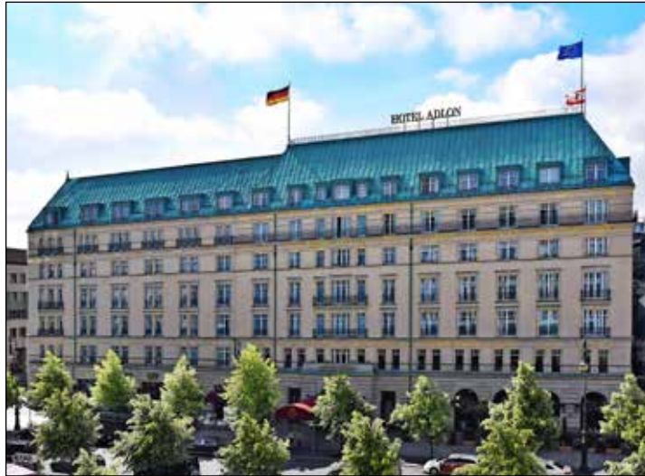
Das „berühmteste Hotel der Welt“ am Pariser Platz in Berlin können die Reporter-Leser im Oktober 2024 zum „Tag der Einheit“ ausführlich genießen.

Anmeldungen sind ab sofort möglich bei den Reporter-Leser-Reisen des Burg-Verlages in Eutin, täglich von 9 bis 13 Uhr unter Telefon 04521-7011-30 oder direkt im Internet online unter „ leserreisen.der-reporter.info “.