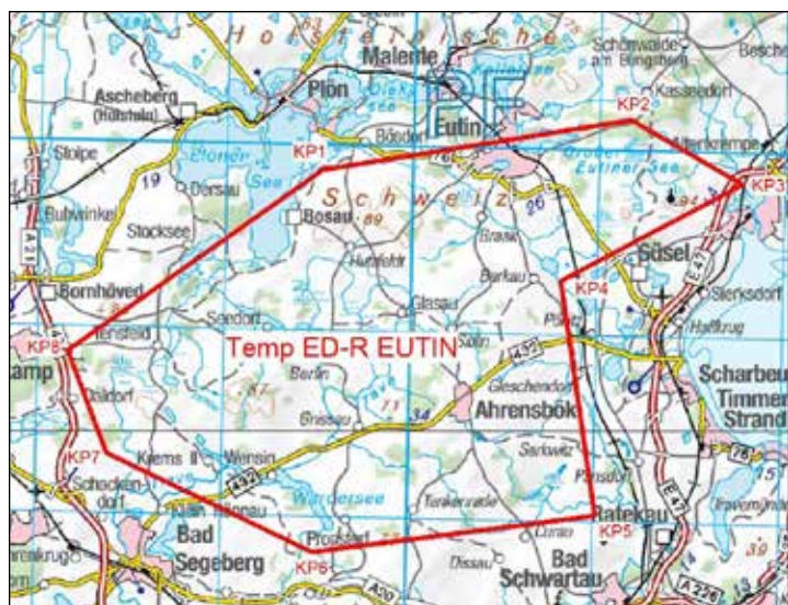
Diesen Bereich wird die Drohne der Bundeswehr überfliegen.

der Drohne findet mittels eines Fallschirms auf einem genehmigten Landeplatz statt. Details finden Interessierte auf der „Digitalen Plattform Unbemannte Luftfahrt“ online auf www.dipul.de .