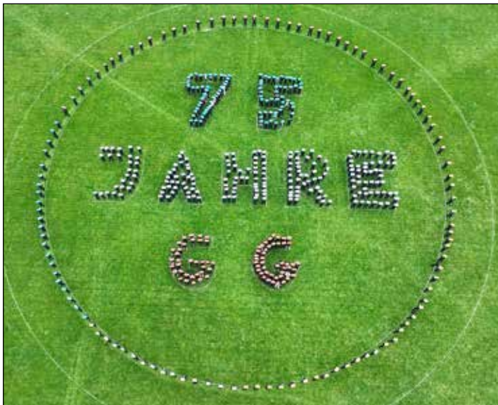
Mit einem Foto gratulieren Auszubildende und Bedienstete der PDAFB in Eutin dem Grundgesetz zum runden Geburtstag.