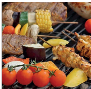
Ein reichhaltiges und leckeres Sommer-Grill-Buffer erwartet die Leser*innen an Bord.

12. August 2024. Die einmalige Bus- und Schiffs-Kombination direkt ab Eutin beinhaltet eine vierstündige Weser-Kreuzfahrt ab Bremen inklusive leckerem und reichhaltigen Grill-Buffer an Bord und dem anschließenden Besuch von Europas größten blühenden Heideflächen zum kompletten Sonderpreis von 89,90 Euro. Der Kurs führt die Gäste zunächst direkt ab Eutin ohne weitere Einsammeltour im erstklassigen Fernreisebus mit Waschraum/WC und Bordküche zur Einschiffung in die Bremer Innenstadt. Von dort startet die traumhafte