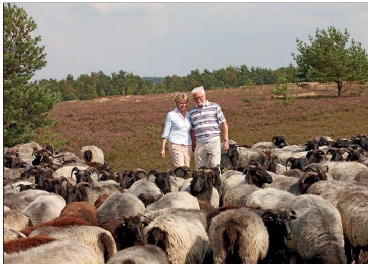
Zum Höhepunkt der blühenden Heide entdecken die Gäste die malerischen Landschaften in den schönsten Farben.

12. August 2024. Die einmalige Bus- und Schiffs-Kombination direkt ab Eutin beinhaltet eine vierstündige Weser-Kreuzfahrt ab Bremen inklusive leckerem und reichhaltigen Grill-Buffer an Bord und dem anschließenden Besuch von Europas größten blühenden Heideflächen zum kompletten Sonderpreis von 89,90 Euro. Der Kurs führt die Gäste zunächst direkt ab Eutin ohne weitere Einsammeltour im erstklassigen Fernreisebus mit Waschraum/WC und Bordküche zur Einschiffung in die Bremer Innenstadt. Von dort startet die traumhafte