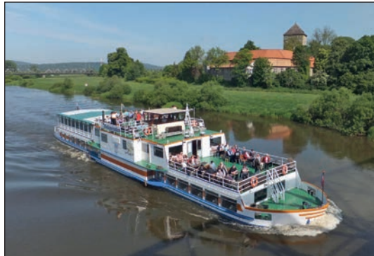
Mit dem Weser-Dampfer geht es ab Bremen mit großem Grill-Buffer an Bord Kurs Lüneburger Heide.

Anmeldungen für diese beson- dere Blüten- fahrt sind ab sofort bei den Reporter-Leser- Reisen des Burg-Verlages in Eutin täg- lich von 9 bis 13 Uhr unter Telefon 04521- 701130 oder direkt online auf leserreisen. der-reporter. info möglich.