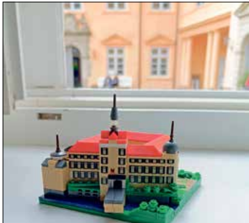
Schloss Eutin im Miniaturformat