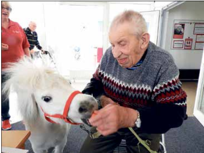
Daisy weckt Erinnerungen, zum Beispiel an ein Leben als Melker.

Halterin und Pony ein eingespieltes Team sind, erkennt auch, wer kein Pferdeprofi ist. Täglich sind die beiden unterwegs und ein herzlicher Empfang ist ihnen überall sicher. Die Menschen le-