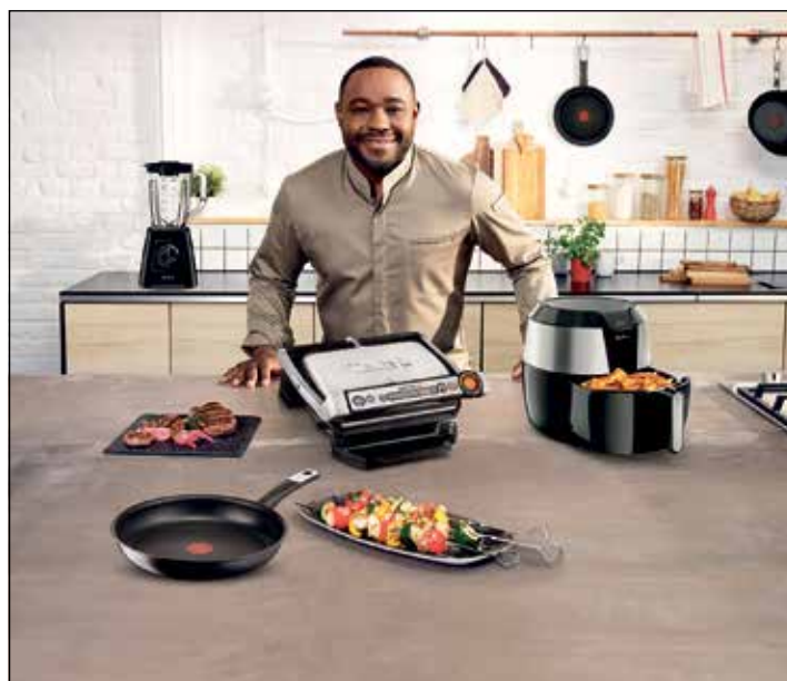
Nelson Müller ist Markenbotschafter von Tefal.

Eutin (t). Qualität und Technologie für großen Genuss: Die „Küchenhelden“ der Marke Tefal garantieren köstliche Kulinarik. Bei familia gibt es jetzt verschiedene Küchengeräte und Pfannen zum Vorteilspreis. Die neue Treueaktion mit Tefal startet am kommenden Montag, 27. Mai. Sterne- und TV-Koch Nelson Müller fungiert als Markenbotschafter für Tefal. Für ihn findet Heimatliebe auch im Essen Ausdruck. Mit hochwertigen Küchenhelfern wird die Zubereitung zum Kinderspiel. Multikocher, Heißluftfritteuse, Kontaktgrill, Pfannen – diese und weitere Prämien stehen in der neuen Treueaktion zur Wahl. Die Heißluftfritteuse beispielsweise gart, frittiert und brät mit wenig Fett. Die Pfannen mit Thermo-Spot sind für alle Herdarten geeignet. Der Thermo-Spot zeigt an, wann die Pfanne die optimale Brattemperatur erreicht hat. Mit Treuepunkten gibt es auf die ausgewählten Artikel bis zu 80 Prozent Rabatt.