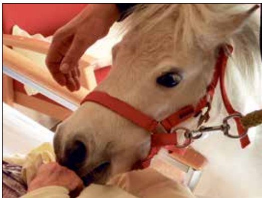
Sanft schnuppert das Pony an der Hand einer bettlägerigen Frau.