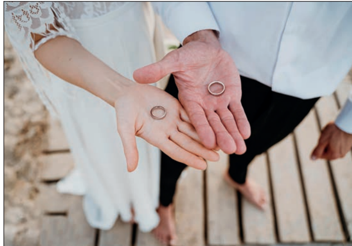
Paare, die sich trauen, finden in der Region den passenden Ort.

Das Ja-Wort soll in besonderem Ambiente stattfinden? Kein Problem, in Eutin und den umliegenden Orten gibt es verschiedene Locations für eine stimmungsvolle Trauung. Dem Standesamt Eutin stehen für standesamtliche Eheschließungen neben der Kapelle im Rathaus, das Trauzimmer in Schloss Eutin, das Jagdschlösschen in Sielbeck am Ukleisee