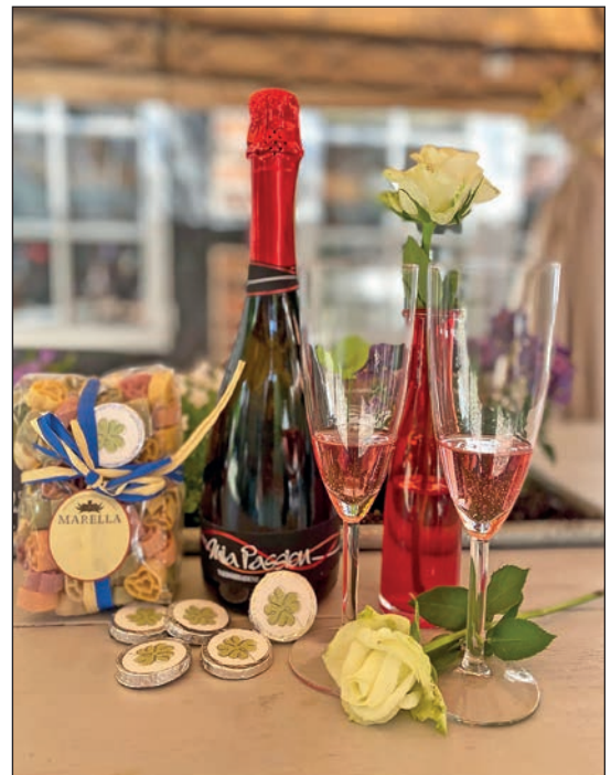
Anstoßen auf das Lebensglück: Das „Weingeist“ in Eutin bietet die Möglichkeit zum stimmungsvollen Sektempfang nach der Trauung – nur ein paar Schritte von Rathaus und Kirche entfernt.

Während die Gäste bei einem kleinen Sektempfang nach der Zeremonie das traumhafte Ambiente genießen