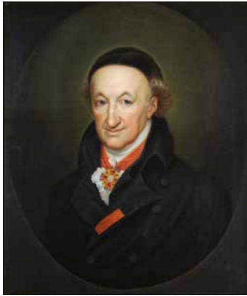
Wie der Porträtmaler Franz Gerhard von Kügelgen den Dichter sah: Wieland um 1810 in Öl auf Leinwand.