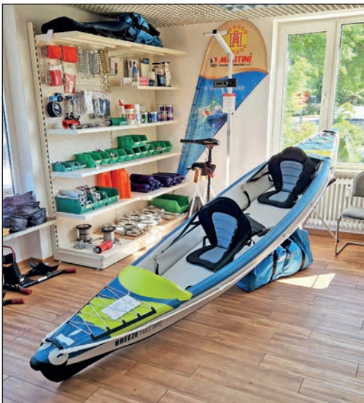
Im Ladengeschäft in der Sielbecker Landstraße 17 gibt es Wassersportartikel und Ersatzteile.