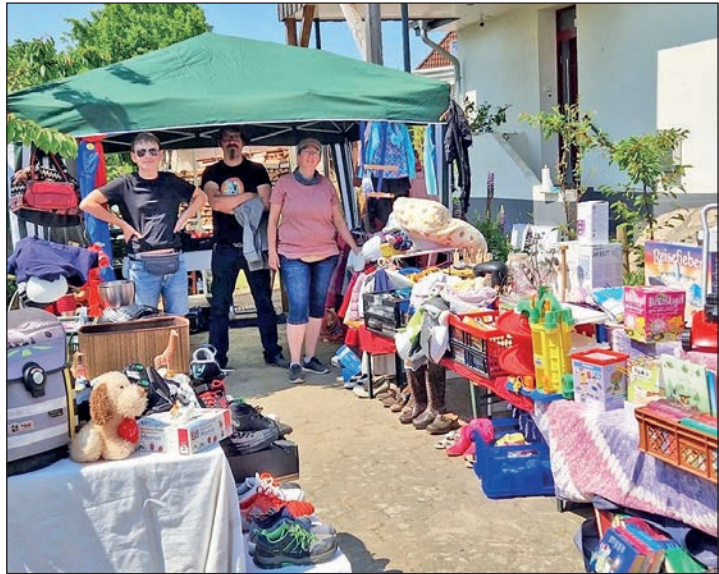
Der BSG Hofflohmmarkt lockt zur Schnäppchenjagd.