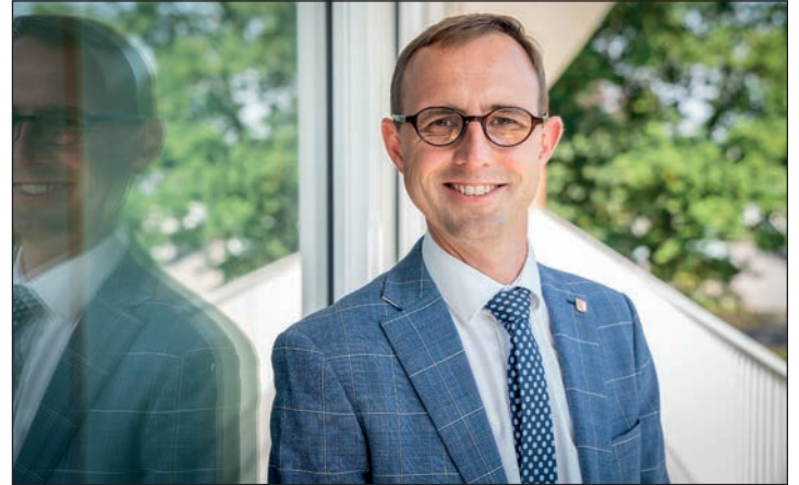
Digitalisierungsminister Dirk Schrödter kommt zum Bürgergespräch nach Eutin.

am Sonnabend, 25. Mai, gemeinsam eine Bürgersprechstunde auf dem Berliner Platz. Am digitalen Schulungsmobil stehen Minister Schrödter, Eutins Bürgermeister