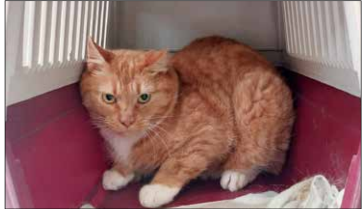
Berlios würde sich gerne in eine liebevolle Familie einfinden.

Diekstauen 5 • Eutin • Telefon 0 45 21 - 736 44