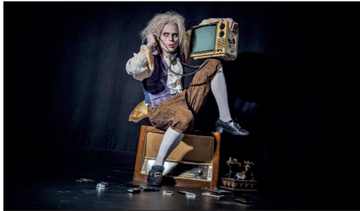
Mit dem Kulturbus geht es zum Kinderkonzert, bei dem Theatergeist Johann von Rasselstein mitwirkt.

Zusammen mit den Kids lauscht Johann den Ohrwürmern der Klassik und erkundet, aus welchen berühmten Orchesterstücken sie stammen. Das Konzert am Dienstag, 11. Juni, beginnt um 18 Uhr und dauert etwa eine Stunde. Für Familien mit Kindern kostet die komplette Aktion, also Konzert und Busfahrt, jeweils 11 Euro, Erwachsene zahlen 16,70 Euro. Die Busabfahrt in Eutin am Schlossplatz erfolgt um 16 Uhr. Anmeldungen bitte bis zum 31. Mai bei der Kreismusikschule unter Telefon 04521-788550.