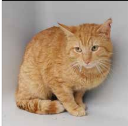
Mäusejäger gesucht? Dieser Kater ist ihr Mann.

Eutin (jo). In dieser Woche sind gleich zwei topfitte Kater im Eutiner Tierheim, die nur darauf warten bei liebevollen Tierfreunden einziehen zu können. Einer der beiden wurde vor einiger Zeit in Neustadt gefunden. Leider meldete sich niemand, der den jungen Kater vermisst. Deshalb will er nun einen neuen Start wagen in einem schönen, ländlich gelegenen Haus mit der Möglichkeit auf sehr viel Auslauf und ein paar Mäusen zum Jagen in der näheren Umgebung. Am besten sollten keine anderen Kater in der Nachbarschaft wohnen, da es mit dem vierjährigen Jungspund zu Konflikten kommen könnte. Ein Kuschkater, der abends zum Schmusen auf die Couch springt, wird aus ihm zwar eher nicht mehr, aber er schließt tierliche