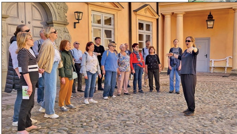
Begeistert war der Chor von der klangvollen Akustik im Eutiner Schlosshof.