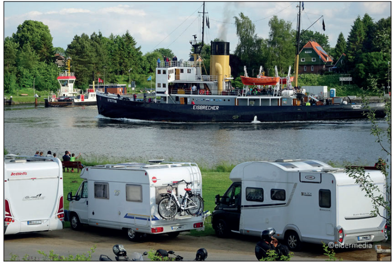
Unter Reporter-Flagge unterwegs auf großer Volldampf-Kreuzfahrt sind unsere Leser mit der „MS Stettin.“

nem zünftigen Bord-Frühstück für alle Leser. Der Kurs der fünfständigen Erlebnis-Kreuzfahrt führt mit vielen fachkundigen Erklärungen und Besichtigungen der Schiffs-Technik und der Brücke an Bord nach Kiel. Mit voller Kraft und kräftigem schwarzen Kohlen-Dampf geht es auf Kurs Landeshauptstadt, wo unsere Leser am Nachmittag noch zwei Stunden in der Hafenstadt zur freien Verfügung genießen können (bei Termin 1 mit Top-Erlebnis Kieler Woche). Dann geht es mit dem Reporter-Bus zurück in die Heimatorte. Alle Leistungen inklusive der kompletten Bus-Transfers ab Eutin sind ab sofort buchbar zum Sonderpreis von nur 89,90 Euro.