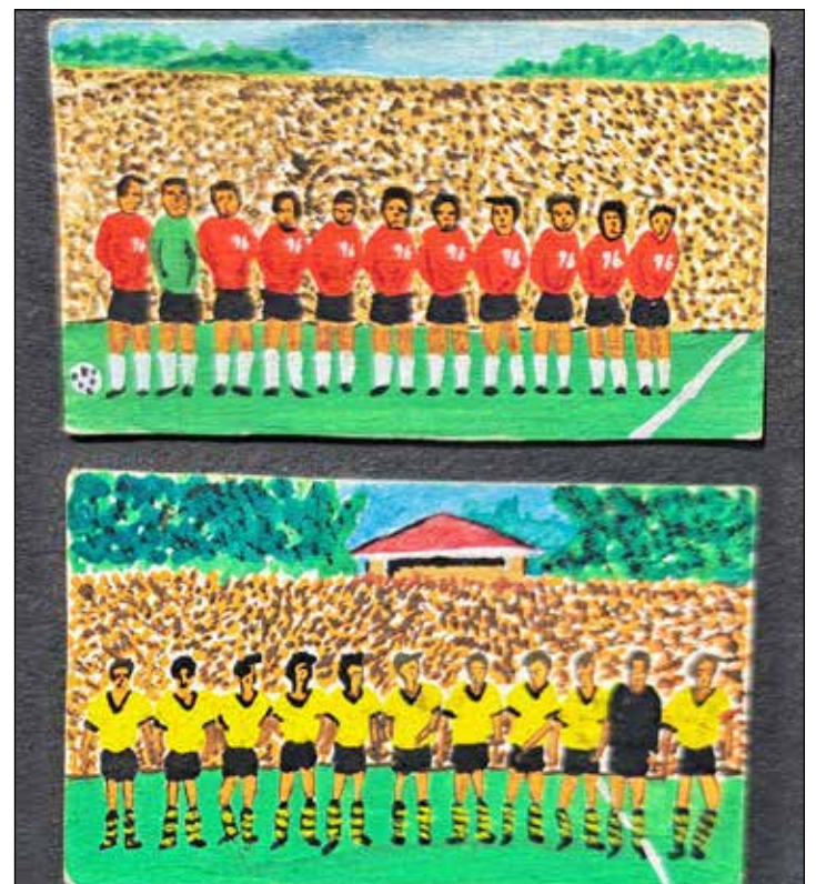
Mit diesen Miniatur-Bildchen der Bundesliga-Mannschaften fing 1963 alles an.

Wer sich selbst davon einen Eindruck verschaffen möchte, sollte die multimediale Ausstellung in Dortmund besuchen. Sie ist bis zum 7. Januar geöffnet. Mehr dazu online auf www.fussballmuseum.de/inmotion