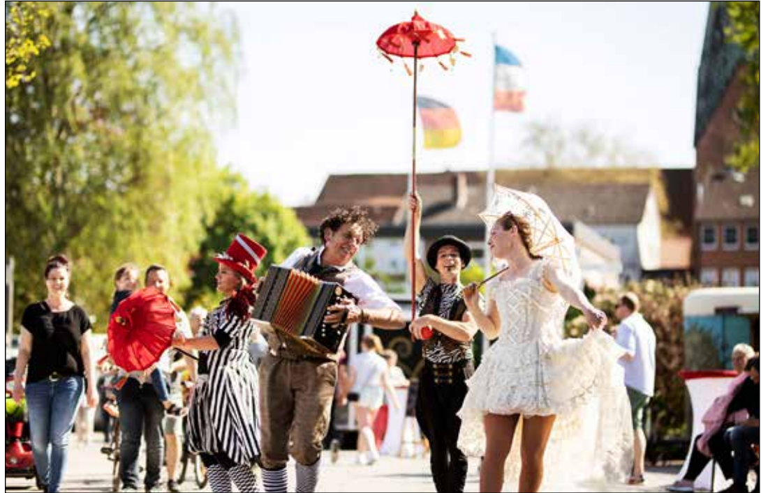
Ein inspirierendes Gesamtpaket erwartet die Besucher*innen an der Stadtbucht.

„Wir freuen uns, dass wir das kulinarische Angebot auch in diesem Jahr wieder ausweiten konnten. So können die Besucher*innen