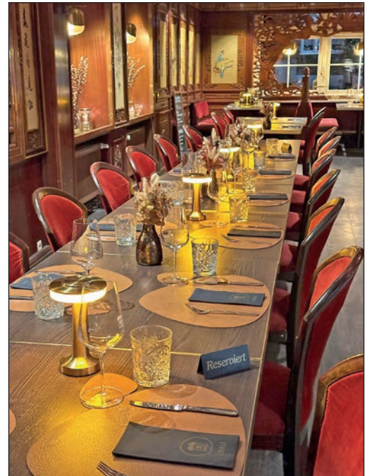
...und heute – auch die Einrichtung ist original kantonesisch.

Gemeinsam machen sie sich daran, ihre Vorstellung von einem modernen traditionsbewussten China-Restaurant zu verwirkli-