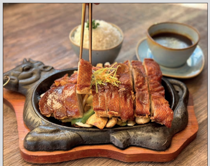
Hausgeröstete halbe Ente mit buntem Gemüse auf der heißen Platte serviert

knusprig. Nach dieser traditionellen Methode bleibt das Fleisch schön zart und richtig saftig. Wahlweise gibt es das Gericht in Süß-sauer oder mit herzhafter dunkler Soße. Die Enten benötigen drei Tage vom Marinieren bis zum perfekten Röstungsgrad in der hauseigenen Herstellung.