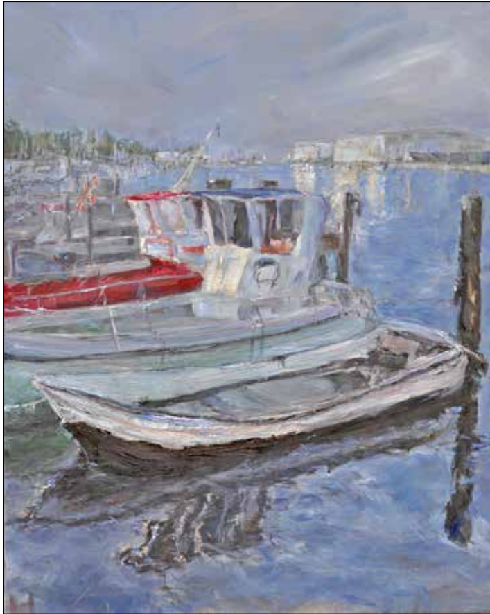
Fischerboote, Öl auf Leinwand, 2023

Karen Davids Motive gründen vor allem auf Eindrücke aus zahlreichen Aufenthalten im Norden Deutschlands sowie in Dänemark. Gerade diese Region mit ihren sanft schwingenden Küstenlinien, dem hohen Himmel über dem weiten Meer übt einen besonderen Zauber