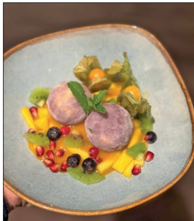
Mango Maracuja Mochi Eis mit Mangopüree und frischem Obst

Treiben. Keine Frage, die Gäste haben den Generationswechsel mitgemacht. Obwohl oder weil ihnen die junge Generation viel Neues zugetraut hat: „Wir haben die Menschen mitgenommen, viel am Tisch