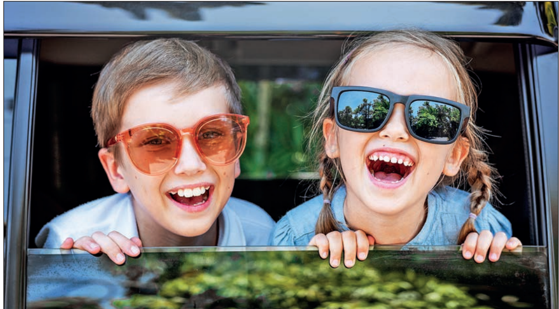
Entspannt unterwegs statt Hektik pur – das erhöht auch die Sicherheit.

Ostholstein (t). Nach der Schule schnell die Hausaufgaben erledigen, dann weiter zum Sportverein, in den Schwimmkurs, zum Jazzdance oder in die Musikschule: Das Programm vieler Kinder und Jugendlicher weist oftmals nur wenige Lücken im alltäglichen Kalender auf. Der sich für die Eltern ergebende Dispositionsaufwand – gerade auch bei mehreren Kindern – ist enorm. Wer muss wann wo sein? Geht es zu Fuß, mit dem Rad, Bus oder Bahn? Oder braucht es doch das Auto? Und wenn ja, wie können eventuell Mitfahrgelegenheiten organisiert werden? „Bei diesem Stress bleibt leider viel zu oft die Sicherheit auf der Strecke“, konstatiert Markus Egelhaaf, Unfallforscher bei DEKRA.