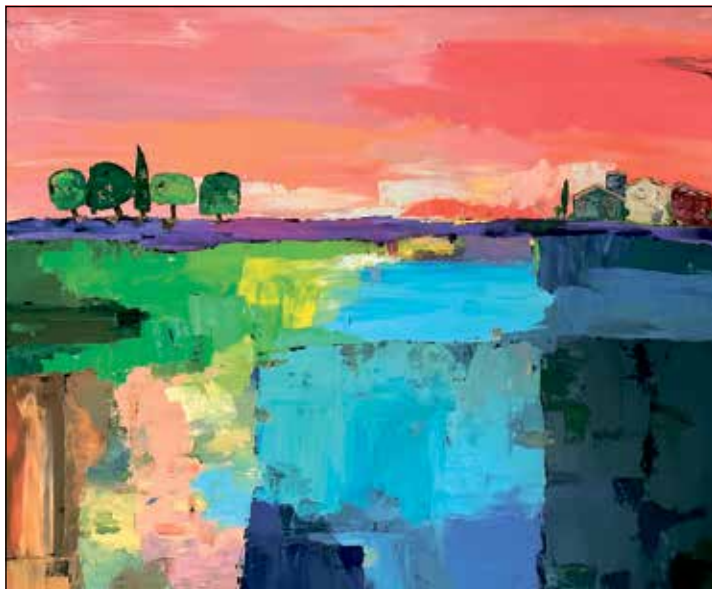
Unter anderem ist in der Bosauer Kate Acrylmalerei von Kristin Jurkschat zu sehen.

21. Jahrhundert gibt es großartige romantische und dramatische Filmmusik. Oft werden die Töne im Zusammenhang von Science-Fiction-Filmen benutzt. Am 12. Mai wird unter anderem Musik von „Harry Potter“ und „Game of Thrones“ im Konzert zu hören sein. Nach der Filmmusik folgen Melodien aus Computerspielen, von denen einige schon in den 1980er-Jahren oder früher komponiert wurden. Durch die Vielfalt der zu erwartenden Musik sollten sich alle Generationen angesprochen fühlen. Der Eintritt zum Konzert ist frei, am Ausgang wird um eine Spende gebeten.