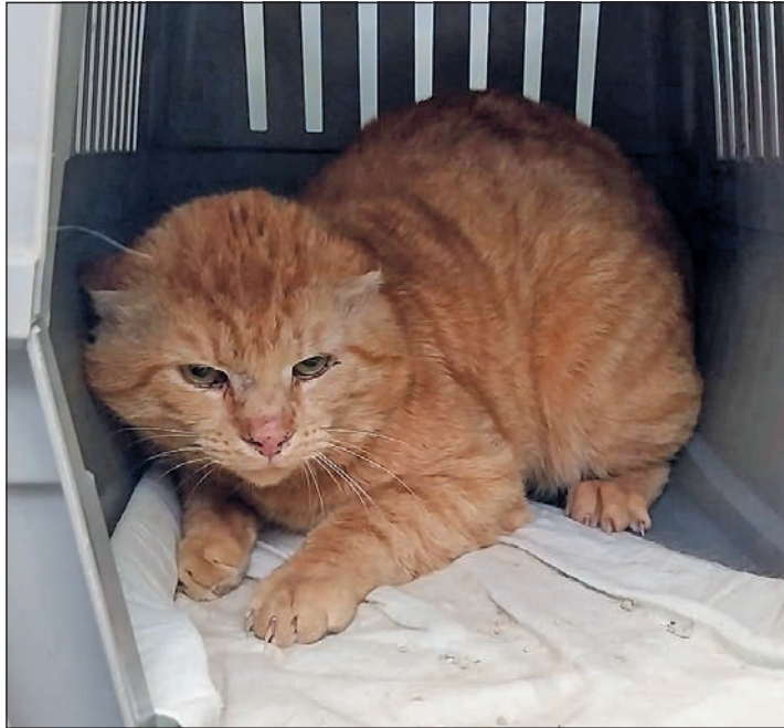
Hat seinen eigenen Kopf: Kater Sancho.

Auch Kater Sancho hofft auf eine freundliche Familie, die ihm ein schönes Heim bietet. Sancho möchte gerne auf einem ländlich gelegenen Hof oder großem