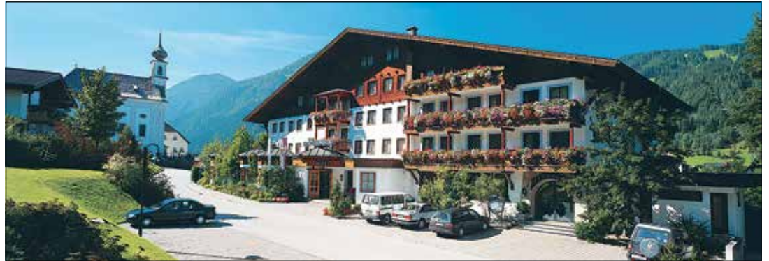
In bester Ortslage erwartet der „Forellenhof“ unsere Leser*innen im Salzburger Land in Flachau.

Eutin (t). Einen komfortablen Sommerurlaub für zehn Tage zum Superpreis präsentieren die Reporter-Leser-Reisen zum Top-Sommer-Termin vom 23. Juni bis 2. Juli 2024 im erstklassigen Verwöhn-Hotel „Forellenhof“ in Flachau mit großem Hallenbad und Wellnessabteilung. Eine der schönsten Hotelanlagen im Salzburger Land mit eigenem Forellenteich erwartet die Gäste zum Schnupperpreis von nur 995 Euro. Die weithin gelobte Küchenbrigade verwöhnt die