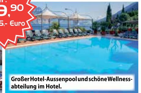
Großer Hotel-Aussenpool und schöne Wellness-Abteilung im Hotel.