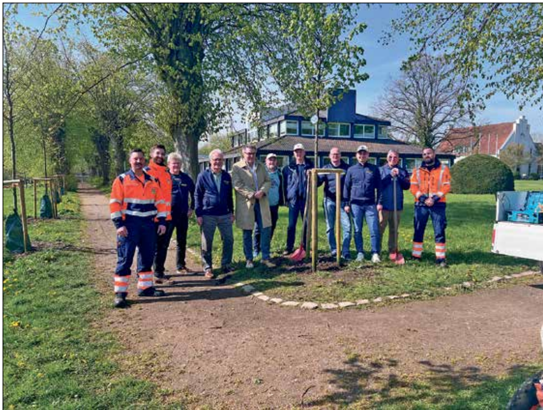
Gemeinsam angepackt: Der Kiwanis Club spendete die Bäume und pflanzte mit den Mitarbeitern vom Baubetriebshof.

Stützpfähle geben den jungen Bäumen Stabilität. seine Dankbarkeit für die „Baumpaten“ aus, die die Kosten für die Bäume übernommen haben, und lobte das Engagement der Spender: „Dieses Engagement kommt