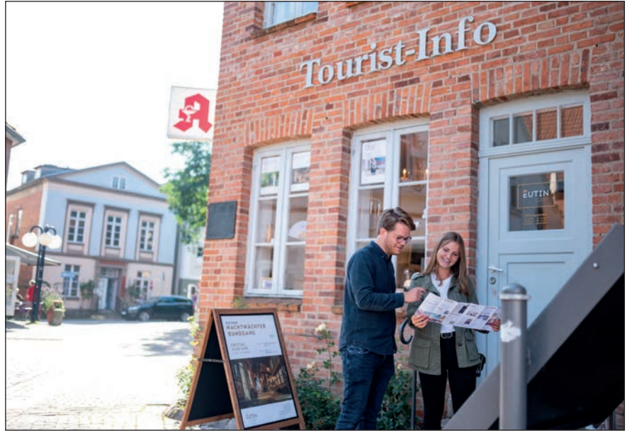
Die Tourist-Info am Markt 19 ist Ausgangspunkt für zahlreiche verschiedene Führungen.

Eine neue Themenführung wird am Freitag, 10. Mai, um 14.30 Uhr unter dem Titel „Jüdische Führung auf dem Eutiner Friedhof“ angeboten. Dabei begibt sich der Historiker Dietrich Mau mit Interessierten auf die Spuren jüdischer Geschichte in Eutin. Der jüdische Friedhof liegt am Kleinen Eutiner See, ein wenig versteckt und umsäumt von Bü-