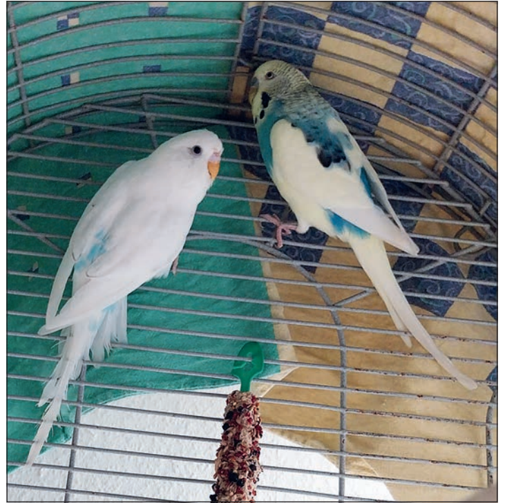
Bisher ohne Glück: Ellie und Carl konnten noch nicht vermittelt werden.

Diekstauen 5 • Eutin • Telefon 0 45 21 - 736 44