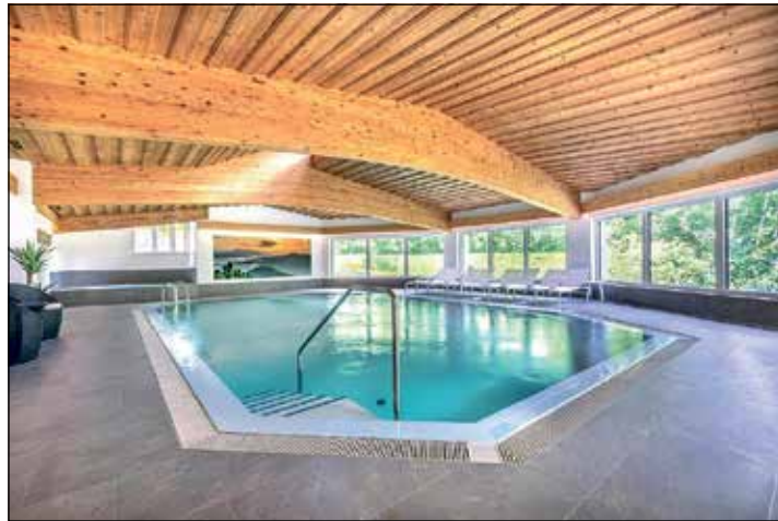
Herrlich relaxen und entspannen können die Gäste im großen Hallenbad und in der schönen Wellnessabteilung.

Urlauber vom sehr großzügigen Sekt-Frühstücksbuffet mit vielen regionalen Spezialitäten bis hin zu den abendlichen Schlemmermenüs (mit Menüwahl) und stets frischen Salatbuffets oder reichhaltigen Bauern-Bufferfs. Die komfortablen Hotelzimmer bieten zudem ein sehr großzügiges Wohnerlebnis; WLAN ist gratis im gesamten Hotel. Im sonnigen Hochtal von Flachau erwartet die Reisenden zum Top-Hochsaison-Termin ein Traumhotel direkt in bester Ortslage mit liebe-