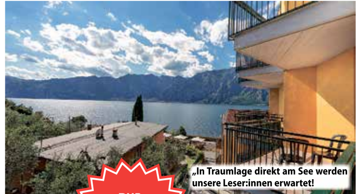
„In Traumlage direkt am See werden unsere Leser:innen erwartet!“