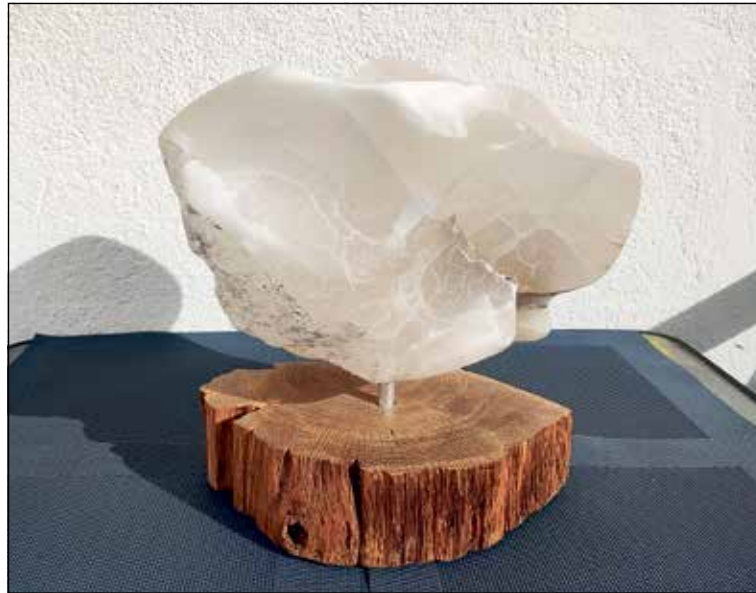
Diese Skulptur von Rüdiger Meinhard heißt „Licht im Stein“.

und Kultur des Kreises Ostholstein zu fördern und zu unterstützen. Er sagte, die Ausstellung der 100 Werke im Kreishaus und in der Kreisbibliothek Eutin eröffne Möglichkeiten für Besucher und Besucherinnen, aber auch für Mitarbeiterinnen und Mitarbei-