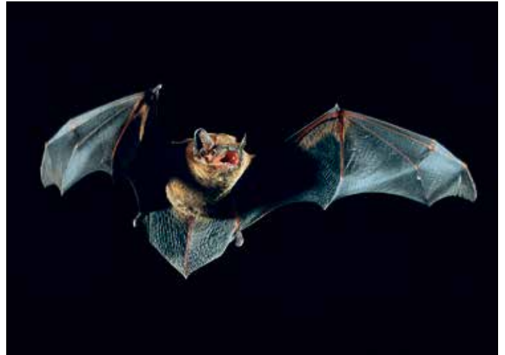
Der Große Abendsegler zählt zu den größeren Fledermausarten, die in der Region Holsteinische Schweiz heimisch sind.

Plön (t/los). Der Verein Naturpark Holsteinische Schweiz lädt zur nächsten Fledermaus-Safari ein. Die Veranstaltung findet am Freitag, 10. Mai in Plön statt. Treffpunkt ist die Schlossterrasse um 20.30 Uhr. Für die Teilnahme ist eine Anmeldung erforderlich, die wochentags telefonisch unter 04521 - 77 56 540 beim Natur-