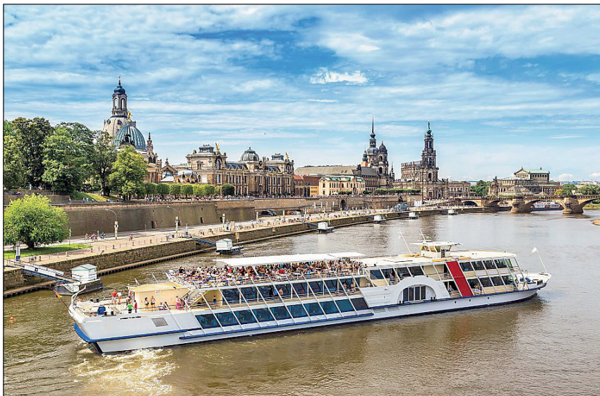
Elbflorenz im Sommer-Kleid: Das weltberühmte Dresden erkunden unsere Gäste beim großen Tagesausflug mit viel Freizeit.

ve-Getränken zum Abendessen (Biere/Weine/Softdrinks). Außerdem ist die kostenlose Nutzung der Wellness-Abteilung im Hotel inklusive. Zum großen Ausflugsprogramm gehören ein großer Sommer-Ausflug im Spreewald mit Gelegenheit zur Kahnfahrt mit dem stakenden Fährmann sowie der große Panorama-Ausflug ins sommerliche Elb-Florenz mit vier Stunden Freizeit (Aufpreis 15 Euro pro Person) Die Rückreise erfolgt mit Mittagspause in der Bundeshauptstadt Berlin am Potsdamer Platz, die Kurtaxe ist vor Ort im Hotel zu zahlen.