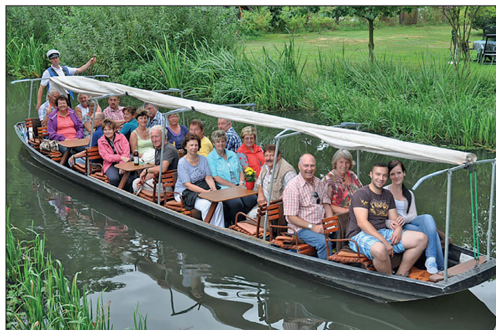
Unterwegs im Spreewald mit dem stakenden Fährmann sind unsere Leser:innen im Juli 2024.