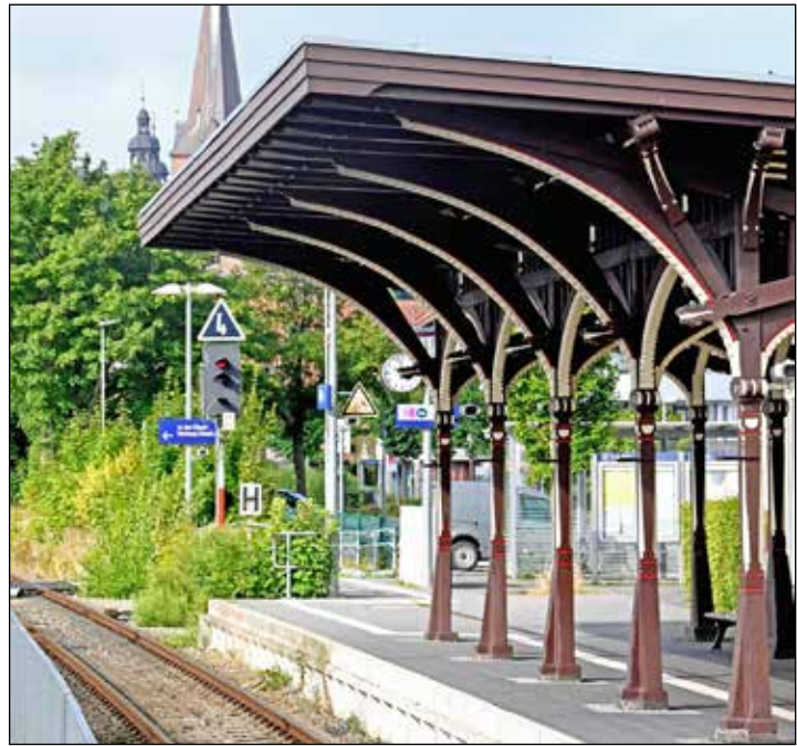
Das Vordach des Plöner Bahnhofs stammt vom Bahnhof Holsteinische Schweiz in Krummsee.

Kein Wunder also, dass auch die Hohenzollern das Plöner Ensemble mit der Ex-Residenz schick fanden, die auf so komode Art