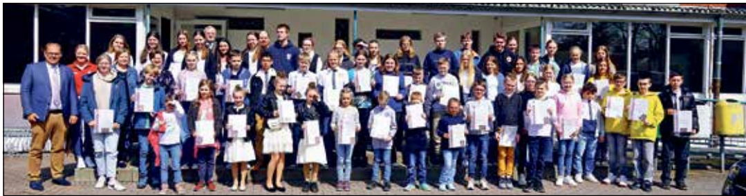
Insgesamt wurden 91 junge Sportlerinnen und Sportler für ihre herausragenden Leistungen im Jahr 2023 ausgezeichnet.