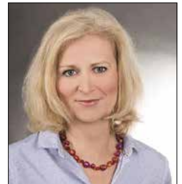
Bärbel Adam.

Eutin (t). In dem interaktiven Vortrag „Dem Stress auf die Spur kommen“, den die Volkshochschule (VHS) Eutin am Sonnabend, 25. Mai, von 10 bis 12.15 Uhr an-