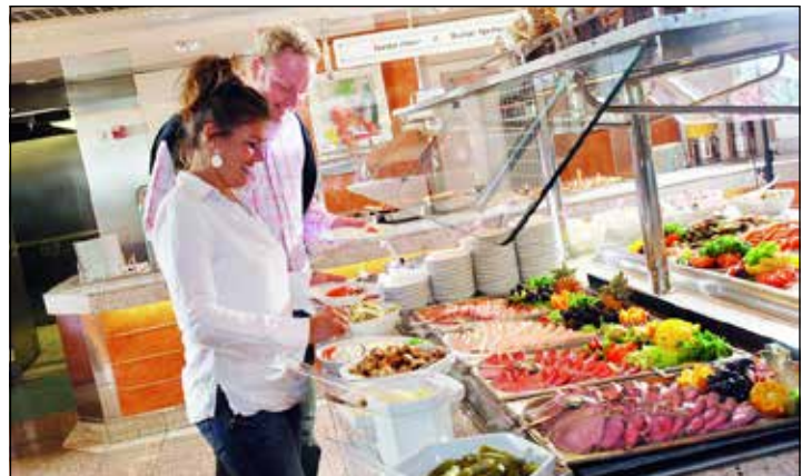
Auch kulinarisch werden die reporter-Leser an Bord der Märchenschiffe auf dem Hin- und Rückweg rundum verwöhnt.

Benz: 10.50 bis 11.10 Uhr Kindergarten, Hauptstraße 2; Neukirchen: 11.25 bis 11.45 Uhr Kirche; Malente: 13 bis 13.20 Uhr Kindergarten Johanniter, Godenbergstraße 1; 13.25 bis 13.45 Uhr AWO-Kinderhaus, Kellereistraße 22; 13.55 bis 14.20 Uhr Kindergarten, Janusallee 5; Timmendorf: 14.30 bis 15 Uhr Dorfstraße 22; Kreuzfeld: 15.15 bis 15.30 Uhr Bushaltestelle, Dorfstraße 3; Löja: 15.50 bis 16.10 Uhr Löjaer Berg 44; Hutzfeld: 16.20 bis 16.35 Uhr Hauptstraße 46; Hassendorf: 16.40 bis 17 Uhr Dorfstraße 10; Majenfelde: 17.05 bis 17.20 Uhr Majenfelder Landstraße 10; 17.25 bis 17.40 Uhr Bushaltestelle