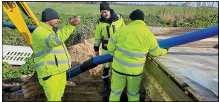
Monteure der Gemeindewerke Malente arbeiten an der neuen Löschwasserleitung für Drögendiek.

Montag, 8. April, gesperrt. Das bedeutet, dass dieser für die Öffentlichkeit nicht nutzbar ist. Die Arbeiten werden voraussichtlich eine Woche dauern.