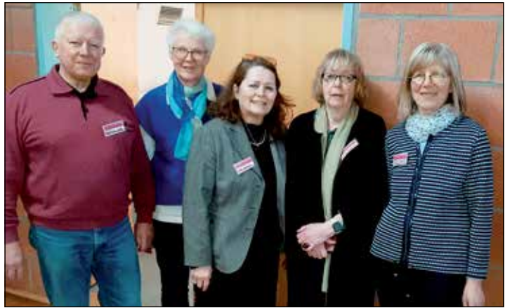
Voller Tatendrang und guter Ideen: Der Ahrensböcker Seniorenbeirat.

Ausflüge, Vorträge, gesellige Treffen geben sollte: „Und das wird 2024 jetzt vom Seniorenbeirat Ahrensbök umgesetzt“, heißt es vom energiegeladenen Vorstand. Das nächste Frühstück ist bereits in Planung, ebenso wie andere Aktionen. Die Ehrenamtlichen bedanken sich für die Unterstützung der Gemeinde Ahrensbök und bei allen anderen, die ihnen den Rücken stärken.