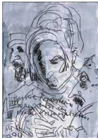
„Unsere Reporterin war schon in vielen Krisengebieten“ ist der Titel des Bildes von Armin Mueller-Stahl.