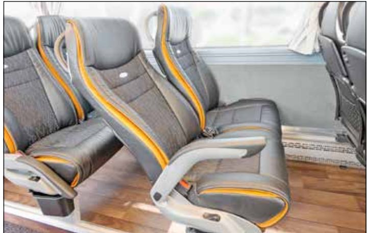
Eine elegante und komplett neuzeitliche Innenausstattung mit modernstem Sitz-Komfort erwartet unsere Leser:innen an Bord des Busses.

aus der Region findet man auf diesem einen News-Portal. Und dazu noch alle Nachrichten aus Deutschland und der Welt. Denn der Burg-Verlag ist Teil der Mediengruppe IPPEN.MEDIA. Entsprechend vielfältig ist die Themenauswahl – sie reicht von aktuellen News aus der Region über Neuigkeiten aus Politik, Sport, Wirtschaft und Showbiz bis hin zu exklusiven Service- und Ratgeberthemen. Auf nordish.news kann sich jeder seinen persönlichen Newsfeed zusammenstellen und dann auf Smartphone, Tablet oder am PC nutzen. Für den Probemonat erhebt der Verlag eine Gebühr von einem Euro. Danach beträgt die Gebühr 5 Euro je Monat, also 60 Euro im Jahr. Das Abo ist jederzeit kündbar.