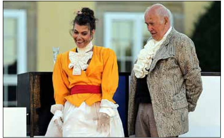
Geistreiche Unterhaltung bietet das Theater Poetenpack aus Potsdam.

Eutin (t). Das Theater Poetenpack Potsdam ist am Sonnabend, 13. April, um 20 Uhr im Eutiner Binchen-Kino, Albert-Mahlstedt-Straße 2, zu Gast. Auf Einladung des Kulturbundes Eutin bringt es „Das Spiel von Liebe und Zufall“, Komödie von Pierre Carlet de Marivaux, auf die Bühne. Der französische Romancier und