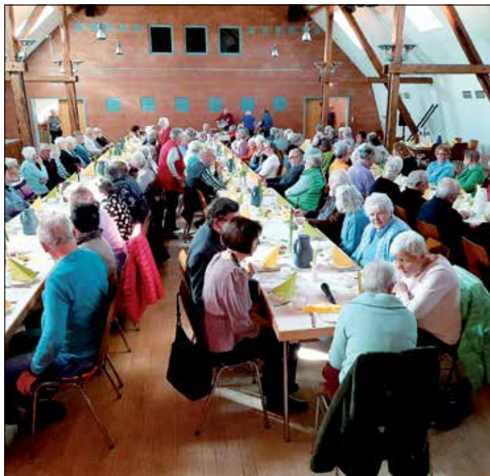
Festlich gedeckt war die Tafel im Bürgerhaus.