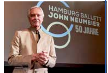
Moderiert seine Jubiläums-Gala höchstpersönlich: John Neumeier

● Leistungen: ● Fahrt im erstklassigen Fernreisebus direkt ab Eutin ● 2 x Fahrpassagen Vogelfluglinie mit SCANDLINES mit den Großfähren ● 1 x Übern. im TIVOLI-First-Class-Hotel mit gr. Schlemmer-Frühstück vom Buffet ● Exklusive Tivoli-King-Komfort-Zi. mit DU/WC, TV, Minibar, Klimaanlage, kostenloses Kaffee & Tee-Maschine, kostenloses WLAN etc. ● Eintrittskarte zur Ballett-Gala am Samstag Abend „The World of John Neumeier“ (Höherwertige Karten gegen Aufpreis buchbar!) ● Eintrittskarte für den weltberühmten Tivoli-Vergnügungspark ● Gr. Stadtrundfahrt in Kopenhagen mit fachkundiger Reiseleitung ● Viel Freizeit zum Stadt- & Shopping-Bummel am verkaufsoffenen Sonntag zu Pfingsten bis 15 Uhr ● Dänische Strassengebühren & City-Tax