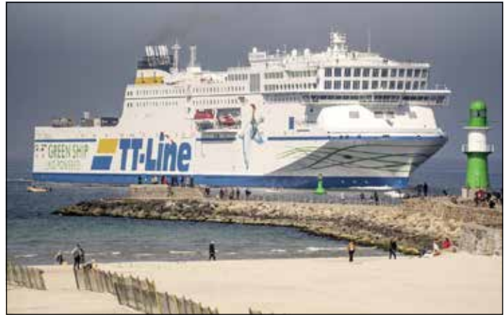
Unterwegs mit den Jumbo-Linern der TT-Line zum großen Jubiläum Kurs Schweden.

Zum großen Leistungspaket zum absoluten Jubiläums-Knüllerpreis „60 Jahre TT-Line“ von nur 225