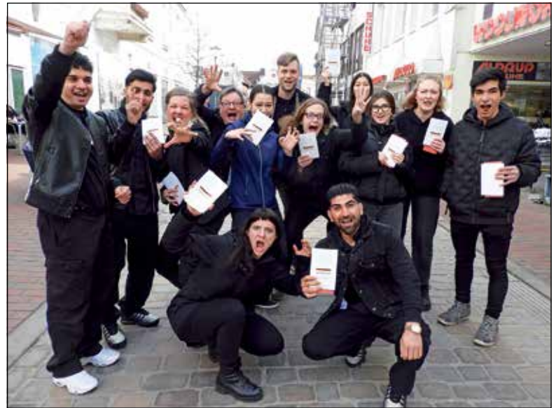
In zwei Tagen ist aus den Teilnehmenden am Workshop eine echte Theatergruppe geworden.

Sicherheit der Gruppe hilft ihnen nun, sich in der Öffentlichkeit zu Wort zu melden: „Es ist schon eine kleine Überwindung, aber