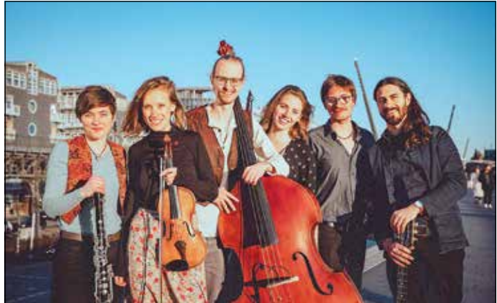
Ein Trio der Vagabund Klezmer Band wird in der Schlosskirche musizieren.