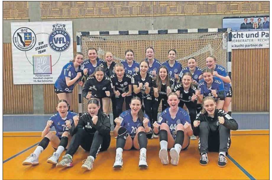
Dieses tolle Team ist zum Sanix-Cup nach Japan eingeladen und bittet um Spenden für die Flugkosten.