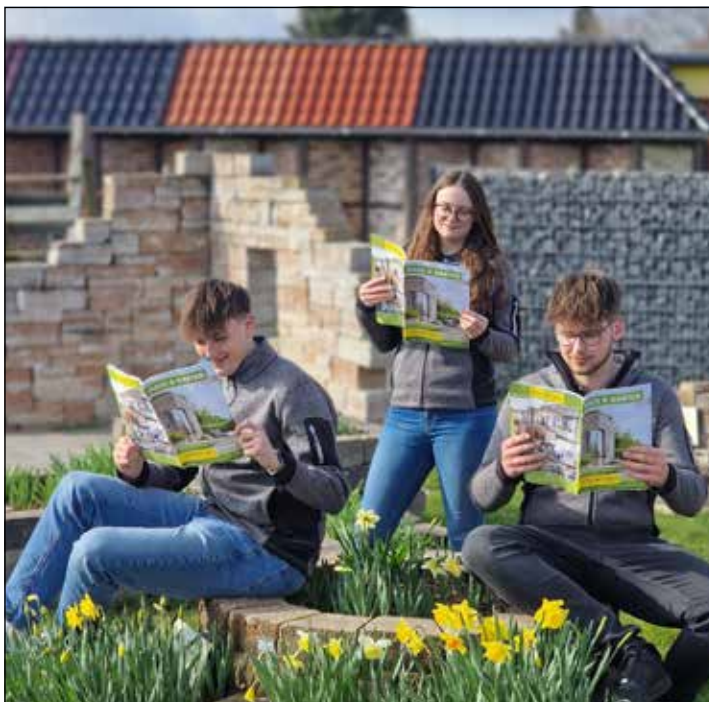
Auch die Azubis haben sich ihr Exemplar gesichert.

Eutin (t). Das Gartenjahr steht vor der Tür und mit ihm kommt der neue Bremer Haus- und Gartenkatalog mit frischen Ideen