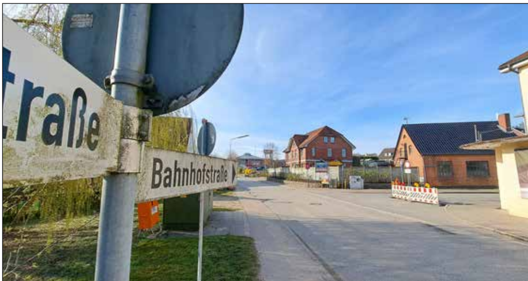
Hier wird während der Osterferien kein Verkehr rollen.

Bad Malente-Gremsmühlen (t). Ab Dienstag, 2. April, bis Freitag, 19. April, wird die Baustelle in der Bahnhofstraße im Kreuzungsbereich Neversfelder Straße durch eine Vollsperrung bei Autofahrern für längere Wege sorgen. Die Verwaltung hat für die Tiefbauarbeiten den Zeitraum der Osterferien gewählt, um die Reisezeit als Bauzeit zu nutzen. Die Bürger*innen sollen durch den gewählten Zeitraum mit geringerem Berufsverkehr in den Schulferien möglichst wenig in ihrer Mobilität eingeschränkt werden. Fest steht allerdings auch, dass sich weiträumige Umfahrungen nicht vermeiden lassen. Die Umleitung führt während der Bauphase über die L174 östlich um den Kellersee über Eutin-Fissau, Sielbeck und Krummsee sowie großräumig über die B76 und B430. Fußgänger*innen und Radfahrer*innen können den