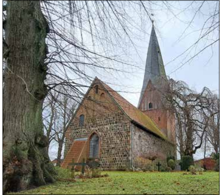
Die St. Clarenkirche zu Blekendorf