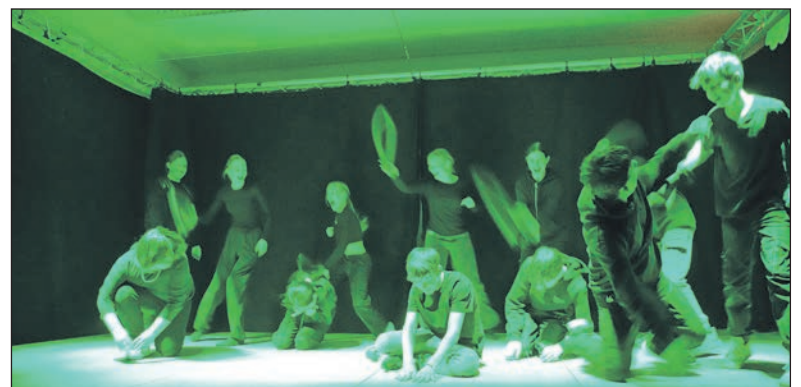
Der Missbrauch von Waffen

zurück. Die Gruppe zeigte auch den Missbrauch von Waffen, und wie dieser zu Hungersnot, Krieg und Hass führt. Am Ende des Stückes stellen sich alle Kinder mit