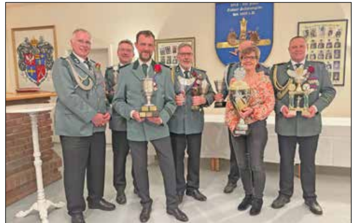
Die strahlenden Sieger und die Siegerin des Winterschießens.

Eutin (t). Der Kreis Ostholstein sucht ab sofort mit einem Ideenwettbewerb smarte IoT-Lösungen für den Alltag zum Selberbauen und Selbermachen. Teilnehmen können Vereine, Initiativen, Schulen, Bürgerinnen und Bürger, die in Ostholstein aktiv sind. Teilnahmeschluss ist der 15. Juli 2024. Das „Internet der Dinge“ (IoT) ist längst Teil des Alltags geworden –