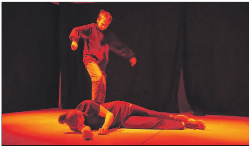
Gewalt war ebenfalls ein Thema

dem Hungerstuch, das sie zusammen hielten, auf die Bühne. Daraufhin nannten sie ihre Sorgen und Gefühle im Bezug zum Krieg: „Frieden bedeutet das Gegenteil von Krieg, Liebe, Meinungsfreiheit und kein Verlust, zu leben ohne sich sorgen zu machen und so zu sein, wie man möchte“ sagten sie. Und alle Kinder und Leute im Raum teilten diese Meinung. Das Theaterstück war eine Zusammenarbeit der Schule und der Evangelischen Jugend