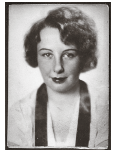
Irmgard Keun war 1936 nach Belgien geflüchtet, wo sie sich dem Kreis exilierter Schriftsteller anschloss.