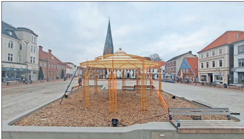
Aktuell steht der Rosenpavillon an der Stelle des Denkmals.