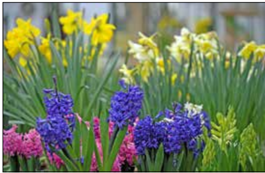
Die große Auswahl der schönen Frühlingsboten macht Lust aufs Pflanzen.

in die Pflanzsaison bereits die Vielfalt an Zwiebel- und Knollenblumen im Programm, mediterrane Kübelpflanzen wie Citrus- und Olivenbäumchen sowie Kräuter, Blühstauden und Gehölze, dazu Zubehör und Erden. Wer jetzt Farbe in die Kästen und Beete bringen möchte, kann aus dem Vollen schöpfen: 80.000 Stiefmütterchen und 20.000 Primeln warten auf ein neues Plätz-