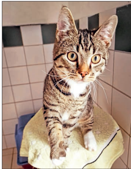
Ein niedlicher Wildfang ist Kater Socke.

mehrere Zähne fehlen. Mittlerweile konnten wir aber feststellen, dass er noch kein alter Herr, sondern er im mittleren Alter ist. Aufgrund der fehlenden Zähne wird er nicht als reiner Hofkater vermittelt, sondern unbedingt mit Zugang zum Haus. Freigangsmöglichkeiten würde er nach einer angemessenen Eingewöhnungsphase aber dennoch schätzen. Der freundliche Kater ist sehr zutraulich und verschmust, er lässt sich streicheln, kuscheln und zeigt seine Freude darüber mit liebevollem Schnurren.