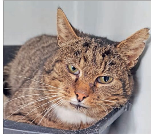
Janosch kam als Fundkater und sucht eine Familie.

Diekstauen 5 • Eutin • Telefon 0 45 21 - 736 44