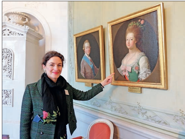
Anlässlich des Frauentages haben Frauen am 10. März freien Eintritt ins Schloss.

Eutin (t). Am Sonntag, 10. März, feiert Schloss Eutin den Internationalen Frauentag nach: mit freiem Eintritt für Frauen und Führungen zu mächtigen Frauen der Schlossgeschichte. Der Internationale Frauentag am 8. März fällt dieses Jahr auf einen Freitag und somit auf einen Werktag. Schloss Eutin feiert den Internationalen Frauentag daher bewusst nach: So kann das Schloss möglichst viele Frauen zu freiem Eintritt einladen und an der Führung „Groß & Stark. Eine Begegnung mit den mächtigen Frauen im Schloss Eutin“ teilnehmen lassen. Die Führung findet um 11 Uhr, 13 Uhr und 15 Uhr statt. Eine Führungsgebühr von 4 Euro wird für alle Gäste erhoben. Der Internationale Frauentag dient seit seinem Start 1908 unter Anderem der politischen Sicht-