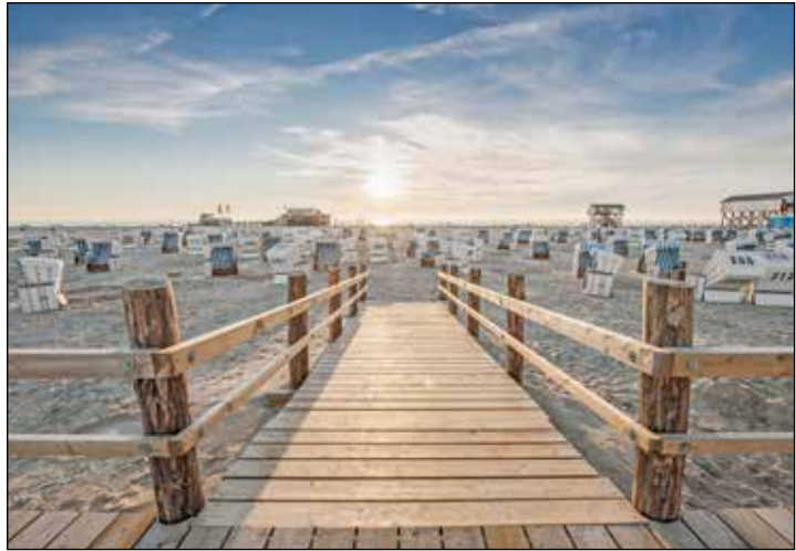
Rauschende Nordseewellen und endlose Sonnenstrände zum Genießen: St. Peter-Ording erwartet unsere Leser*innen zu Ostern.

Kunsthandwerker- und Eiderstedter Bauermarkt. Dort gibt es viele österliche Spezialitäten und kulinarische Angebote. Bereits auf der Anreise werden die Leser*innen direkt an der Eider im berühmten Fährhaus zum Mittagessen mit einem leckeren Dithmarscher Schlemmer-Bufferet mit kulinarischem Gaumenkitzel mit warmen und kalten regionalen Dithmarscher Spezialitäten verwöhnt und bestens