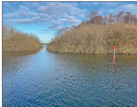
Entlang der Schwentine gibt es für Kanuten jetzt neue Wegweiser, hier am Auslauf des Mühlensees bei Plön.

Toppzeichen auf Pfählen in Fließrichtung rechts zur Kennzeichnung der Zu- und Ausläufe der Seen in die Schwentine gesetzt.