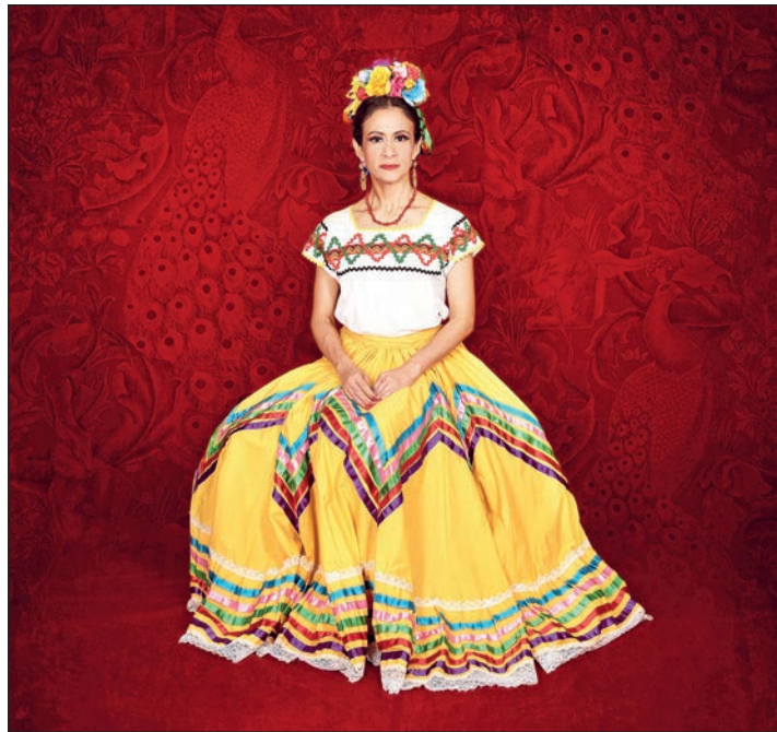
Die Porträtfotos von Ellen Schmauss zeigen Frauen in traditionellen Gewändern ihrer Herkunftsländer.

Mit einem respektvollen Augenmerk auf Frauen widmet sich die Fotoausstellung der Freiburger Fotografin Ellen Schmauss der bunten Vielfalt der Gesellschaft. „Weltenfrauen“ zeigt Porträts von Frauen in traditionellen Gewändern ihrer Herkunftsländer. Die würdevollen Porträts werfen Licht auf die Diversität der sich wandelnden Gesellschaft