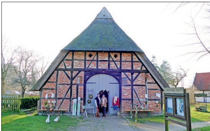
Der Frühling hat sich eingestellt in der Dunkerschen Kate.