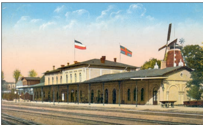
Der Eutiner Bahnhof auf einem Foto aus dem Jahr 1919.

aber auch wie sich die Vernetzung und wirtschaftliche Nutzung des Kreises Ostholstein vom 19. bis in das 21. Jahrhundert entwickelt hat und entwickeln wird. Ebenso einbezogen werden ausgewählte Projekte, die sich mit der Neu- und Umnutzung alter, stillgelegter Trassen in Ostholstein selbst und in umliegenden Kreisen wie Plön und Stormarn beschäftigen. Die Ausstellung läuft bis zum 22. Juni. Der Eintritt zur Ausstellung und zur Einführung von Bibliotheksleiter Prof. Dr. Axel E. Walter im Seminarraum der Eutiner Landesbibliothek ist frei.