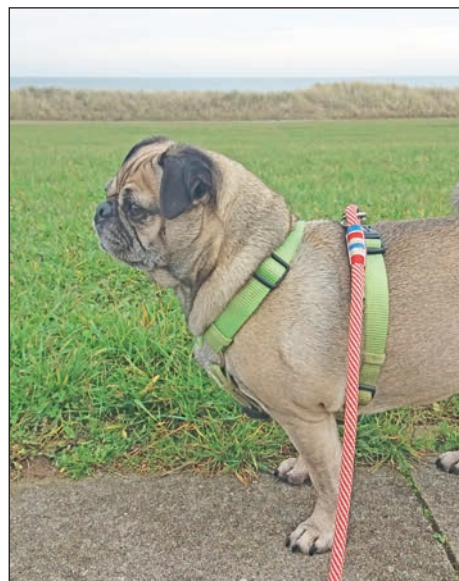
Peggy macht es vor: Hunde gehören grundsätzlich an die Leine.

Gebiete, da sie ihre Brut und auch die Aufzucht der Kleinen als zu gefährlich einschätzen. Angesichts der steigenden Zahlen von Hunden in der Landschaft gibt es für einige Vogelarten, bereits erhebliche Auswirkungen. Das gilt nicht nur für Nester mit Eiern, sondern auch für Jungvögel. Gerade Vögel, die nur eine Jahresbrut machen, wie beispielsweise Nachtigall, Sprosser, Fitis oder der oben erwähnte Waldlaubsänger, sind darauf angewiesen, dass diese möglichst erfolgreich verläuft – andernfalls verschwinden sie für immer. Auch Jungtiere von Rehen oder auch Hasen werden erheblich gestresst. Ein Hund nutzt seine Möglichkeiten, auch dann, wenn sein*e Besitzer*in ihn für harmlos hält. Nicht zuletzt sind Hundehalter*innen, die ihren