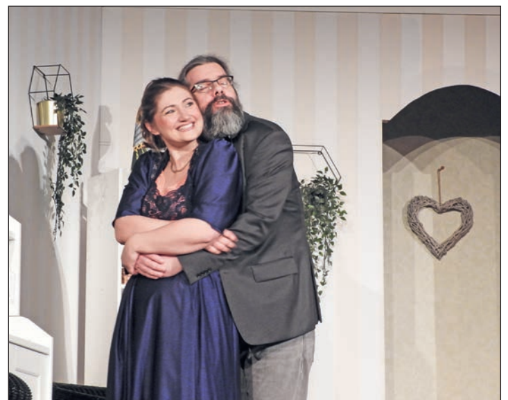
Monique hat ihre beiden Männer im Griff...