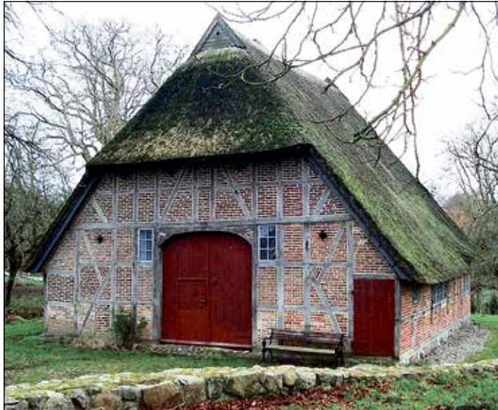
In der Wisser-Kate steigt wieder der bunte Ostermarkt.

können sie sich von den aktuellen Trends inspirieren lassen. Das Angebot von handgefertigten Produkten umfasst natürliche Eier von der Wachtel bis zum Strauß, handbemalte Ostereier