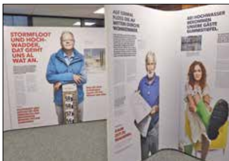
Die Ausstellungstafeln erzählen persönliche Geschichten und geben Tipps zum Thema Hochwasser.

Die Ausstellung präsentiert zehn persönliche Hochwasser-Geschichten aus unterschiedlichen Perspektiven. Neben Erfahrungen im Einsatz von Technischem Hilfswerk und Feuerwehr werden auch individuelle Schicksale vorgestellt. Bewohnerinnen und