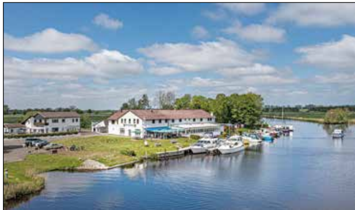
Mit kulinarischem Gaumenkitzel werden unsere Leser*innen im berühmten Fährhaus an der Eider verwöhnt.

gestärkt für den Besuch in St. Peter Ording. Zum großen Leistungspaket der Bus-Sonderfahrt im erstklassigen Fernreisebus ab Eutin zum günstigen Komplettpreis von nur 59,95 Euro gehören neben dem Schlemmer-Bufferet laut Programm im Fährhaus an der Eider zweieinhalb Stunden Freizeit in