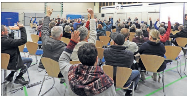
Eine Mehrheit will den Standort des Denkmals neu diskutieren.

am Eutiner Bahnhof gewünscht sind. Diese Zeiten gelten ebenfalls für das Fundbüro der erixx Holstein GmbH, welches für die gesamte Strecke Lüneburg-Kiel im Eutiner Bahnhof betrieben und koordiniert wird. Aber Achtung: Am Mittwoch, 13. März, bleiben das NAH-SH-Kundenzentrum und die Tourist-Info Eutin aufgrund einer betrieblichen Weiterbildung geschlossen!