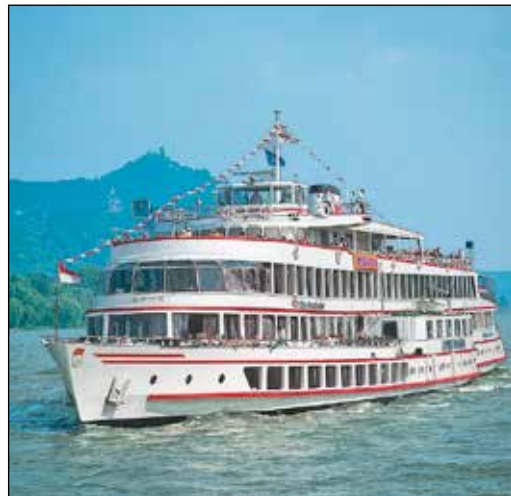
Herrliche Rhein- und Mosel-Kreuzfahrten gehören zum großen Genießer-Programm der Reporter-Sonder-Reise im Mai 2024.

mehrstündige Erlebnis-Schiffahrt entlang des Mittelrheins „rund um die Loreley“ sowie am nächsten Tag ein großer Erlebnis-Ausflug in die verträumten Mosel-Weindörfer entlang der Uferstraße und der Moselschleifen in die vielbesungene Weinstadt Cochem mit Freizeit und einer Genießer-Schiffahrt auf der Mosel auf schönster Strecke mit eindrucksvoller