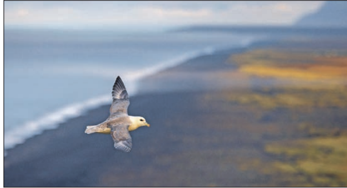
Beeindruckend: Island ist Thema des Nachmittages.

Damit die Kirchengemeinde besser planen kann, wird um Anmeldung bei Pastor Grützmaker unter Telefon 04521-8452572 oder im Kirchenbüro unter Telefon 04521-70130. Gerne darf auch auf den Anrufbeantworter gesprochen werden. Es wird niemand weggeschickt, der die Anmeldung vergessen hat, aber der Kuchen soll reichen.