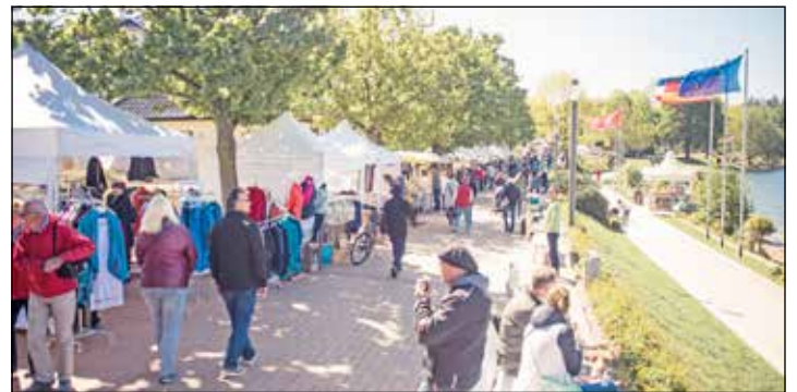
Bunt geht es zu auf der Diekseepramde beim Kreativmarkt.

Wochenende auf der Diekseepramde der Malenter Kreativmarkt – Kunsthandwerk am Dieksee stattfinden. Der Markt startet am Samstag, 11. Mai, und am Sonntag, 12. Mai, jeweils ab 11 Uhr und ist an beiden Tagen bis 18 Uhr für alle Besucher*innen geöffnet. Die Diekseepramde wird an beiden Tagen gefüllt sein mit den vielen vielfältigen Ständen der teilnehmenden Kunsthandwerker*innen und Ausstellern*innen. „Wir freuen uns darüber, dass nun die offizielle Bewerbungsphase für alle Aussteller*innen, die am dies-