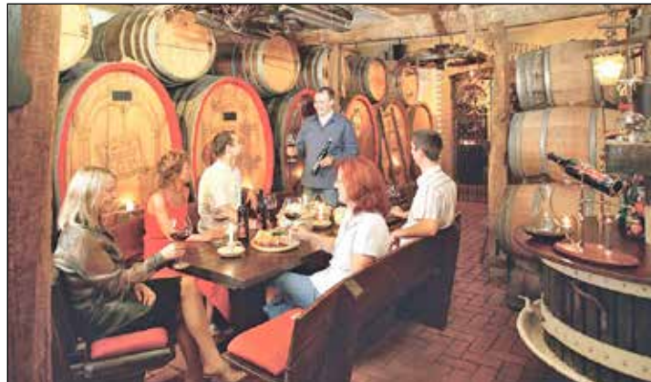
Höhepunkt einer jeder Wein-Reise an Rhein und Mosel ist eine besonders stimmungsvolle Weinprobe mit dem Winzer, wobei unsere Leser 5 Weine in uriger Umgebung probieren können.

Schleusenfahrt. Zudem besteht die Gelegenheit zur stimmungsvollen Weinprobe beim Winzer mit fünf Weinen zum Aufpreis von nur 9,90 Euro. Anmeldungen und Buchungen sind ab sofort möglich bei den Reporter-Leser-Reisen in Eutin unter Telefon 04521-701130 oder direkt online im Internet unter „leserreisen.der-reporter.info“.