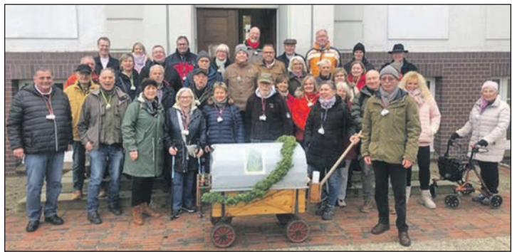
Insgesamt 40 Teilnehmer gingen kürzlich im Eutiner Schlossgarten auf Kohlfahrt.