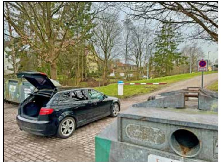
Wie dieser Pkw blockieren regelmäßig Falschparker die Feuerwehrzufahrt.

Container könne er verstehen, doch ein regelmäßiges unangebrachtes Verhalten der Menschen, rechtfertigt dies nicht. „Es reicht ein einfacher Hinweis darauf, dass es sich um eine Feu-