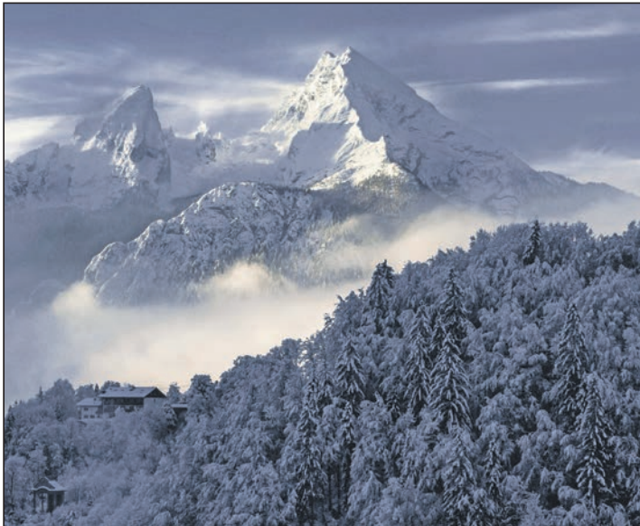
Kilian Schönberger begibt sich mit seinen Bildern auf die Spur von Caspar David Friedrich.

„Die begeistertsten Reaktionen der Besucher 2023 waren für uns Motivation, mit großer Freude weiterzumachen. Die Malenter