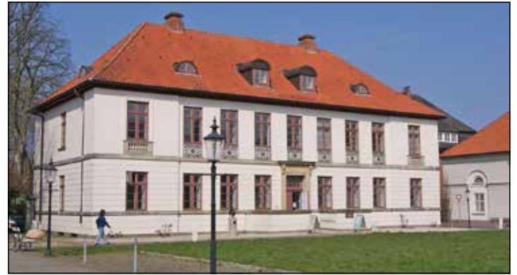
Die Eutiner Landesbibliothek