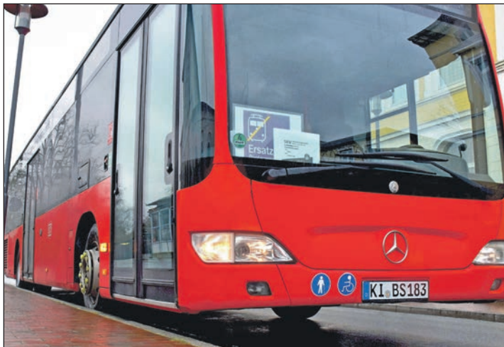
Zwischen Lübeck und Plön wird ein Schienenersatzverkehr eingerichtet.

fährt stündlich und bedient alle Haltestellen der Linie RE83. In Plön wird ein Anschluss vom Bus zu der Linie RE83 gewährleistet. Der reguläre Schienenersatzverkehr ist ebenfalls im Stundentakt, dieser bedient alle Zwischenhalte und stellt in Plön einen Anschluss vom Bus zu der Linie RB84 sicher. Für die Gegenrichtung gilt ein ähnlicher Plan.