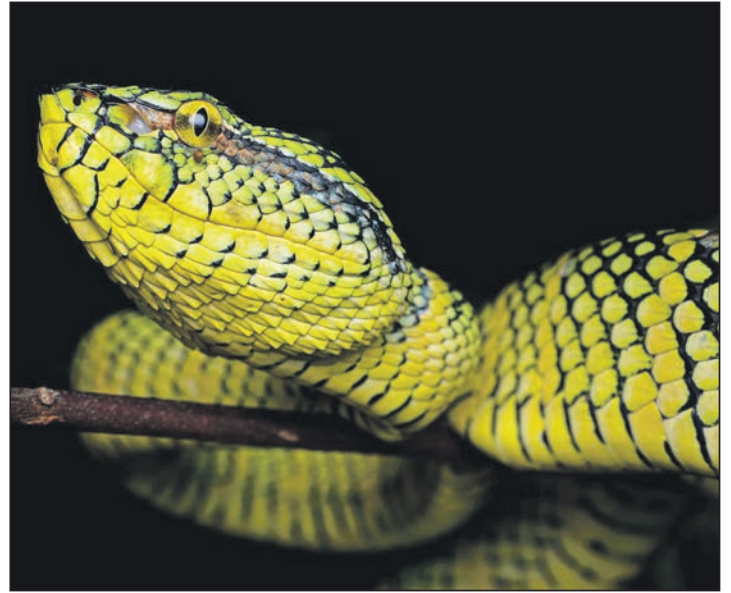
Der Natirfotograf Jan Piecha hat Wagners Lanzenotter in Malaysia fotografiert.

now, Ignaz Friedman und Béla Bartók. Für Jugendliche bis 18 Jahren ist der Eintritt frei, Erwachsene zahlen 30 Euro, Mitglieder und Kurgäste 25 Euro. Reservierungen sind unter Telefon 0151-12585527 oder online auf www.weltklassik.de möglich.