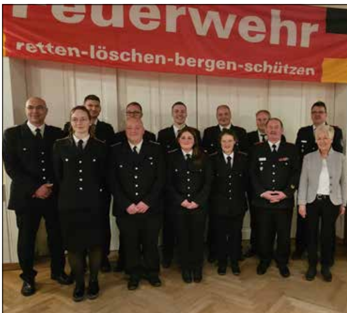
Auf der Jahreshauptversammlung wurden zahlreiche Kameradinnen und Kameraden befördert oder ausgezeichnet.