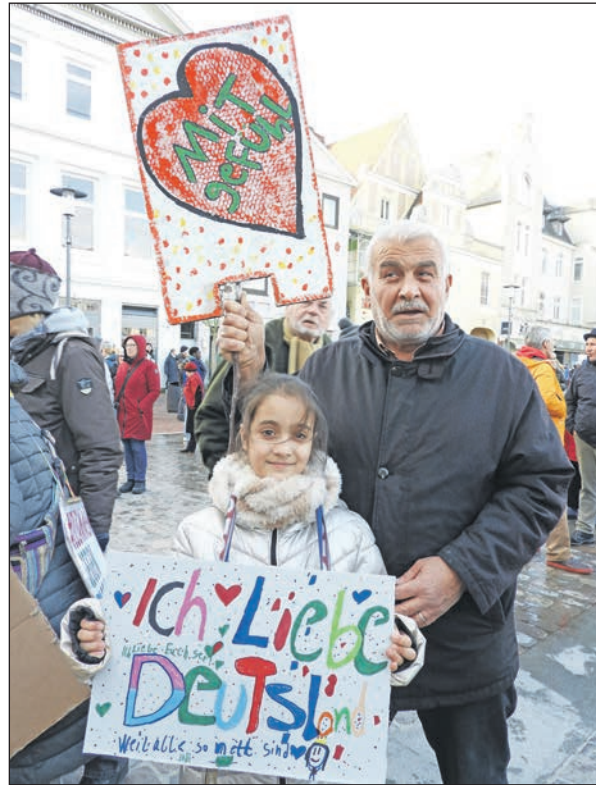
Impressionen der Demonstration.