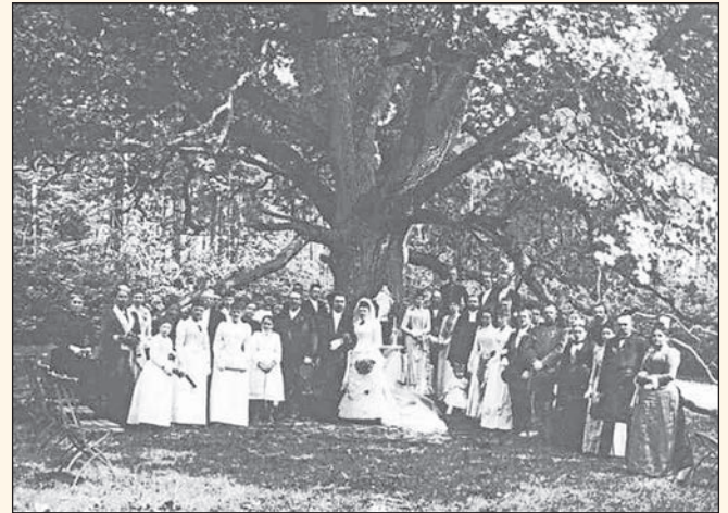
Wie diese Hochzeitsgesellschaft vor mehr als 100 Jahren zieht die geschichtsträchtige Bräutigamseiche bis heute Paare in Bann.

Seither gilt: Wer eine Kontaktanzeige oder was auch immer an „Bräutigamseiche, Dodauer Forst, 23701 Eutin“ schreibt, dessen Brief wird von der Post im Astloch deponiert. Und wer will und Interesse daran hat, kann kommen und sich Briefe herausnehmen (und natürlich beantworten).