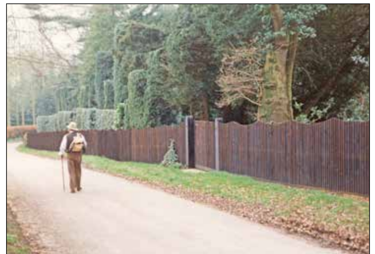
W. G. Sebald: Der Erzähler wurde 1944 im Allgäu geboren. Er starb 2001 in Norfolk.

Eutin (t). Ein Vortrag in der Eutiner Landesbibliothek am Schlossplatz 4 beschäftigt sich mit einem Werk des Autors W.G. Sebald. Mit seinem 1995 erschienenen Prosabuch „Die Ringe des Saturn. Eine englische Wallfahrt“ hat der Schriftsteller ein kaum zu kategorisierendes Buch zwischen Reiseliteratur, Essay und Autobiografie verfasst. Anhand einer „Fußreise“ durch die englischen Grafschaften Norfolk und Suffolk unternimmt der Text die melancholische Kontemplation einer „Naturgeschichte der Zerstörung“, bei der die Wegstationen des Rundgangs immer wieder Anlass zu weitreichenden gedanklichen Abschweifungen bieten, die oftmals provokanter bzw. polemischer Natur sind. So bringt Sebald beispielsweise die Ausrottung der Heringspopulationen in einen Zusammenhang mit den Genoziden des 20. Jahrhunderts oder schlägt vor, im Phänomen des Feuers die Signatur einer destruktiven Moderne zu erkennen.