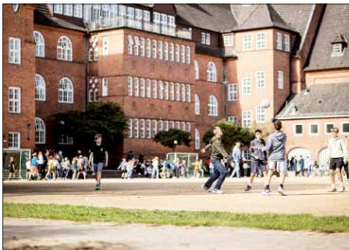
Einen Einblick ins vielfältige Schulleben gibt es beim Tag der offenen Schule.

Daher öffnet die Voß-Schule auf gemeinsamen Beschluss von Schülervvertretung, Eltern und Lehrkräften am Sonnabend, 10. Februar, von 9 bis 12 Uhr erneut ihre Türen außer der Reihe für einen „Tag der offenen Schule“. An diesem Tag kann ab 9.15 Uhr der Unterricht von den Eltern der teilnehmenden Schülerinnen und Schüler besucht werden. Alternativ gibt es verschiedene Mitmachangebote, damit man die Fächer und Arbeitsgemeinschaften an der Voßschule kennenlernen kann.