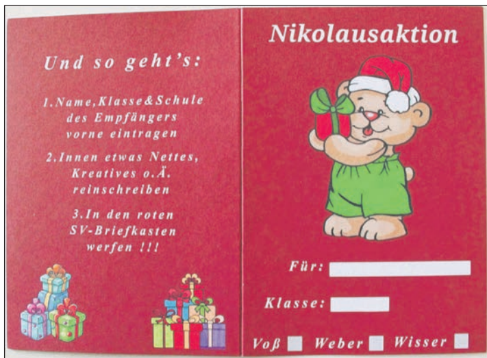
Ein Kärtchen, das liebe Grüße gebracht und Gutes getan hat.