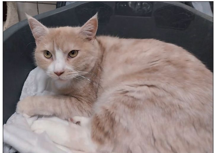
Netter Kerl: Kater Elliot.

Diekstauen 5 • Eutin • Telefon 0 45 21 - 736 44