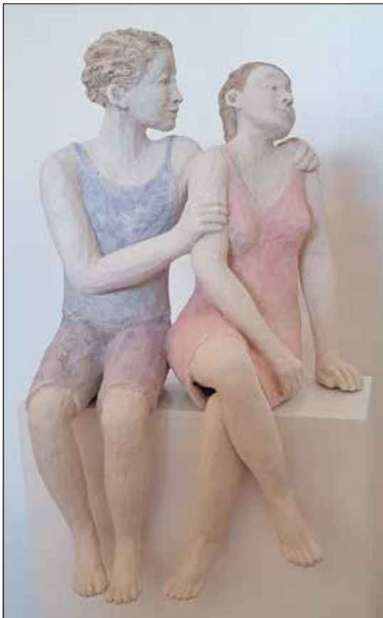
Die Geschichte hinter der Skulptur liegt im Auge der Betrachtenden.