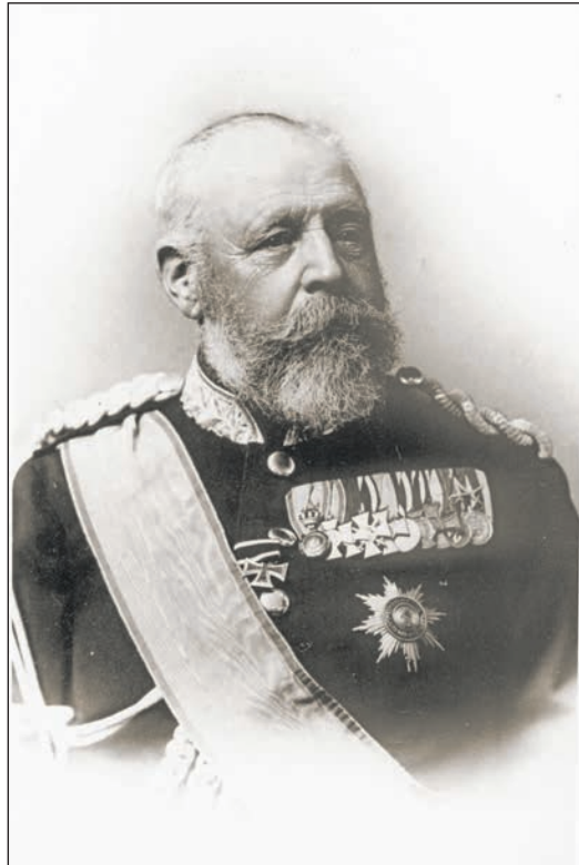
Der Regierungspräsident: Großherzog Nikolaus Friedrich Peter (1853-1900).