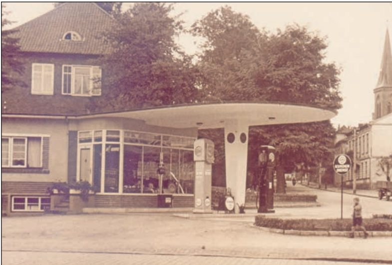
Tankstelle in der Albert-Mahlstedt-Strasse im Jahr 1936.