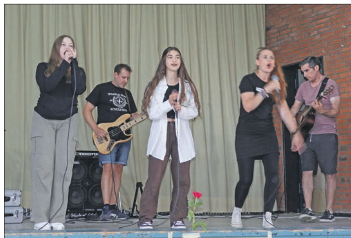
Die Schulband spielt, und das ist nur eines von vielen Highlights an dem bunten Info-Abend.

Schüler und viele Lehrkräfte kennen. Sechs spannende Mitmachaktionen warten auf sie. Die Eltern werden derweil mit einem informativen, multimedialen und liebevoll gestalteten Programm unterhalten, ein Snack aus der Cafeteria und das ein oder andere nette Gespräch mit den Lehrkräften sind inklusive. Zum Abschluss spielt die Schulband und es ist ausdrücklich erwünscht, dass die Familien gemeinsam durch die Schule schlendern und die Eltern sich von ihren Kindern zeigen lassen, was sie erlebt und entdeckt haben.