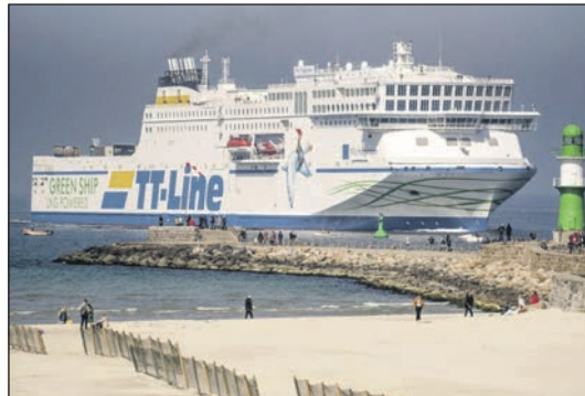
Unterwegs mit den Jumbo-Linern der TT-Line zum „60 Jahre TT-Line“ von nur 199,90 Euro gehören neben der Fahrt im erstklassigen Fernreisebus mit Waschraum/WC und Klimaanlage direkt ab Eutin ohne Einsammeltour die „Ostsee-Kreuzfahrt“ von Travemünde nach Trelleborg mit TT-Line inklusive der Einladung zum Mittagessen an Bord mit einem schwedi-

Eutin (t). Ein genussvoller Jubiläums-City-Trip voller Erlebnisse zum einmaligen Superpreis von nur 199,90 Euro erwartet die Reporter-Leser zum Top-Feiertags-Termin des Jahres 2024 zu Ostern vom 29. bis 31. März 2024 mit einer einmaligen Feiertags-Kreuzfahrt mit Bus und Jumbofähren nach Schweden. Die Einschiffung von Bus und Fahrgästen erfolgt in Travemünde auf Entdeckerkurs Nord. An Bord werden die Gäste mit schwedischen Schlemmer-Spezialitäten preisinklusive rundum verwöhnt und sie genießen die komfortable Überfahrt auf dem Jumbo-Liner mit kostenloser Benutzung der herrlichen Sonnen-