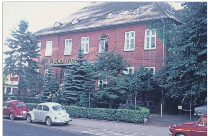
Das Gebäude in der Plöner Straße 19 als Kurbad.