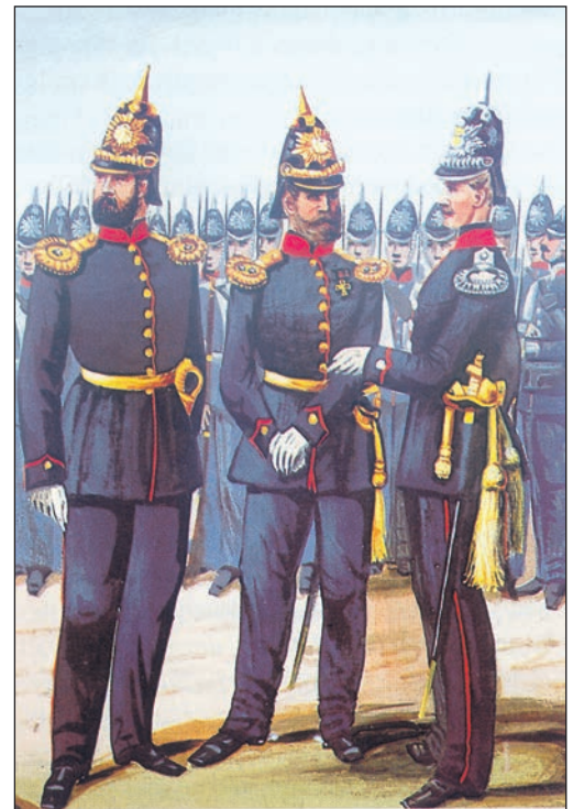
Offiziere in Oldenburg um 1850.