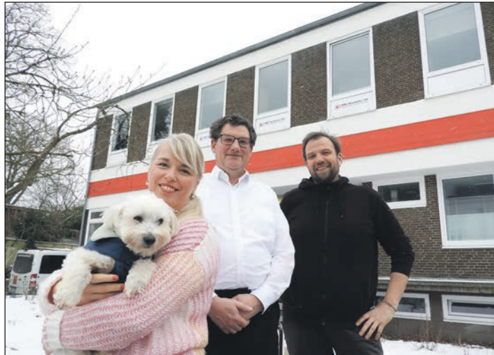
Das Team der DRK-Pflegeakademie, Schulhund eingeschlossen, freut sich über optimale Ausbildungsbedingungen.

Die neuen Räume punkten mit besten Voraussetzungen für eine spannende und erfolgreiche Ausbildung zur Pflegefachkraft oder in der Altenpflegehilfe. Drei Jahre dauert die Qualifikation als Pflegefachfrau oder -mann, mit dem Abschluss ist man in der Lage, in allen Bereichen der Pflege – Akutpflege, Kinderkrankenpflege, stationärer oder ambulanter Langzeitpflege sowie in der psychiatrischen Versorgung, Pflegeberatung, Rehabilitation im Hospiz oder in anderen Einsatzbereichen – tätig zu werden. Altenpflegehelfer*innen unterstützen Pflegefachkräfte bei allen Tätigkeiten rund um die Betreuung und Pflege älterer Menschen. Sie übernehmen pflegerische Aufgaben wie die Hilfe bei der Körperpflege und beim Essen. Außerdem unterstützen sie ältere Menschen bei der Bewältigung ihres Alltags. In der Altenpflegehilfe gibt es zudem hervorragende Zukunftsaussichten und einen auf Dauer sicheren Arbeitsplatz sowie Perspektiven zur Weiterentwicklung. Das nötige Rüst-