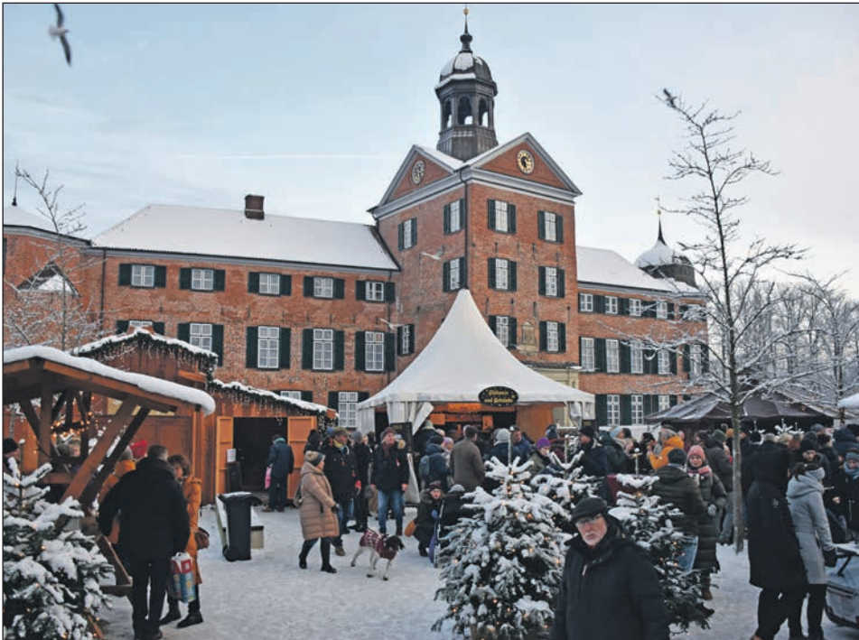
Den kleinen Weihnachtsmarkt auf dem Platz vor den Schlossterrassen wird es dieses Jahr nicht mehr geben. Er fällt dem Rotstift zum Opfer.