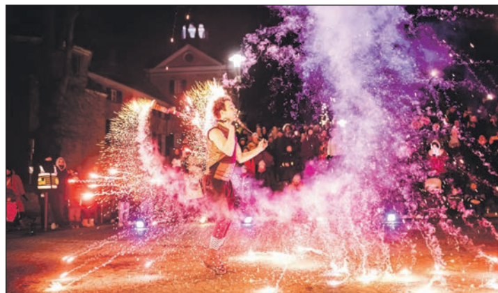
Im Rahmen der Licherstadt wird es auch 2024 Feuerzauber und Lichterglanz in Eutin geben.