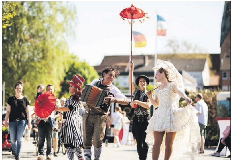
Das beliebte Event „Burger an Kunst“ mit Kulinarik und Kleinkunst an der Stadtbucht wird fortgesetzt.

„In Kombination mit den Bestrebungen der Wirtschaftsvereinigung Eutin und der Eutiner Gastronomen könnten so zusätzliche Verkaufsbuden auf dem Marktplatz, der Peterstraße und der Königstraße durch externe Betreiber aufgebaut werden“, so Keller. Die Eutin Tourismus GmbH werde in den kommenden Wochen mit