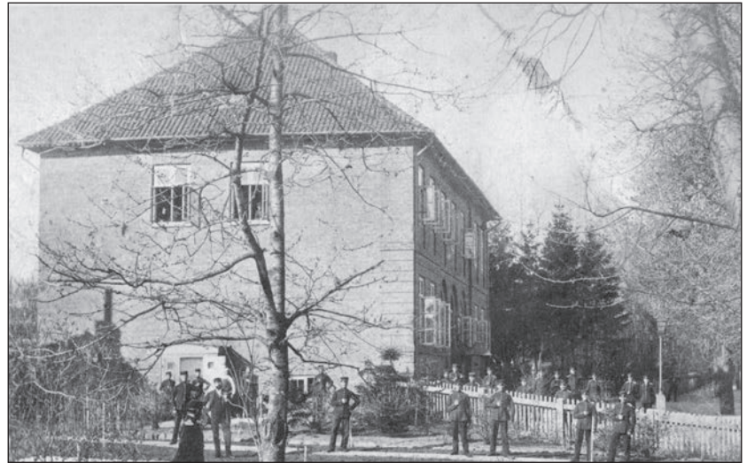
Die „Caserne“: 1851 werden Soldaten im Gebäude kaserniert.

Regierungspräsidenten des Fürstentums Lübeck. Im Revolutionsjahr 1848 wird seine Stellung unhaltbar. Er bittet um seine Entlassung, die mehrfach auf Volksversammlungen gefordert worden ist. Zudem ist er offenbar nicht bereit, nach Einführung der von ihm abgelehnten Verfassung weiterhin im Amt zu bleiben.