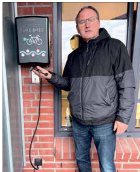
Auch E-Bikes können am MarktTreff geladen werden.

eine nachhaltigere Zukunft. Neben der E-Auto-Ladesäule wurde vor kurzem eine separate E-Bike-Ladesäule installiert, die ebenfalls am Tante Enso-MarktTreff steht. Ein herausragendes Feature der Fahrrad-Ladesäule ist das von der Gemeinde bereitgestellte kostenlose Werkzeugset für kleinere Reparaturen – eine Geste, die die Fahrradfreundlichkeit unterstreicht. Zusätzlich ist das Laden der E-Bikes völlig kostenfrei, was die Nutzung nachhaltiger Transportmittel fördert. Dieser Service