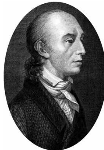
Johann Heinrich Voß (1751-1826).

Freundschaft zum Halberstädter »Altvater« Johann Wilhelm Ludwig Gleim, die problematische Beziehung zum Jugendfreund Friedrich Leopold Graf zu Stol-