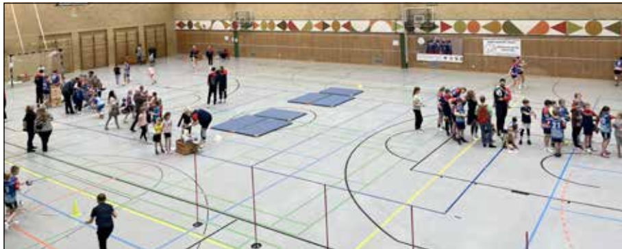
Viele hatten ihre Freunde mit in die Halle gebracht.

mitglieder anzuwerben. Das Ganze schweißt einfach zusammen. Auch Schneider ist sich sicher, dass der Mannschaftssport eine wichtige Rolle in der Vorbereitung auf das weitere Leben natürlich erhielten. Der Verein blickt positiv auf die zahlreiche Beteiligung und freut sich über den großen Andrang. Die HSG steht für eine gute Ausbildung und einen starken Zusammenhalt. Durch die gute Beteiligung in allen Altersklassen ist es möglich durch die Bank in allen Jugend- und Kindermannschaften vertreten zu sein, was in der Vergangenheit vielleicht nicht immer der Fall war. Jedoch erfordert die gesamte Organisation und alles Drumherum viel Arbeit. „Gerade nach der Corona Pandemie wird deutlich, dass wir überall helfende Hände brauchen, ob in Form von Sponsoren oder generell Freiwillige in allen Bereichen,“ so Chris Schneider.