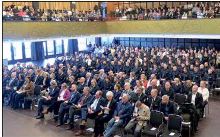
Der Festakt zur Ernennung der 78 Polizeiobermeisterinnen und -obermeister erfolgte vor einer beeindruckenden Kulisse.