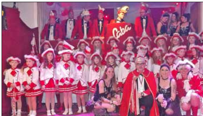
Die Schönwalder Narren sind bestens präpariert für die tollen Tage.

genheit wurde das Ergebnis vieler Übungsstunden mit viel Beifall belohnt. An diesem Abend ist für Getränke und einen kleinen Imbiss gesorgt. Der Eintritt ist frei. Weiter geht es am Sonnabend, 10. Februar, mit dem Kinderkarneval. Hier werden die TSV-Nachwuchsgarden ihren großen Auftritt haben. Um 15 Uhr marschieren sie mit Prinz Dennis nach den Klängen des Lachsbachmarsches in den festlich geschmückten Saal des Landhauses ein. Der Nachmittag wird für alle Kinder mit viel Spaß und Spiel und toller Musik zu einem Erlebnis. Selbst gemachte und gespendete Torten und Kuchen zu moderaten Preisen sorgen für das leibliche Wohl. Der Eintritt für die Kinder beträgt einen Euro, die Erwachsenen zahlen 3 Euro. Am Abend folgt dann die heiße Phase der Narren-