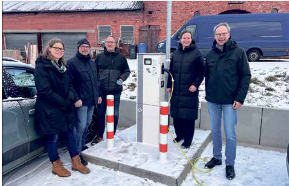
Zufriedene Gesichter bei der Inbetriebnahme der E-Ladesäulen.

sau, die rund 12.000 Euro in das Projekt investiert hat und auf Fördermittel hofft, unterstreicht mit diesem Schritt ihr Engagement für