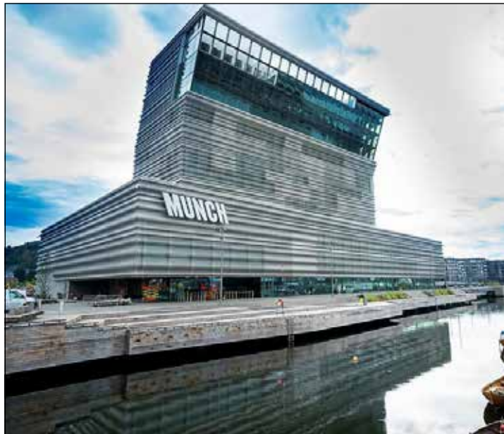
Das neue Munch-Museum in Oslo gilt als derzeit spektakulärstes Kunst-Museum der Welt.

Hin- und Rückfahrt die Übernachtung in Zwei-Bett-Kabinen mit DU/WC, TV etc. (Außenkabinen gegen Aufpreis zusätzlich buchbar von 99 Euro pro Person buchbar), das große Schlemmer-Frühstücks-Buffet der Spitzenklasse inklusive Kaffee, Tee und Säften auf den Hin- und Rückreise an Bord, eine große Stadtrundfahrt in Oslo mit perfekter deutscher Reiseleitung und am Ende der Rundfahrt der direkte Transfer zum komfortablen City-Hotel im Herzen von Stadt und Hafen, eine Übernachtung mit skandinavischem Frühstück vom Buffet in Doppelzimmer mit DU/WC, TV sowie die Eintrittskarte in das neue Munch-Museum mit garantierter Zutritt zum festgelegten Zeitfenster ohne Warteschlangen zum ausgiebigen Museumsbesuch (geöffnet bis 21 Uhr). Anmeldungen werden in der Reihenfolge der Buchungen angenommen im Reporter-Leser-Reisen-Büro des Burg-Verlages in Eutin täglich von 9 bis 13 Uhr