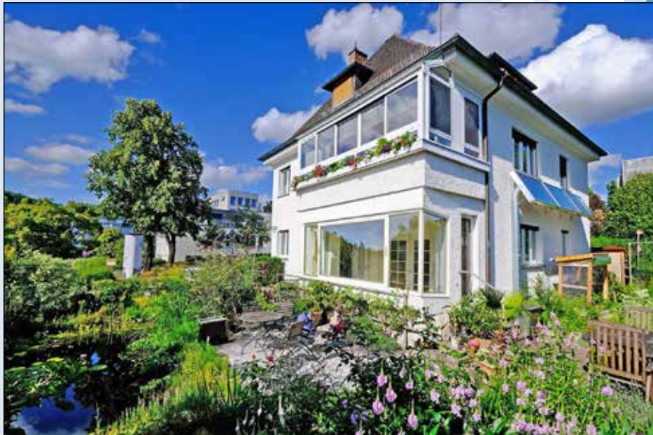
Eine Solarlüftung an der Südfassade sorgt jetzt für ein besseres Raumklima im Keller.

Kreis Ostholstein (DJD). Ältere Wohngebäude haben ihren eigenen Charme, weisen allerdings auch so manche Problemzonen auf. Oft gehört das Kellergeschoss dazu: Mangelnde Möglichkeiten der Belüftung sorgen dort dafür, dass die Raumluft stickig wirkt und sich Feuchtigkeit ansammeln kann. Da das regelmäßige Lüften über Fenster oft nicht ausreichend oder möglich ist, sind Alternativen gefragt, um für gesunde Verhältnisse zu sorgen und weitergehenden Problemen bis hin zur Schimmelbildung vorzubeugen. Eine solare Lüftung mit Energiegewinn wirkt dem klammen Raumklima entgegen und