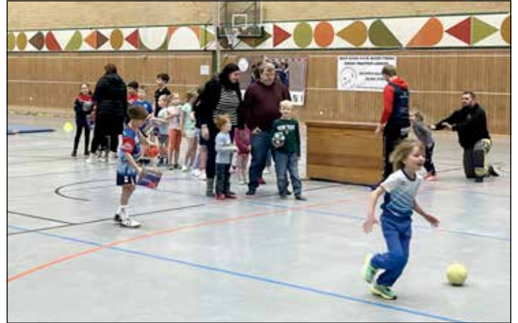
An sechs Stationen konnten sich Kinder an Aktionstag dem Handballsport nähern.