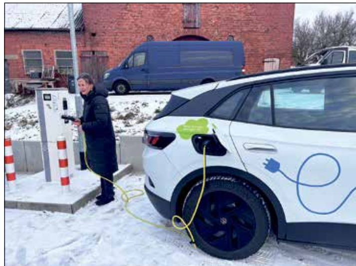
Eine gute Infrastruktur erleichtert die Entscheidung für E-Mobilität.

App-basierten Transaktionen, traditionellen Kreditkarten oder dem schnellen, unkomplizierten PayPal, spiegelt sie den fortschrittlichen Geist der Gemeinde wider. Diese benutzerfreundlichen Zahlungsoptionen vereinfachen den Ladevorgang erheblich und laden dazu ein, die Vorteile der Elektromobilität zu nutzen. Durch diese Flexibilität wird die Hürde für den Wechsel zu einem elektrisch betriebenen Fahrzeug niedriger und unterstützt so den Übergang der Gemeinde zu nachhaltigeren Verkehrslösungen.