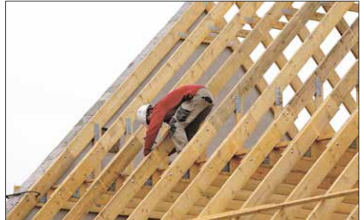
Die Baubranche gehört zu den Zweigen, die stark witterungsabhängig sind.

der Schlechtwetterperiode vom 1. Dezember bis zum 31. März gezahlt. Dabei wird die Leistung bereits ab der ersten Ausfallstunde gewährt und kann für den ganzen Betrieb oder einzelne Abteilungen gelten. Das Unternehmen geht in Vorleistung und die betroffenen Arbeitnehmenden erhalten das Saison-Kug in der Höhe des sonst gezahlten Arbeitslosengeldes, bleiben aber weiterhin bei ihren Betrieben angestellt. Verbessern sich die Witterungsbedingungen und ist dadurch wieder eine kurzfristige Arbeitsaufnahme möglich, kann die Weiterbeschäftigung unkompliziert und ohne langwierige Personalsuche erfolgen. Anschließend stellt der Be-