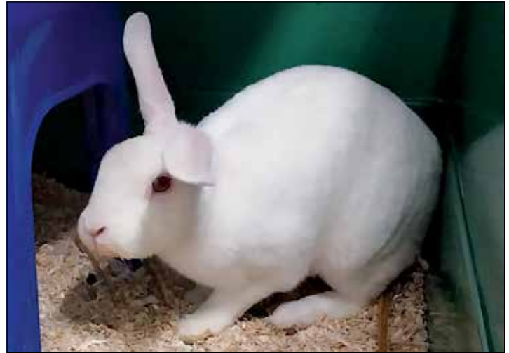
Dusty liebt Menschen und Leckerlis.

Diekstauen 5 • Eutin • Telefon 0 45 21 - 736 44