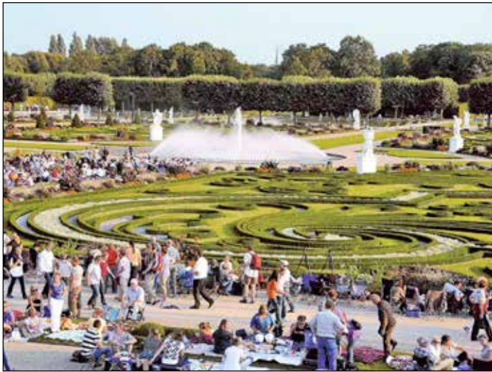
Das Top-Event im Mai mit Musik: Das Feuerwerks-Sommerfest unter dem Sternenzelt Hannovers findet in den Herrenhäuser Gärten statt.

Buchungen sind ab sofort bei den Reporter-Leser-Reisen des Burg-Verlages in Eutin unter Telefon 04521-701130 von Montag bis Freitag von 9 bis 13 Uhr oder direkt online im Internet auf leser-reisen.der-reporter.info möglich.