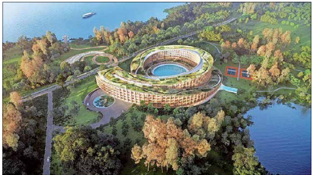
Der spiralförmige Gebäudekomplex des „Lakeside Resort“ soll in den nächsten Jahren am Kellersee in Krummsee gebaut werden. Visualisierung: Hadi Teherani Architects

vollständig saniert werden – Beginn möglicherweise noch im laufenden Jahr. „In dem Zusammenhang wird auch eine Brücke hinter Sieversdorf erneuert, was mit einer einjährigen Vollsperrung verbunden ist“, kündigt der