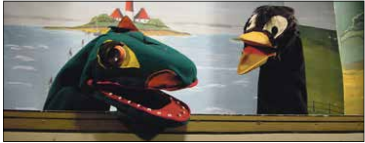
Krokodil Otto und Rudi, der Rabe freuen sich auf zahlreiche kleine und große Besucher.