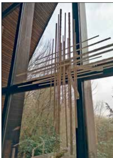
Auch wenn die Friedenskirche jetzt ein Archiv ist – das Kreuz wird bleiben.

Eutin (aj). Die Friedenskirche in Eutin-Neudorf ist ein Beispiel dafür, wie der Prozess von der Entweihung zur Neunutzung eines Kirchenhauses zu einem guten Ende für alle gestaltet werden kann. Davon können sich die Mitglieder und Mitarbeiter*innen der Kirchengemeinde Eutin sowie alle Interessierten am Freitag, 26. Januar, von 10 bis 16 Uhr bei einem Tag der Offenen Tür ein eigenes Bild machen. Die 1971 bis 1973 erbaute Friedenskirche ist ein Baudenkmal und bleibt als solches in ihrem Erscheinungsbild erhalten. Im Inneren ist durch einen Bau im Bau ein modernes Raumkonzept für das Archiv des Kirchenkreises Ostholstein