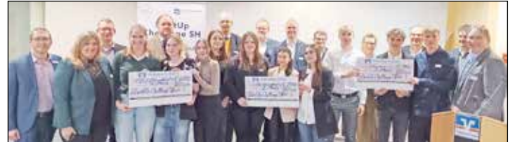
Kreative Köpfe: Schülerinnen und Schüler des 11. Jahrgangs präsentierten ihre Startup-Ideen.

„Inklusions Integrations Café“ oder „clean brush“ heißen sie beispielsweise und machen neugierig auf das, was die Schülerinnen und Schüler während ihres Unterrichts in den vergangenen Monaten erarbeitet haben. Sie alle nehmen teil an dem von der Fachhochschule Kiel initiierten Wettbewerb der StartUp Challenge Schleswig-Holstein. Dieser wird landesweit für Berufliche Schulen im Rahmen der Entrepreneurship-Education ausge-