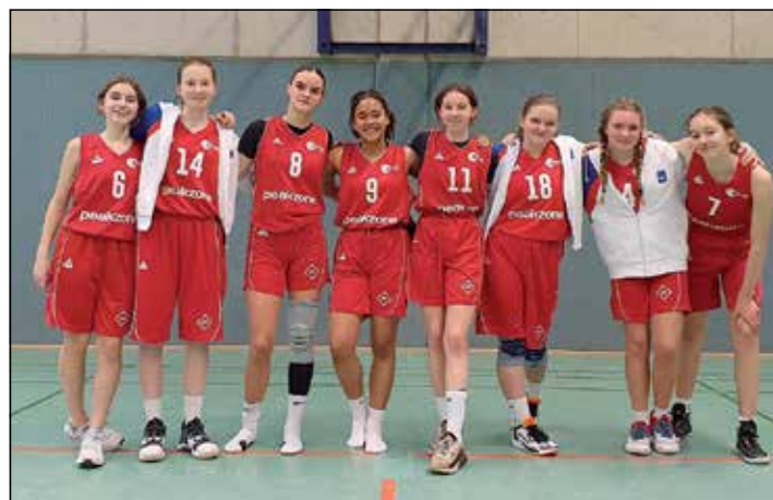
Einen klaren Sieg konnte die BG Ostholstein am vergangenen Wochenende verbuchen.

Eutin (t). Am vergangenen Sonnabend, 20. Januar, fand in Oldesloe das Spiel der beiden neuen Mannschaften in der weiblichen Basketballoberliga statt. Beide Teams waren bis dahin ohne Erfolg. Das Team der BG Ostholstein startete sehr hektisch und kam sehr schlecht ins Spiel. Obwohl das erste Viertel mit 14:8 gewonnen wurde, kam es immer wieder zu leichten Ballverlusten. Auch das zweite Viertel lief kaum anders. Zur Halbzeit stand es 25:14. Also kein Grund, sich zurückzulehnen. So langsam bekam das Team das Spiel dann besser in den Griff. Es wurde mehr miteinander gespielt und freie