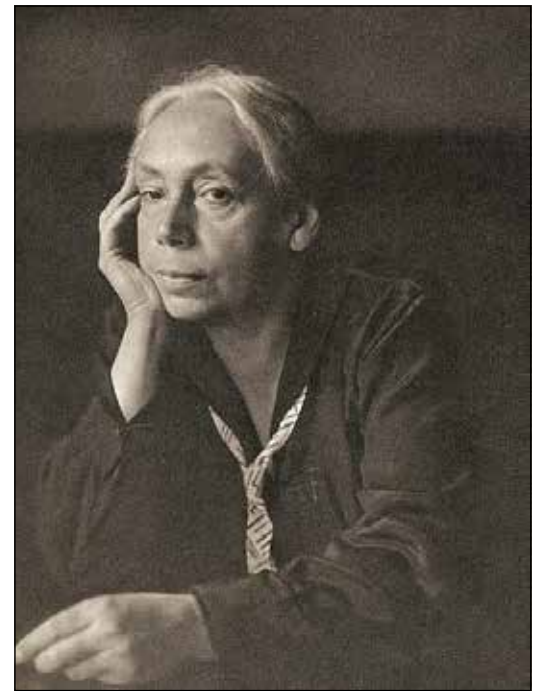
Käthe Kollwitz zählt zu den bekanntesten deutschen Künstlerinnen.

Augenblicks vor Ort festzuhalten. Die beiden Sommerausstellungen in Eutin widmen sich dem Thema „Tiere in der Bildenden Kunst“. Im Erdgeschoss wird unter dem Titel „Tierbilder – Gemälde der Düsseldorfer Malerschule“ (30. Juni bis 8. September) eine große Auswahl an Gemälden mit tierischen Motiven gezeigt. Denn Tierbilder – ob Pferde in Schlachtenbildern, Nutztiere in der Landwirtschaft, Wildtiere in der Natur oder Bilder von