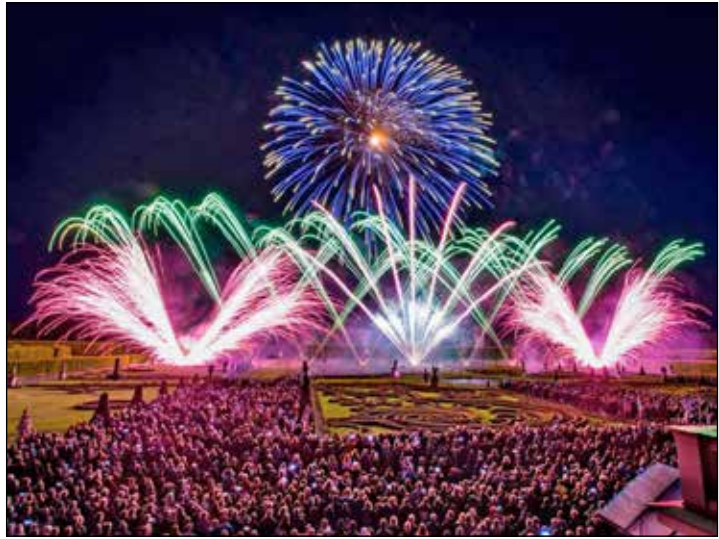
Ein weltweit einmaliger Farbenrausch mit Musik erwartet unsere Leser*innen im Mai in den Herrenhäuser Gärten.

Residieren werden die Leser*innen „First Class“ in Best-Lage direkt im Zentrum der nie-