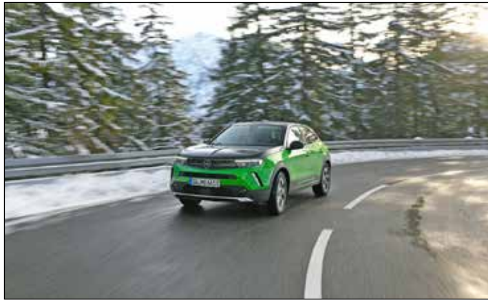
Im Winter ist Umsicht gefragt.

Ostholstein (t). Die kalte Jahreszeit stellt immer wieder besondere Anforderungen an Fahrer und Fahrzeug. Ein anderer Fahrstil ist gefordert. Um sicher bei winterlichen Straßenverhältnissen von A nach B zu kommen, rät die Gesellschaft für Technische Überwachung (GTÜ) vor dem Weg zur Arbeit oder in den Wochenendausflug dem Wetterbericht zu hören. Bei Schneefall sollten Staus und Verspätungen eingeplant werden. Daher empfiehlt es sich bei winterlichen Verhältnissen etwas früher als üblich loszufahren. Vor Fahrtantritt sind die Scheiben unbedingt ganz von Schnee, Eis oder Reif zu befreien, denn ein nur kleines Guckloch ist ein erhebliches Sicherheitsrisiko durch eine stark eingeschränkte Sicht. Wichtig für den klaren Durchblick sind saubere Scheiben und intakte Wischer. Die im Winter häufige Benutzung des Gebläses verschmutzt die Frontscheibe von innen und bildet einen Belag der für Lichtbrechungen sorgt. Des-