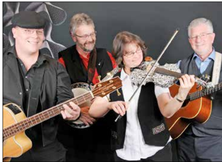
Die Ferrymen kommen wieder in die Lutherkirche.

Kleinmeinsdorf (t). Am Freitag, 26. Januar, um 19.30 Uhr erwartet Verein Lutherkirche Kleinmeinsdorf die Gruppe Ferrymen, die dort seit Jahren am letzten Freitag im Januar gute Laune verbreitet. Unter dem Titel „Irish Folk & more“ nehmen die „Ferrymen“ ihre Passagiere mit auf die grüne Insel und machen dabei seit über 20 Jahren jede Menge Abstecher in alle Himmelsrichtungen. In der langen Bandgeschichte haben sich die Mitglieder mit ihren Interpretationen von Balladen, Auswanderungsliedern und den herben Kneipensongs in die Herzen vieler gespielt. Die gute Stimmung, die das Quartett bei ihren Auftritten verbreitet,