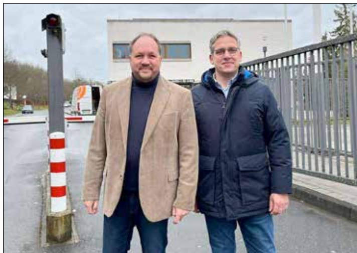
Landrat Timo Gaarz und Dr. Uwe Jürgens vor der Bundesakademie für Bevölkerungsschutz und Zivile Verteidigung.

sche, technische und materielle Ausrichtung des Katastrophenschutzes des Kreises Ostholstein bildet. Im Rahmen einer Risikoanalyse werden zunächst anhand von lokalspezifischen Modellzenarien die Bedarfe bzw. die erforderlichen Bewältigungskapazitäten bestimmt. Als mögliche Szenarien werden u.a. Küstenhochwasser bzw. Starkregenereignisse, Hitzewellen und langanhaltende Stromausfälle detailliert analysiert und im Nachgang hierzu die wesentlichen Anforderungen an den Katastrophenschutz des Kreises Ostholstein abgeleitet.