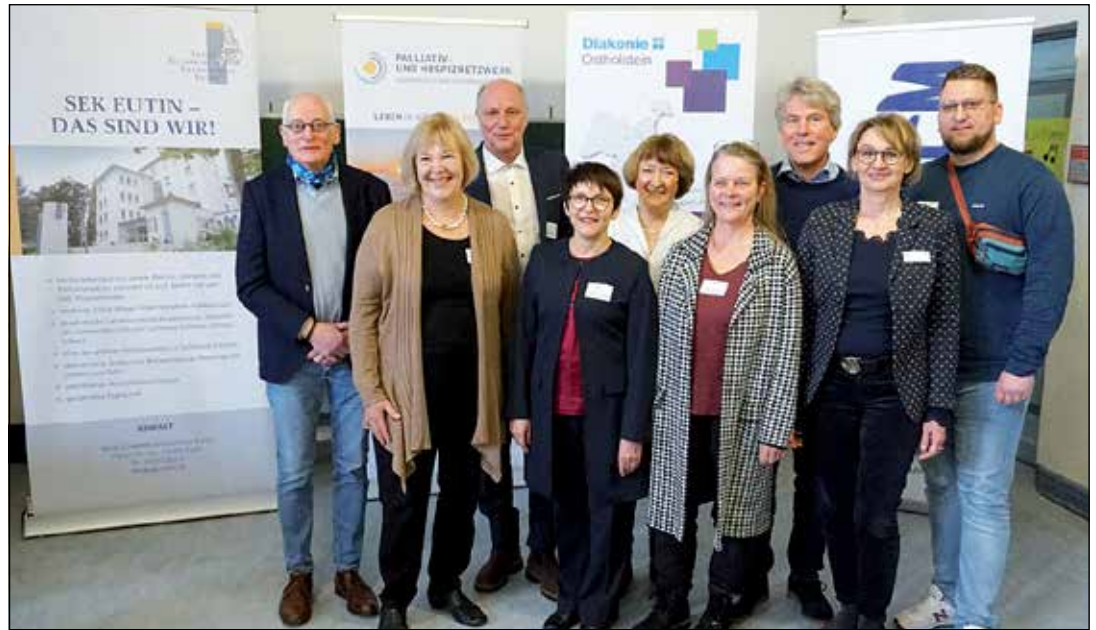
Austausch und Vernetzung standen beim Treffen in der Voß-Schule auf dem Programm.

„Selbst wenn nichts mehr zu machen ist, können wir noch