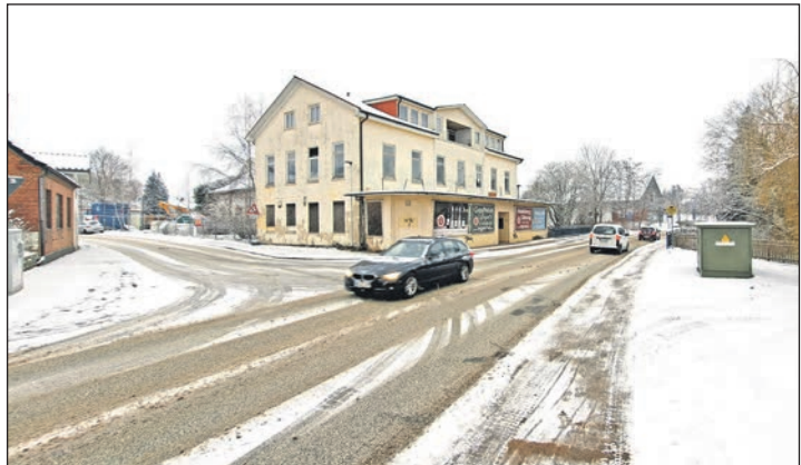
Die Kreuzung an der ehemaligen Gaststätte „Deutsches Haus“ muss in den Osterferien voll gesperrt werden. Rettungskräfte können die Baustelle über die Fläche an der kleinen Umspannstation umfahren.

Im dritten Bauabschnitt bleibt den Verantwortlichen dann aber nichts übrig, als die Straße in Höhe der ehemaligen Gaststätte „Deutsches Haus“ vom 2. bis