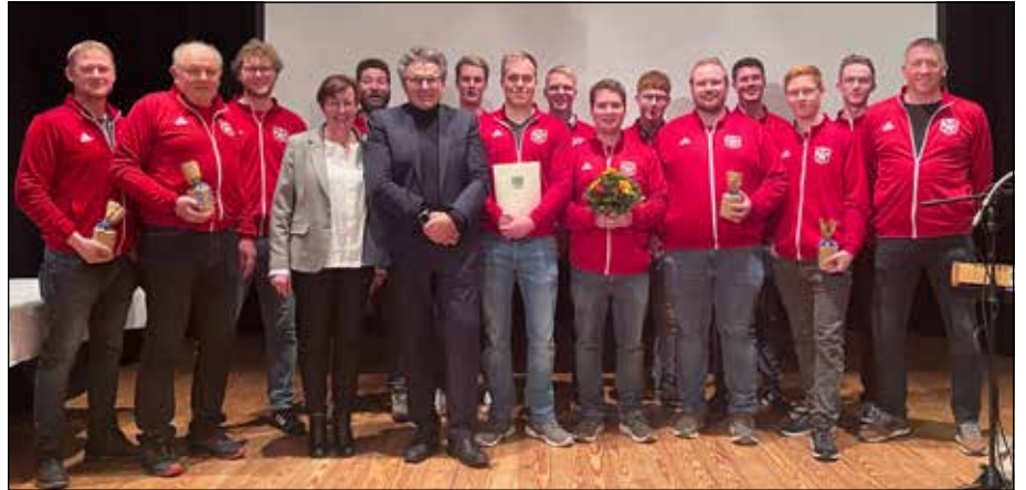
Ehrungen standen auf dem Programm des Bürgertreffs. Sie galten den Handballern des MTV Ahrensböck...

die Tanzfläche wagte – war doch ein leichtes Mitwippen bei einigen Gästen zu beobachten, ein stilles Zeugnis dafür, wie Mu-