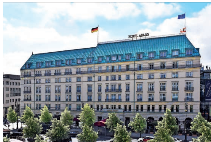
Das „berühmteste Hotel der Welt“ am Pariser Platz in Berlin können die Reporter-Leser im Februar 2024 ausführlich genießen.

Als kulturellen Höhepunkt der dreitägigen Sonder-Reise zum Top-Termin vom 25. bis 27. Februar 2024 zum sehr günstigen Komplettpreis von nur 475 Euro genießen unsere Leser inklusive Eintritt ohne Warteschlangen und inklusive Hin- und Rück-Transfer das weltberühmte Barberini-Mu-