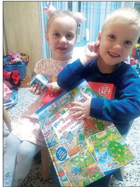
Weihnachtsfreude – auch dank der Spenden aus Eutin.

der großen Spendenbereitschaft der Menschen, die in Eutin und Umgebung so zahlreich kom-