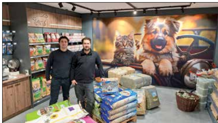
Der Tankstellenshop hat ein völlig neues Gesicht erhalten. Der Bereich für Tierfutter und -zubehör sticht besonders heraus.

nehmen gehört dem „Bundesverband Freier Tankstellen und Unabhängiger Deutscher Mineralölhändler“ (bft) an.