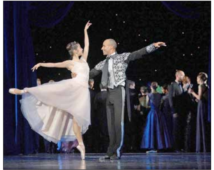
Der Theaterbus bringt Interessierte zum Ballett „Cinderella“.

Ostholstein/Kreis Plön (t). Am Freitag, 2. März, fährt der Theaterbus ab Plön über Bad Malente, Eutin und Ahrensböck nach Lübeck – auf dem Programm steht an diesem Samstag das Ballett »Cinderella« von Jaroslav Ivanenko. Die Vorstellung beginnt um 19.30 Uhr im Großen Haus. Wer an der Theaterfahrt