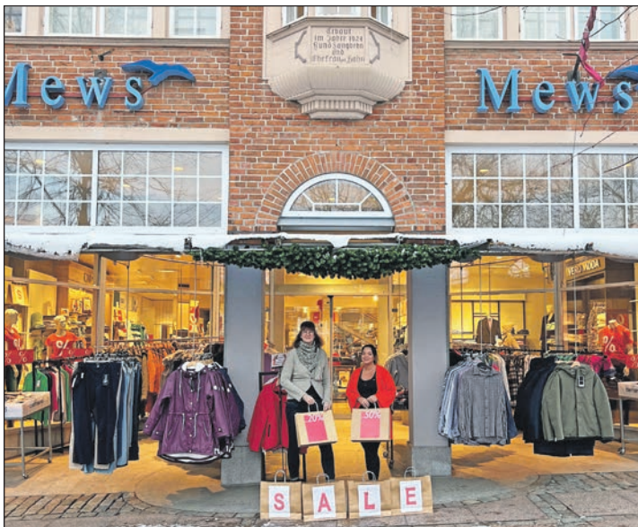
Das Modehaus Mews startet in den Winterschlussverkauf mit attraktiven Angeboten.

Wer bei diesem Termin nicht dabei sein kann, kommt gern am 1. Februar ohne Anmeldung im BiZ Lübeck vorbei. Nicole Kowalski beantwortet während der offenen Sprechzeiten von 14 bis 17 Uhr die Fragen.