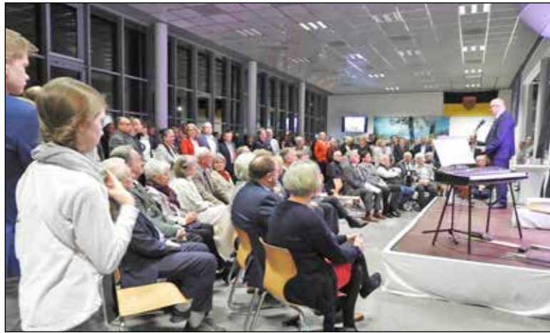
Gut 300 Gäste kamen zum Empfang.