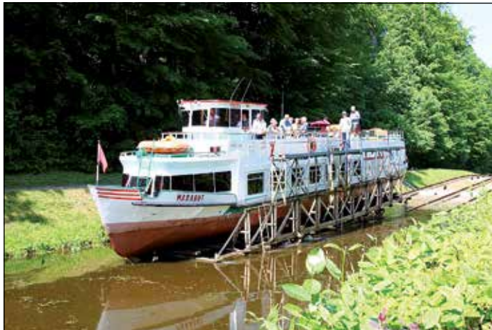
Über die „rollenden Berge“ erleben die Reporter-Leser eine ganz besondere Schifffahrt in Polen von Weltruhm.

ganz besondere Höhepunkte – darunter die weltberühmte Masurische Seenplatte, das Top-Erlebnis Elbing und ein Abstecher zur Marienburg, die Hansestadt Danzig, der weltbekannte Oberlandkanal, eine Schifffahrt über