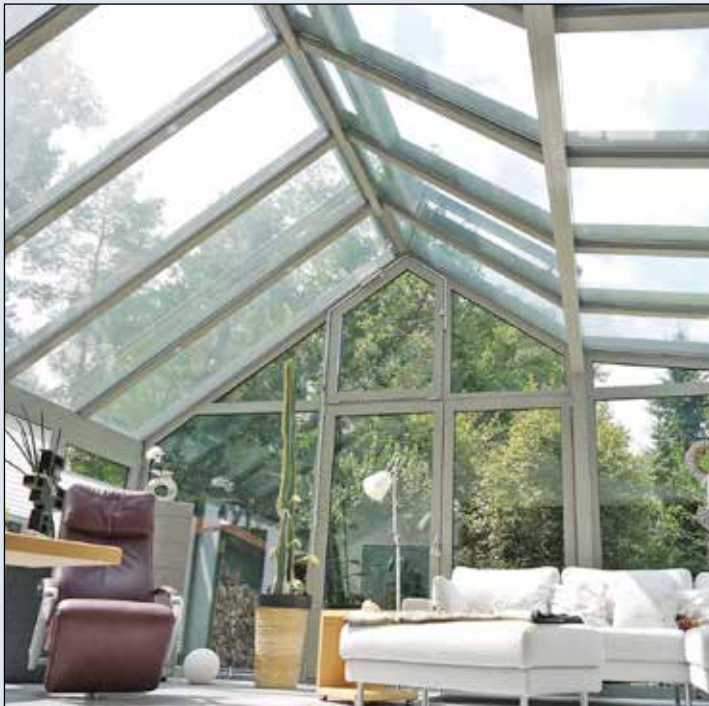
Besonders ältere Menschen schätzen an einem Wintergarten das deutliche „Mehr“ an Licht. Dies ist das beste Mittel gegen eine Winterdepression.

Aufgrund seiner exponierten Lage und der großen verglasten Flächen machen sich Temperatur- und Wetterschwankungen in einem Wintergarten erheblich schneller bemerkbar als in ei-