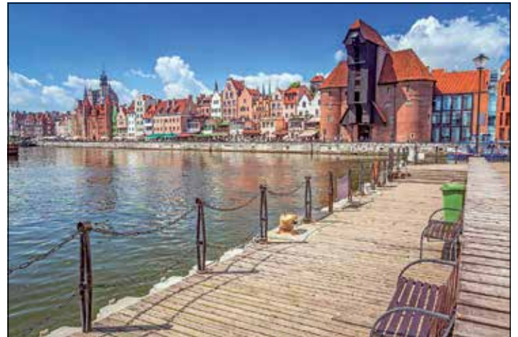
Die weltberühmte Hansestadt Danzig ist eines der Ziele der Tagesausflüge bei der Reporter-Rundreise in Polen.

die „Rollenden Berge“ sowie das Erlebnis „Frisches Haff“ und Frauenburg. Residieren werden die Reporter-Leser*innen im festen Standort-Hotel ohne lästigen Hotelwechsel am „Frischen Haff“