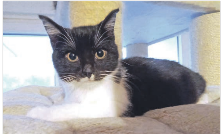
Überlebte als einziges von fünf Geschwistern: Kitten Liv.

Tierschutz Eutin und Umgebung e.V. Dieckstauen 5 • Eutin • Telefon 0 45 21 - 736 44