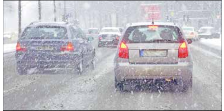
Eine Standheizung erspart nicht nur lästiges Eiskratzen, sondern schont auch die Umwelt.

Verkehrsteilnehmer hält sich an diese klare Regelung. Und ignoriert nicht nur die Lärmbelastigung, sondern auch die Abgase: Der Ausstoß kurz nach dem Motorstart ist besonders schädlich, weil der Katalysator erst nach einer Aufwärmphase wirkungsvoll arbeitet. Die GTÜ nennt weitere technische Argumente, die gegen den Leerlauf eines Motors sprechen. Vor allem ist es ein Trugschluss, dass das Triebwerk auf diese Weise warm wird: Denn es dauert sehr lange, bis ein Motor bei Leerlaufdrehzahl auf Betriebstemperatur kommt. Selbst nach mehreren Minuten erwärmt sich das Motoröl nur um wenige Grad Celsius. Die GTÜ rät daher, sofort nach dem Motorstart loszufahren