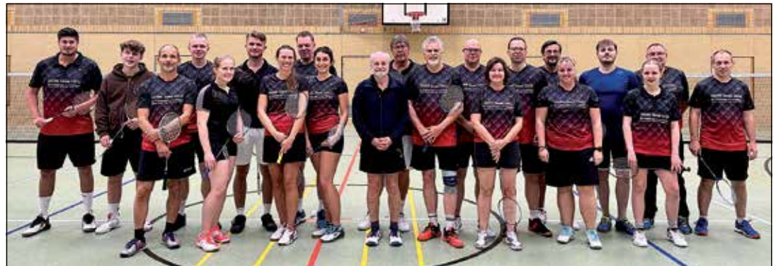
Am 3. Februar sind alle drei Badminton-Seniorenteams der SG BSG/Riemann Eutin zeitgleich in der Eutiner Sporthalle „Blaue Lehmkuhle“ im Einsatz.