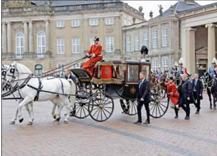
55 „reporter“-Reisende waren dabei, als in Kopenhagen Geschichte geschrieben wurde.