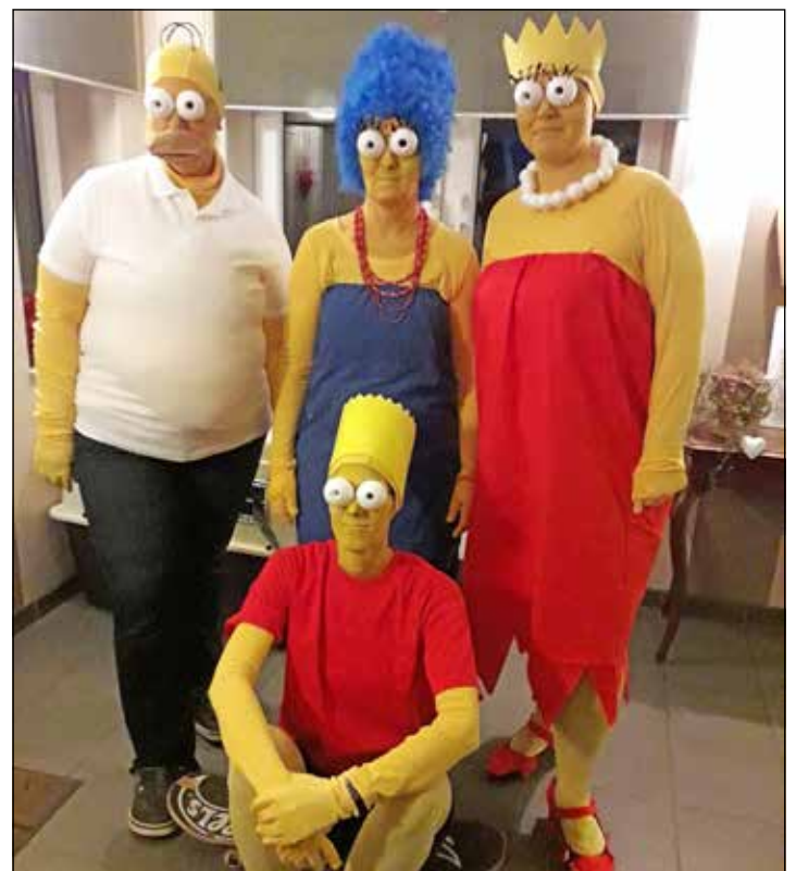
In Sachen Kostüm kreativ zu sein macht Spaß und kann sogar einen Preis einbringen.

Bereits nachmittags von 15 bis 18 Uhr findet der Verkleidungsspaß für die Kinder statt.