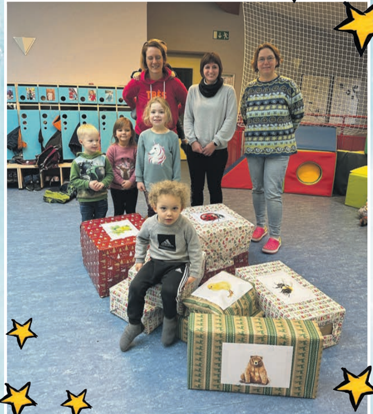
Im „Spatzennest“ freute man sich über die Geschenke des Fördervereins.

dann immer kurz vor dem Fest. Und so überbrachten die Mitglieder einen ganzen Sack voller Spielzeuge, die gleich ausgepackt werden durften und schon im Einsatz sind. Die Gruppen konnten sich freuen über eine Parkgarage, einen Arztkoffer, Autos, Rutschetierautos (verwandt