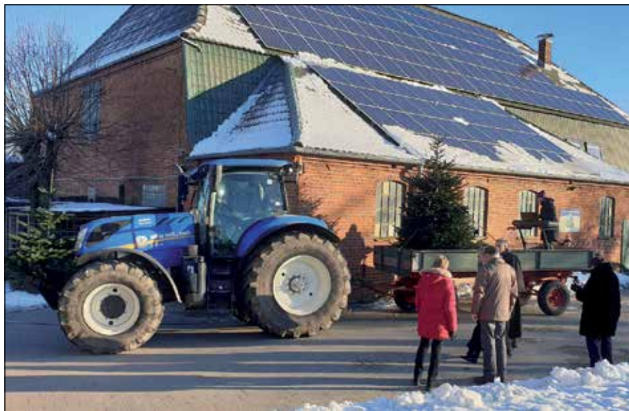
Mit dem Trecker geht es über die Dörfer.

Uhr rollt er auf den Hof Drückhammer in Quisdorf, um 12 Uhr folgt die Wisserkate Braak und um 12.30 Uhr in Groß Meinsdorf der Geräteschuppen in der Bockholter Straße. Um 13 Uhr geht's zu Familie Hoffmann, Im Dorfe 24, nach Bockholt, danach um 13.30 Uhr auf den Hof Voß nach Zarnekau. Um 14 Uhr steht der Treck in Sagau am Feuerwehrhaus, um 14.30 Uhr in Sibbersdorf auf