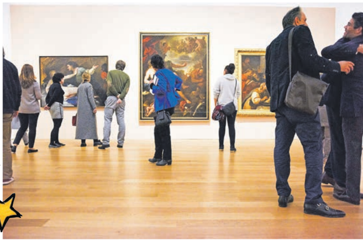
Das derzeit berühmteste Kunst-Museum Europas erwartet unsere Leser in Potsdam mit dem Barberini-Museum mit der sensationellen neuen Munch-Ausstellung.

Hotel Adlon am Brandenburger Tor im Herzen der Bundeshauptstadt Berlin. Unsere Leser genießen Stil und Atmosphäre des „berühmtesten Hotels der Welt am Pariser Platz“ mit luxuriö-