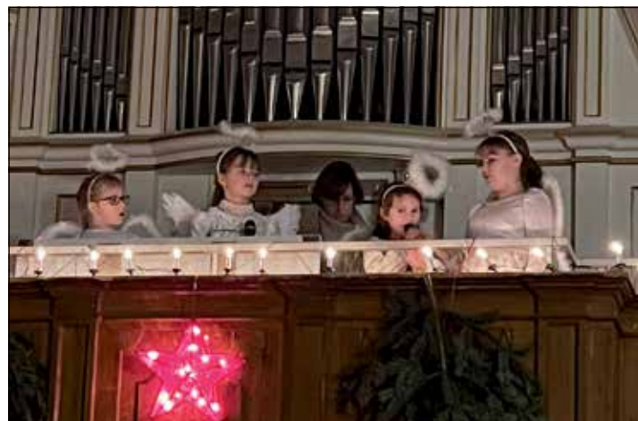
Die Engel verkünden die frohe Botschaft des Weihnachtsfestes.