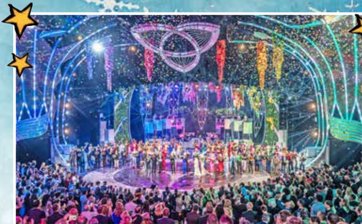
Weltklasse-Show like Las Vegas: Die Weltpremiere „Falling in Love“ begeistert das Publikum in Berlin.