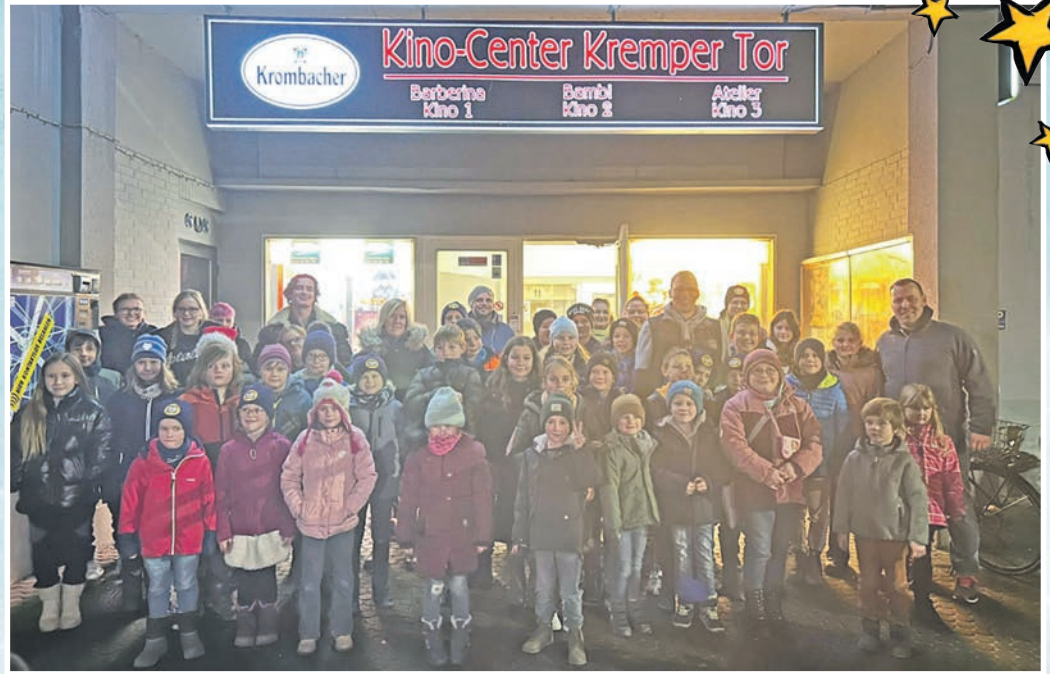
★ ★ Mit dem Weihnachts-Kino endet das Judojahr in Ahrensböök.