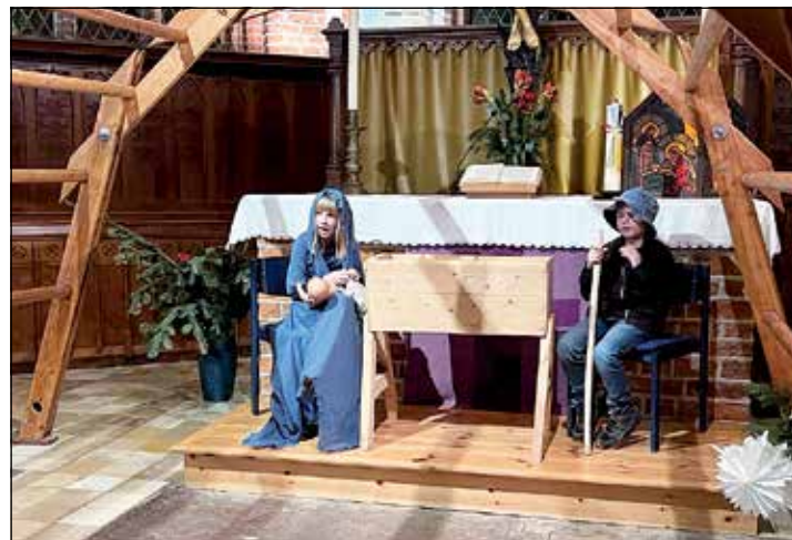
In der festlich geschmückten Kirche wird die Geschichte von der Geburt Jesu erzählt.