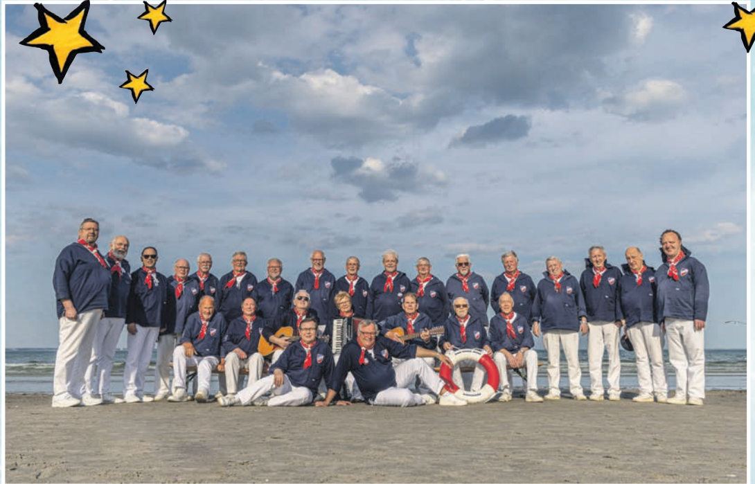
Die „Blau-weißen Jungs“ lieferten Ahrensböök ein vorweihnachtliches Musikvergnügen.