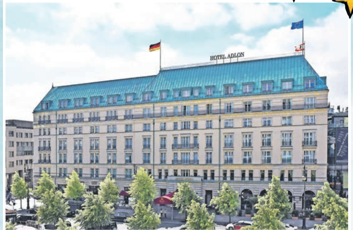
Das „berühmteste Hotel der Welt“ am Pariser Platz in Berlin können die Reporter-Leser im Februar 2024 ausführlich genießen.

sen Hotel-Zimmern sowie dem legendären Adlon-Gourmet-Schlemmer-Frühstücksbuffet und der Möglichkeit zur Nutzung der großen Wellness-Abteilung mit Hallenbad, Sauna und Fitnessraum.