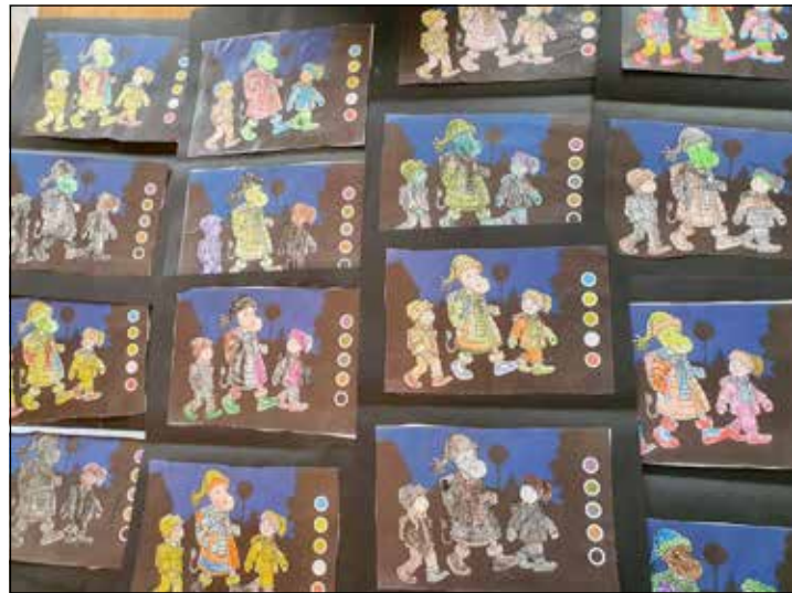
Mit einem Malwettbewerb wurde den Grundschulklassen das Thema „Sichtbarkeit“ nahegebracht.

aussetzen. „Die LVW Schleswig-Holstein, so Pier weiter, „hat es sich daher zum Ziel gesetzt, das Bewusstsein der Kinder dafür zu schärfen, dass es einen lebensrettenden Unterschied ausmacht, ob jemand dunkle oder helle Kleidung im Straßenverkehr trägt. Es geht darum, zu erkennen, wie wichtig helle Kleidung und reflektierende Materialien für die eigene Sicherheit sind. Dieses Wissen soll durch die Aktion „Sicherheit durch Sichtbarkeit“, die als landesweite Schutzmaßnahme für die Schulanfänger konzipiert ist, im Rahmen eines Preisausschreibens eingesetzt werden. Zu diesem Zweck haben alle ersten Klassen des Landes vor einigen Wochen von der LVW die Kopiervorlage „Kleines Zebra auf dem Schulweg“ erhalten: Wenn die Bilder entsprechend ausgemalt werden, machen sie