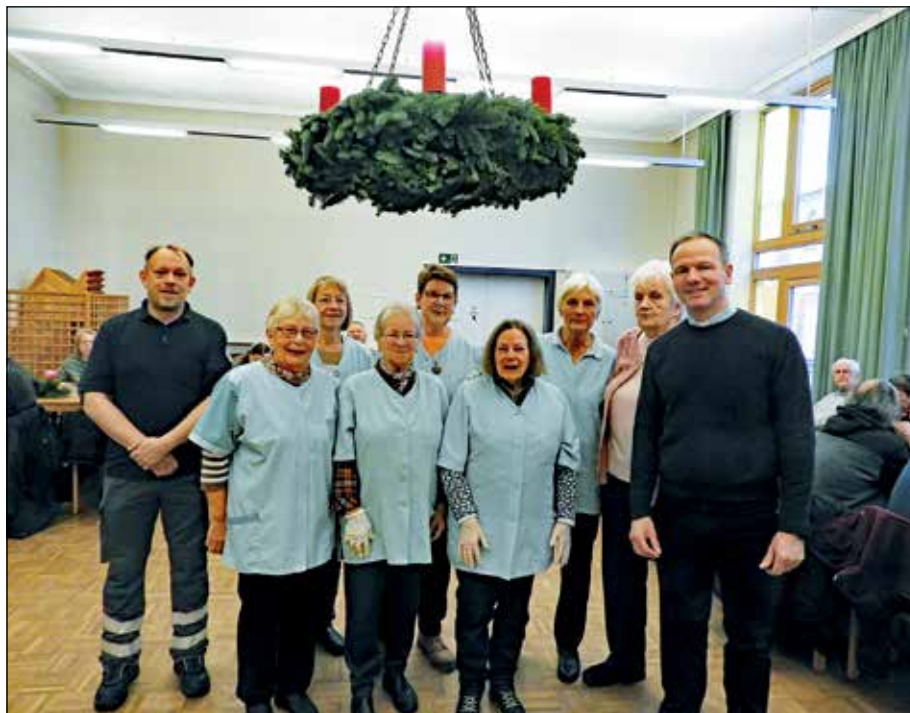
Gemeinschaft und ein gutes Essen – für die Kochgruppen und ihre Unterstützer von der DRK-Bereitschaft Eutin gehört das zusammen.