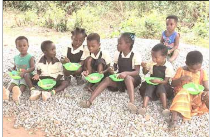
Eine Zukunft für Kinder zu schaffen, die sonst denkbar schlechte Chancen hätten, ist das Ziel von DAKi international.

setzen sich immer wieder neue Zwischenziele, helfen mit vermeintlichen Kleinigkeiten, die große Wirkung zeigen. Weil sie die Not überbrücken helfen und den Kindern signalisieren: „Ihr seid wichtig!“ Aktuell läuft eine besondere Spendensammlung unter dem Stichwort „Weih-