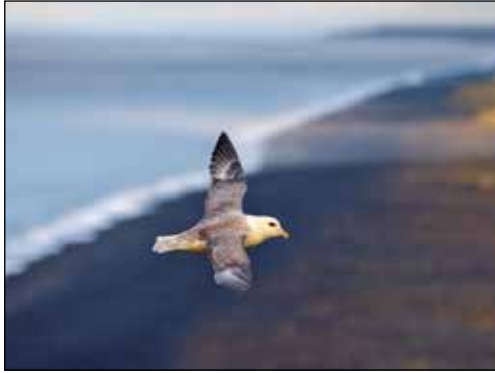
Eissturmvogel über Island