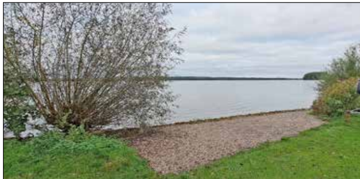
... nur 30 Meter entfernt ist ein offener Seezugang, der von jedermann genutzt werden kann.

Bürgermeister Jens Arendt vorgebrachte Argument des „Uferschutzes“ zieht er in Zweifel. Dafür seien die ergriffenen Maßnahmen „nicht sinnvoll“. Darüber hinaus sei der „herrliche Blick über den Plöner See“, mit dem der Tourismusverein Bosau wirbt, auch