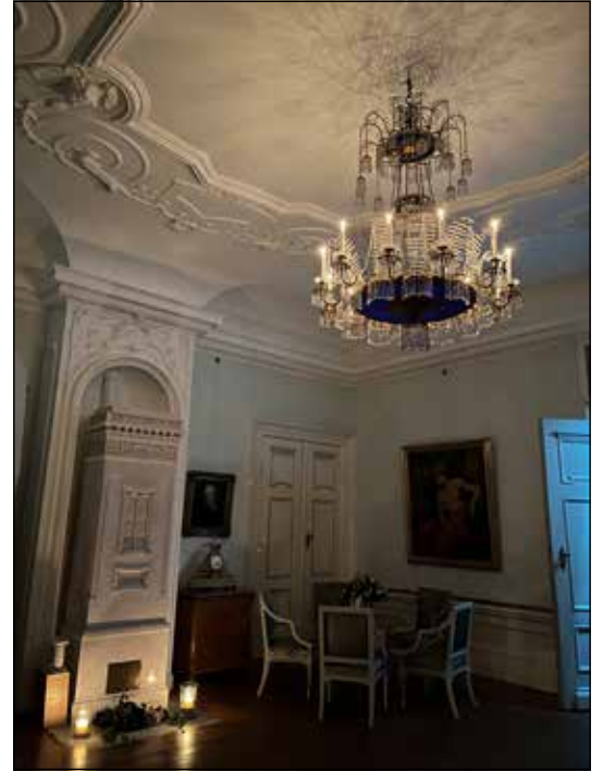
Beim Lichterfest erstrahlen die Räume im Schloss im Kerzenschein.

Die Veranstaltung organisiert die Stiftung zusammen mit dem Freundeskreis Schloss