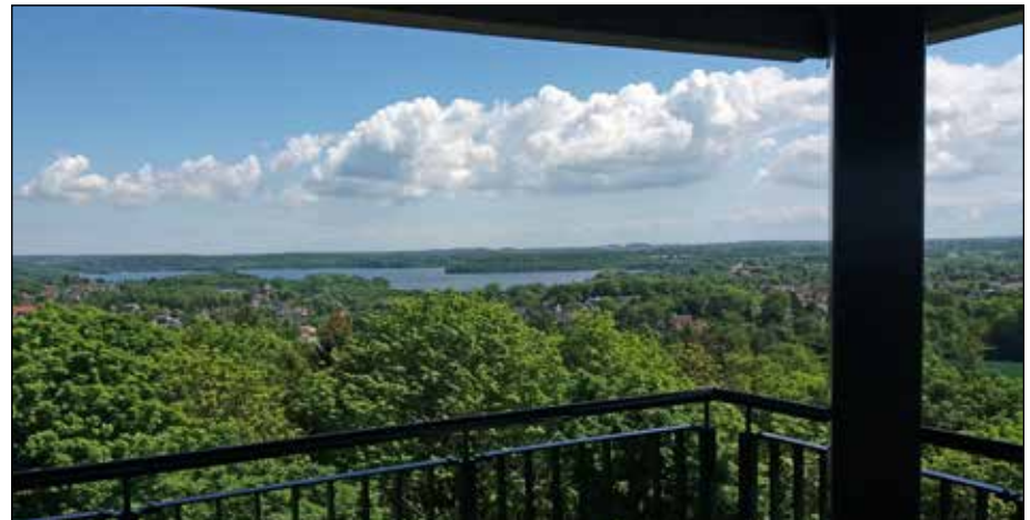
Diese Aussicht vom Holzbergturm ist jetzt auch online zu bewundern.

Ost – überträgt die Livebilder in die große weite Welt. Der Link ist auf der Internetseite des Fördervereins Dorf & Natur Malente auf www.wildpark-malente.de/holzbergturm/webcam.php zu finden.