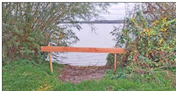
Weil der Nutzungsdruck gestiegen ist und der Uferschutz nicht mehr gewährleistet war, wurden diese kleinen Buchten gesperrt, denn ...