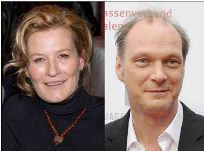
Preisträger sind 2023 unter anderem die vielfach ausgezeichneten TV-Stars Suzanne von Borsody und Martin Brambach.