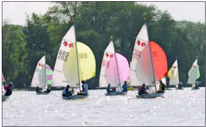
Der Segelnachwuchs trifft sich am Wochenende in Malente.

ten gemeldet. Die Meisterschaften werden in fünf Wettfahrten ausgesegelt. Davon werden drei Wettfahrten am Samstag und zwei Wettfahrten am Sonntag unter der bewährten Leitung von Günter Heppes gestartet. Erster Start ist am Samstag um 13 Uhr und am Sonntag um 11 Uhr. Gäste sind auf dem Clubgelände im Klaus-Groth-Weg herzlich willkommen. Von der SVMG sind insgesamt sechs Teams am Start, davon zwei in der 420er-Klasse und vier Teams im „Teeny“. Die Siegerehrung wird gegen 15 Uhr erfolgen.