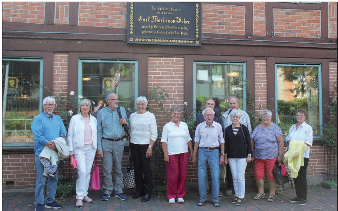
Klassenfoto nach 60 Jahren vor dem Webercafé. Wer nicht kommen konnte, war trotzdem dabei.