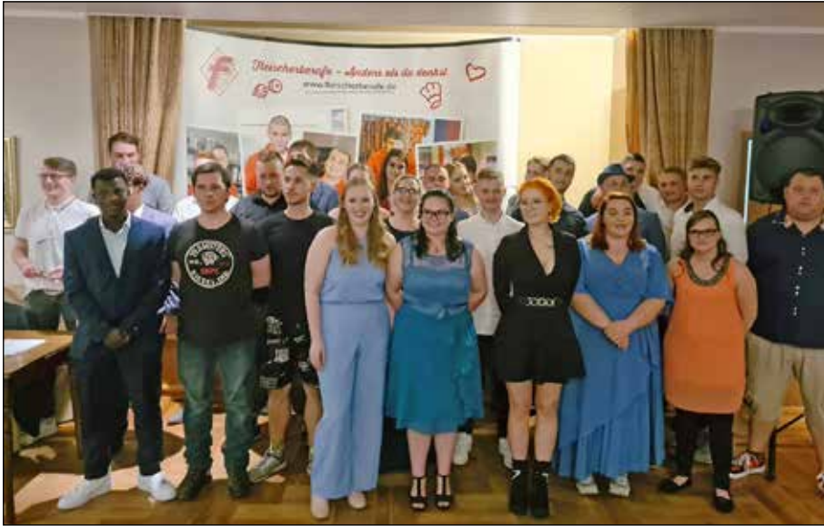
Die in der Abschlussprüfung des Jahres 2023 erfolgreichen Junggesell/innen des Fleischerhandwerks sowie Fachverkäufer/innen im Lebensmittelhandwerk – Schwerpunkt Fleischerei.

Seedorf (t). Nach drei Ausbildungsjahren und einer anspruchsvollen Abschlussprüfung konnten 24 junge Fleischerinnen und Fleischer sowie 13 Fachverkäuferinnen im Fleischerhandwerk im Rahmen der traditionellen Freisprechung der Fleischer-Innung Holstein in Seedorf aus den Händen von Innungsob-