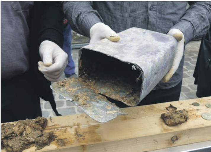
...und enthüllt ihren 150 Jahre alten Inhalt: Zeitungsbrei und fünf Münzen aus der Zeit vor der Grundsteinlegung am 2. September 1874.

behalten wird, sind zwar ange- „Schulden werden wir damit laufen und spakig, aber tadellos. wohl nicht bezahlen“, schmun-