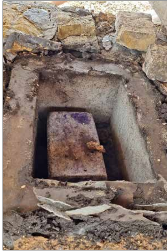
Da staunte das Team von Naturstein Wolf nicht schlecht, als sie unter dem Ehrenmal ein Kästchen entdeckten...

Herzogshaus.“ Das Ehrenmal, so erzählt die Historikerin, sei keine Siegestsäule wie in anderen Städten, sondern zu Ehren der 46 Männer aus der Region, davon