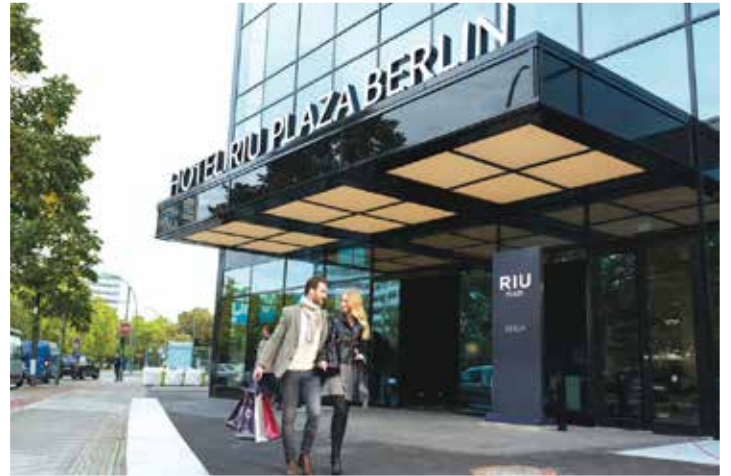
Eines der besten Hotels Berlins erwartet unsere Leser zum Superpreis mit dem RIU-PLAZA-Hotel in absoluter Top-Lage.

dem großen Gourmet-Frühstücks-Buffet genießen unsere Leser am 2. Tag die große Stadtrundfahrt