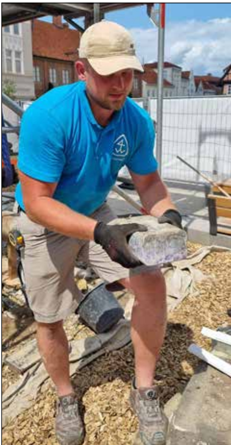
...und es vorsichtig aus seinem Futteral hoben.

sieben Eutiner, die im deutsch-französischen Krieg gefallen sind, und wurde aus Spendengeldern errichtet. Zwar gebe es hier und da Ehrenmäler, in denen eine Zeitkapsel gefunden wurde,