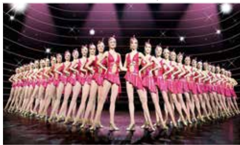
Eine Weltklasse-Show like Las Vegas präsentiert der Friedrichstadtpalast mit der nagelneuen Revue „falling in love“ in Berlin.

„Falling in Love“ inklusive Eintrittskarten für die Samstagabend-Vorstellung (Höherwertige Eintrittskarten in allen Kategorien bei uns buchbar!) Atemberaubende Bühnen-Bilder, 600 farbenprächtige Kostüme, 100 Tänzer:innen, modernste Theater-Technik und Weltklasse-Artistik prägen die teuerste und aufwendigste Super-Show des Friedrichstadtpalastes auf der größten Theaterbühne der Welt. Nach dem großen Gourmet-Frühstücks-Buffet genießen unsere Leser am 2. Tag die große Stadtrundfahrt