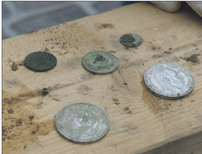
Während die Zeitung sehr gelitten hat, sind die Münzen bis auf eine noch deutlich erkennbar. Sie werden nun gründlich gereinigt und untersucht.

ein Krieg, in dem Menschen sterben.“ Also könnte vielleicht ein Aufsatz von jemandem, der aus der Ukraine flüchten musste, den Inhalt der Zeitkapsel ergänzen. Die Zeitung wird nun behutsam getrocknet, sodass ein Teil davon vielleicht wieder lesbar sein wird – und mit etwas Glück versteckt sich in dem Papierbrei auch noch ein persönliches Schriftstück, wie