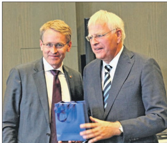
Ministerpräsident Daniel Günther hat sich mit dem Alt-Landrat zum Heimspiel der Bayern verabredet. Vielleicht sind die Karten in der blauen Tüte?