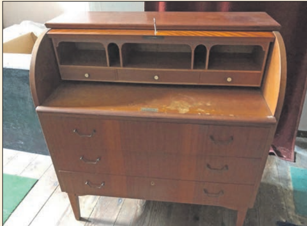
Aufgemöbelt: Vom alten Sekretär ...

Eutin (aj). Aufmöbeln - das schöne alte Wort kommt ein bisschen aus der Mode, was sich aber dahinter verbirgt, ist ein Trend, der sich hält und das ist angesichts begrenzter Ressourcen auch gut und richtig und wichtig: "Etwas (wieder) in einen ansehnlicheren, besseren Zustand bringen" das ist im Duden zur Bedeutung zu finden. Und wer upcycling, Do it yourself, DIY oder