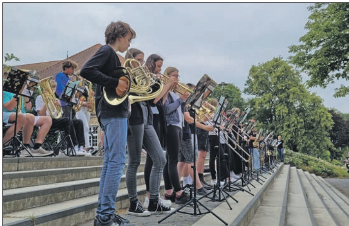
Von Klassikern wie Bruder Jakob bis hin zu Filmmusik von „Fluch der Karibik“ war das Liederrepertoire sehr vielfältig

die Klarinette, das Euphonium und das Saxofon. Auch kleine Solos der Instrumente innerhalb der Lieder haben die Musik aufgeheitert.