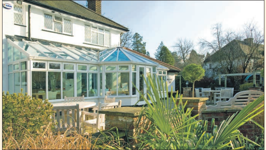
Wintergärten genügen heutzutage höchsten Ansprüchen auch an Wärmedämmung und Sicherheit.

Aufenthalt im Freien ist stets möglich, während die Gartenmöbel geschützt vor Wind und Wetter bleiben. Ein Terrassendach lässt viel Licht hindurch, doch bei einem Schauer muss mit der Grillparty noch lange nicht Schluss sein. Und lästige Putzpflichten haben ihren Schrecken verloren. Denn ein verglastes Terrassendach kann mit selbst reinigendem Glas ausgeführt werden: Regen und Sonne übernehmen dann das Reinemachen. „Es gibt hervorragende Oberflä-