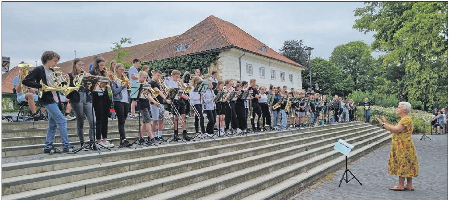
Das Sommerkonzert der Bläserklassen ist ein Highlight im Schuljahr an der Eutiner-Wisserschule. Und dank des Auftrittsortes können sich alle mitfreuen. Lesen Sie gern mehr auf Seite 4.

Über den Abschied von Bayernfan Reinhard Sager lesen Sie auf Seite 2