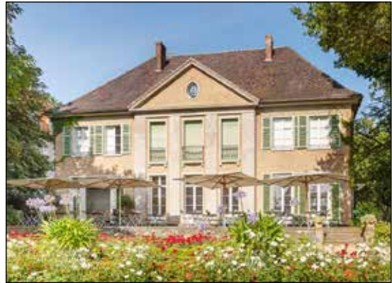
Die berühmte Liebermann-Villa am Wannsee entdecken unsere Leser mit einer großen Sonder-Führung (Liebermann)

internationalen First-Class-Hotel mit großzügigem Schlemmer-Frühstück vom Buffet in der Schlösserstadt Potsdam mit großer Wellnessabteilung und Hallenbad, die Busfahrt im 4-Sterne-Reisebus erfolgt direkt ab Eutin. In allen drei Museen sind die Eintrittsgelder im Reisepreis enthalten und unsere Leser können direkt und ohne Warteschlangen zu festen Einlasszeiten die Museen mit unserem perfekten Leser-Reisen-Service besuchen.