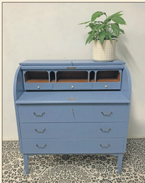
...zum schicken Blickfang

"Aus alt mach neu" sagt, meint im Grunde dasselbe. Aus Jeanshosen werden Taschen, aus Kochtöpfen Pflanzgefäße, ungenutzte Zaun-