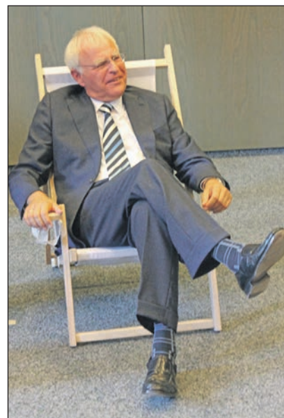
Den Liegestuhl zum Relaxen hat der neue Landrat selbst zusammengebaut.