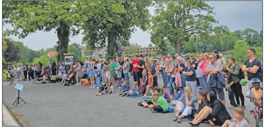
Viele Eltern, Großeltern und Geschwister kamen, um den großen Fortschritt der Schüler zu bestaunen