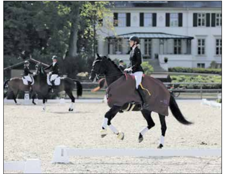
Siegerehrungen vor der Kulisse des Herrenhauses gehörten mit zu den Highlights des Dressurturniers.