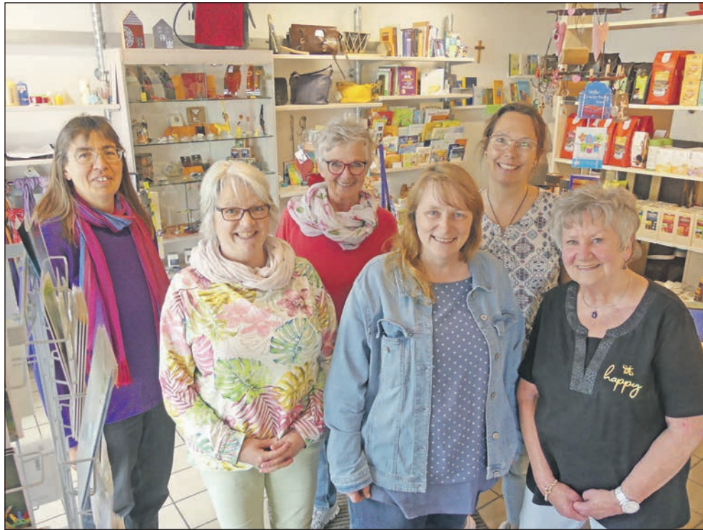
Der Ahrensböcker Kirchenladen und sein Team sagen Tschüs – am 10. Juni schließen die Damen die Tür ein allerletztes Mal ab, aber vorher wird gefeiert: Am kommenden Samstag mit einer Abschiedsparty und in der Woche danach mit tollen Rabatten.

Jetzt muss der Kirchenladen schließen – zuerst Corona, dann die Teuerungen vor allem im Lebensmittelbereich haben ihm so zugesetzt, dass er nicht mehr wirtschaftlich betrieben werden kann. „Wir hatten es fast ge-