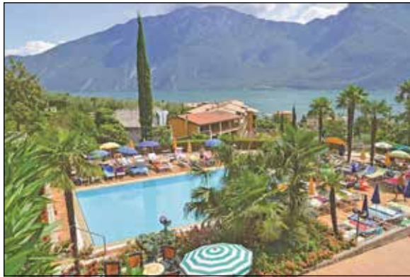
Traumhafte Urlaubstage im komfortablen 4-Sterne-Hotel erwarten unsere Leser bei der großen Herbstferien-Sonderreise an den Gardasee nach Limone.

Eutin (t). Einen ganz besonderen Herbstferien-Reise-Knüller präsentieren die Reporter-Leser-Reisen direkt ab Eutin in den Herbstferien vom 21. bis 27. Oktober 2023 mit einer Verlags-Sonderfahrt zum Schnäppchenpreis von nur 499,90 Euro an den größten italienischen See bei noch warmen Temperaturen mit seinem einzigartigen, milden Klima und der üppigen Mittelmeer-Vegetation.