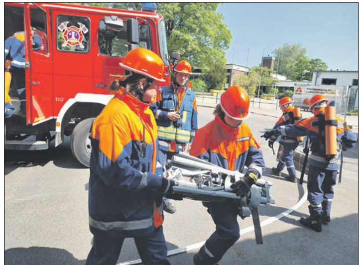
Voller Einsatz: Die Jugendfeuerwehr bereitet den Übungseinsatz vor.

üben auch jüngere Ehrenamtler zum Beispiel den Umgang mit Löschschaum. Unter den 30 Jugendlichen, die aktuell in der Jugendfeuerwehr Süsel tätig sind, sind bemerkenswert viele kleine Retter. Auch die vielen Zehnjährigen können aber bereits Verantwortung übernehmen und sind bei allen Übungen genau wie die anderen bis zu 18 Jahre alten Feuerwehrleute dabei. Wer Lust hat, sich auch ehrenamtlich bei der Feuerwehr zu engagieren, ist bei jeder Feuerwehr in der Nähe herzlich willkommen und muss natürlich auch nicht zwangs-