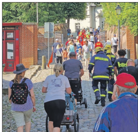
...und liefen, spazierten und schoben sogar Kinderwagen für den guten Zweck.

erfolgreiche Benefizlauf "Jede Runde hilft" (zirka 2,5 km langer Rundkurs über Schlossgebiet, Siebenstern und Strandweg) zur finanziellen Unterstützung der Jugendarbeit der Vereine und Institutionen vor Ort statt. Alle sind eingeladen, sich auf eine- oder mehrere Runden des Benefizlaufs zu machen. Ganz nach eigenem Wunsch kann hierbei gelaufen,