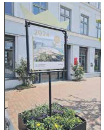
ckets sind außerdem auf eutinerfestspiele.de verfügbar.