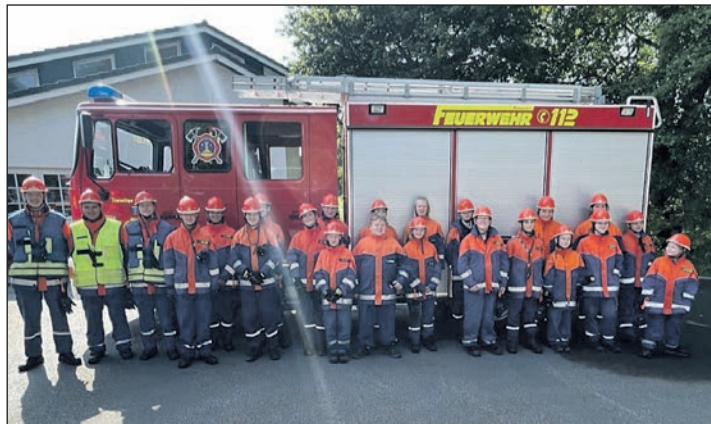
Insgesamt 22 Jugendfeuerwehrleute nahmen an dem 24-stündigen Probendienst teil.