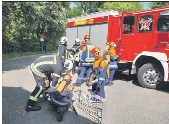
Jeder Handgriff muss sitzen und Teamwork ist gefragt.

durchzuspielen. In Szenarien wie diesen lernen die Juniorretter, wie sie sich im Ernstfall verhalten müssen. Auch den Funkkontakt zwischen Einsatzleitung und verschiedenen Fahrzeugen üben sie mit großer Ernsthaftigkeit. Der gemeinsame 24-Stunden Dienst ist bei der Jugendfeuerwehr ein echtes Highlight, schon 14mal trafen sich junge Feuerwehrleute um den Alltag der Berufsfeuerwehr besser nachvollziehen zu können. Aufgrund des Corona-Virus musste die Übung 2020 und 2021