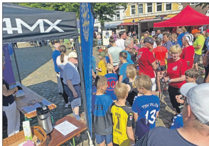
"Jede Runde hilft": Da ließen sich sich die Plöner*innen im letzten Jahr nicht lang bitten...

Gegen 12.30 Uhr werden auf dem Marktplatz die glücklichen Preisgewinner der Tombola bekanntgegeben.