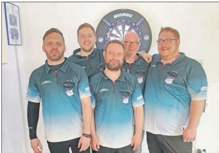
Stolz und erfolgreich: Die Fissauer Darter.

Ein super Team holte am letzten Spieltag einen deutlichen und verdienten 19:3 Erfolg in Döbersdorf und machte so die Meisterschaft im Fernduell mit den Schönberger Beach Bulls perfekt, die auch noch eine Chance auf die Meisterschaft gehabt hätten. Tolle Leistungen über die ge-