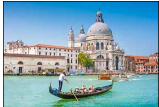
Der Höhepunkt des großen Ausflugsprogramms der Gardasee-Sonder-Reise im Oktober ist die Tagesfahrt in die weltberühmte Lagunenstadt Venedig.

nenstadt Venedig ist zubuchbar zum Sonderpreis von nur 34,95 Euro, eine große Tagesfahrt in die Festspielstadt Verona für nur 19,90 Euro. Die Kurtaxe ist direkt vor Ort im Hotel zu zahlen. Anmeldungen sind ab sofort möglich bei den Reporter-Leser-Reisen per Telefon 04521/701130, täglich von 9 bis 13 Uhr oder per Mail unter „leserreisen.derreporter.info“.