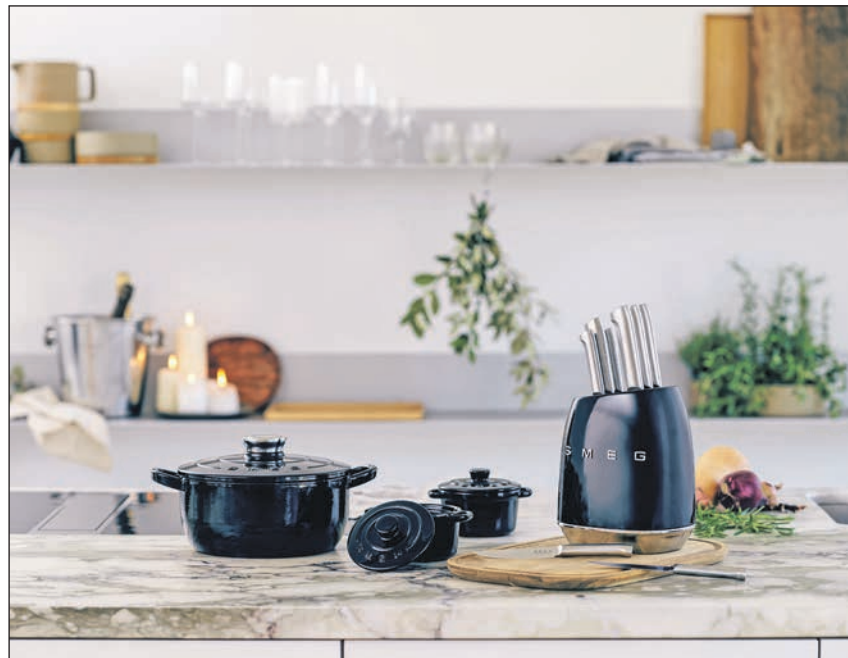
Bei familia und Markant startet eine neue Treueaktion – wer hier Punkte sammelt, kann sich auf stilvolle Küchenhelfer von Smeg freuen.

Die Smeg-Produkte machen in der Küche eine richtig gute Figur. Verschiedene Messer, Messerblöcke, Schmortöpfe, Pfannen und ein Schneidebrett stehen in der aktuellen Treueaktion zur Wahl. Kundinnen und Kunden von familia und Markant können bis zu 82 Prozent gegenüber dem Preis ohne Treuepunkte sparen. Ein zusätzliches Highlight ist das Gewinnspiel, bei dem jede Woche ein Smeg-Kühlschrank verlost wird. Wer ein Smeg-Produkt aus der Aktion gekauft hat, kann teilnehmen.