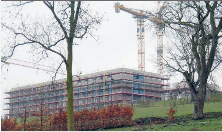
Sicht von der Westtangente