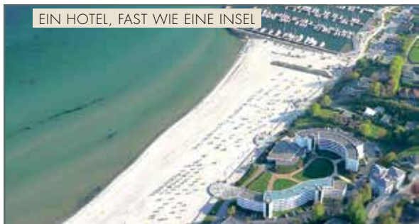
EIN HOTEL, FAST WIE EINE INSEL

STRAND IDYLL ★★★★★ Uferstraße 26 | 23743 Grömitz 04562/1890 | hotel@strandidyll.de