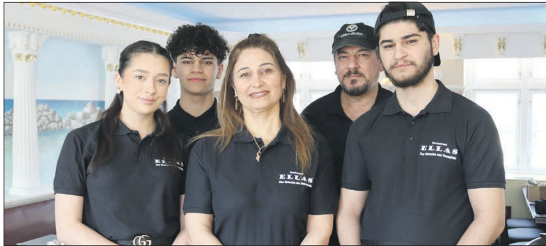
Traumhafte Urlaubsstimmung und kulinarischer Gaumenkitzel: Das Team vom neuen Restaurant „Ellas“ am Vossplatz 4 erwartet die Gäste zum Genießer-Aufenthalt.

Dazu war zwei Monate ein griechisches Spezialisten-Team von der Insel Kreta für die Ausstattung hochwertiger griechischer Restaurants am Vossplatz tätig, um die einmalige Stimmungslage der Urlaubs-Insel nach Eutin zu zaubern. Zwischen alten Amphoren, malerischen Säulen und verträumten Wand-Mosaiken sowie traumhaften Wandmalereien und eindrucksvollen Landschaftsbildern aus dem Sonnenland am Mittelmeer werden die Besucher gleichermaßen verwöhnt und überrascht. Ein völlig neues Beleuchtungs-Konzept sorgt für ganz ein besonders stilvolles Ambiente. Das Marketing-Konzept von „El-