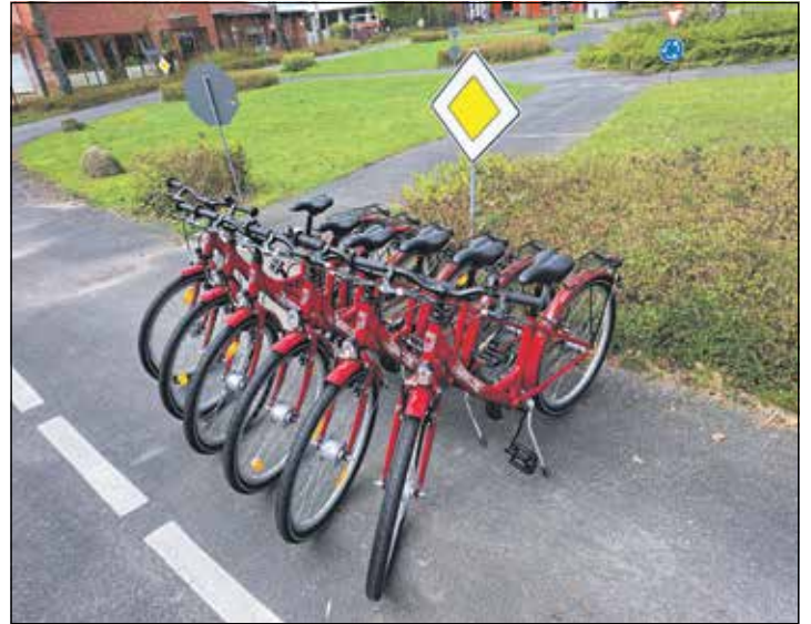
Sechs neue Fahrräder gab es für die Verkehrswacht Ostholstein.