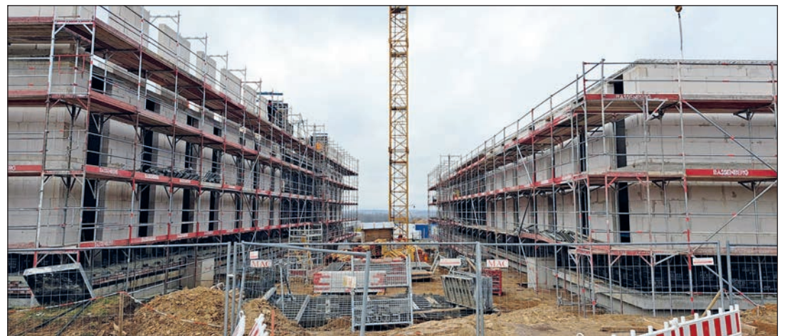
228 UnterakunftsZimmer für Aus- und Fortzubildende der Polizei sollen auf der Hubertushöhe zur Verfügung stehen

Eutin (tgr). Beim Befahren der Eutiner Westtangente in Richtung Malente kann man den Rohbau eines von drei neuen Unterakunftsgebäudes (Fotos) bereits auf dem Gelände der Polizeidirektion für Aus- und Fortbildung und Bereitschaftspolizei entdecken. Vor neun Monaten wurden die Bauarbeiten auf Hubertushöhe begonnen. Und ab Sommer kommenden Jahres soll es dann soweit sein: Dann werden 228 UnterakunftsZimmer für Aus- und Fortzubildende der Polizei zur Verfügung stehen. Das Land investiert rund 37 Millionen Euro in die Neubauten, die unter der