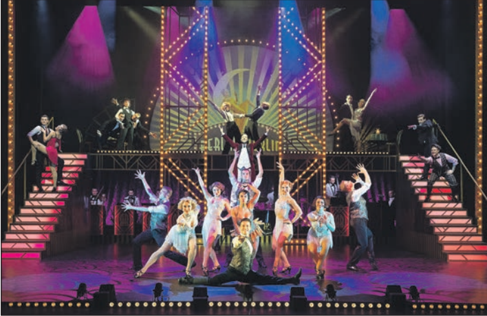
Weltklasse-Entertainment genießen unsere Leser im Sommer in der Semper Oper Dresden mit der Gala-Show „Berlin/Berlin“

Mit großem Orchester, Ballett und 30 Mitwirkenden präsentiert die Semper Oper Dresden unseren Lesern die große Show der „Goldenen 20er Jahre“.